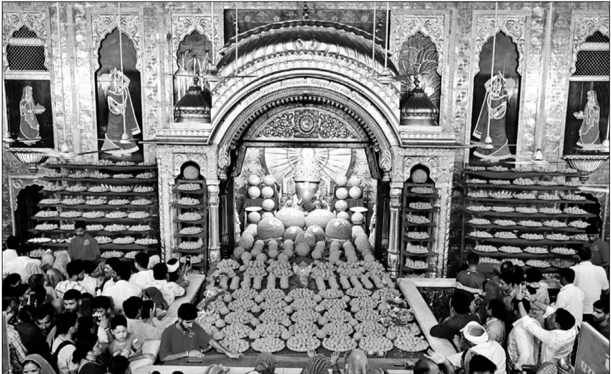
मोतीडूंगरी गणेश मंदिर में मनाए जा रहे गणेश जन्मोत्सव में बुधवार को मोदकों की भव्य झांकी सजाई गई। झांकी का मुख्य आकर्षण 251-251 किलोग्राम के दो विशाल मोदक रहे।