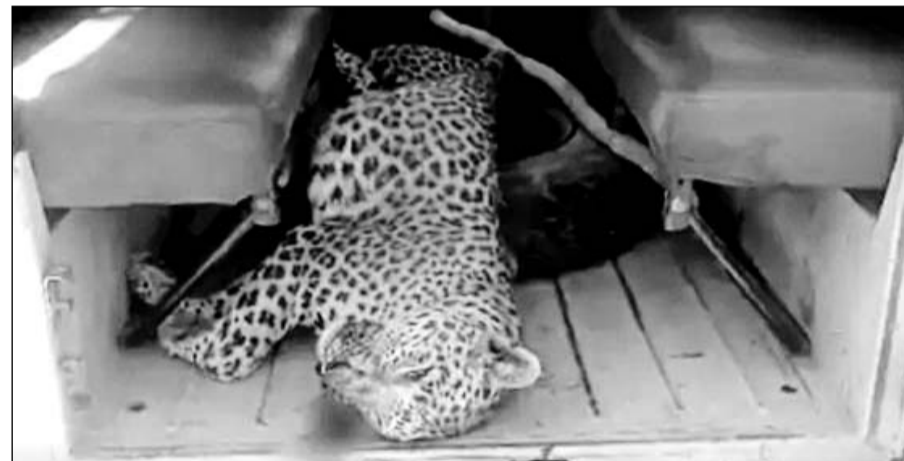
वन विभाग की टीम अंतिम संस्कार के लिए लेपर्ड के शव को सागवाड़ा वन विभाग के ऑफिस ले गई।

■ तालाब से नहाकर लौट रहे युवक पर लेपर्ड ने हमला कर घायल कर दिया था