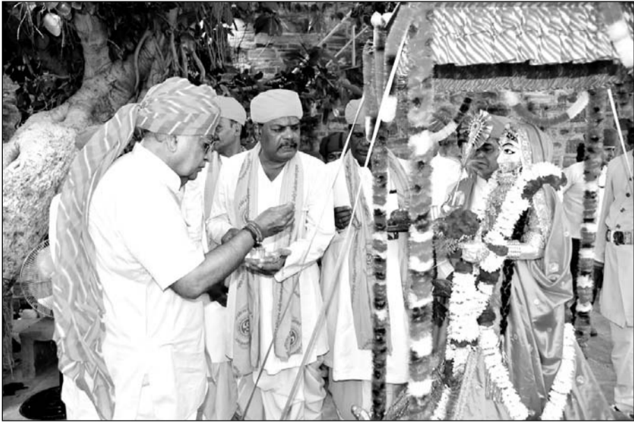
जोधपुर में पूर्व महाराजा गजसिंह ने शाही गणगौर का पूजन किया।