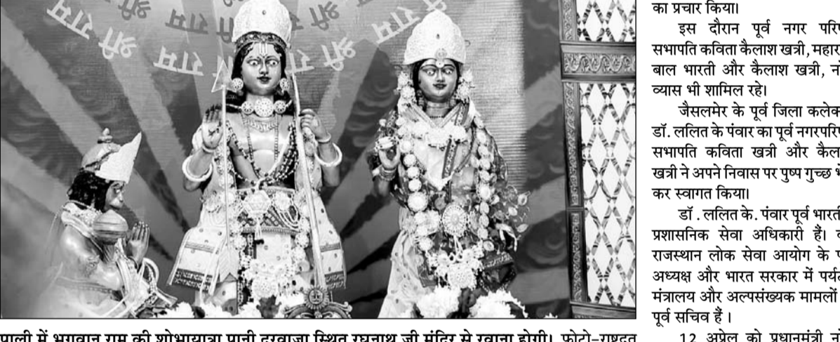
पाली में भगवान राम की शोभायात्रा पानी दरवाजा स्थित रघुनाथ जी मंदिर से रवाना होगी।

पाली, (नि.सं.)। नव वर्ष समिति, विश्व हिंदू परिषद, बजरंग दल समिति हिंदू संगठन की अगुवाई में भगवान राम की भव्य शोभायात्रा पानी दरवाजा स्थित रघुनाथ जी मंदिर से मंगलवार सुबह धूमधाम से रवाना होगी। शोभायात्रा में सामाजिक संगठनों,