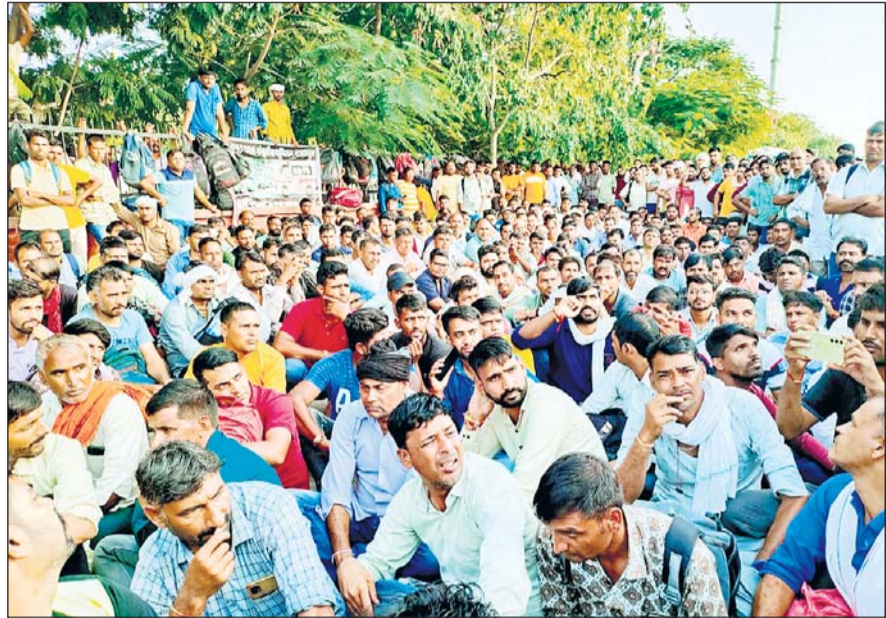
प्रदेश में एंबुलेंस कर्मियों की हड़ताल सोमवार को तीसरे दिन भी जारी रही। इससे मरीजों को भारी परेशानियों का सामना करना पड़ा। कई मरीजों को एंबुलेंस नहीं मिलने से अन्य साधनों से अस्पताल आना पड़ा।

जयपुर सहित प्रदेश में राजस्थान एंबुलेंस कर्मचारी संघर्ष समिति के आह्वान पर सोमवार को तीसरे दिन भी एम्बुलेंस कर्मियों की हड़ताल जारी रही