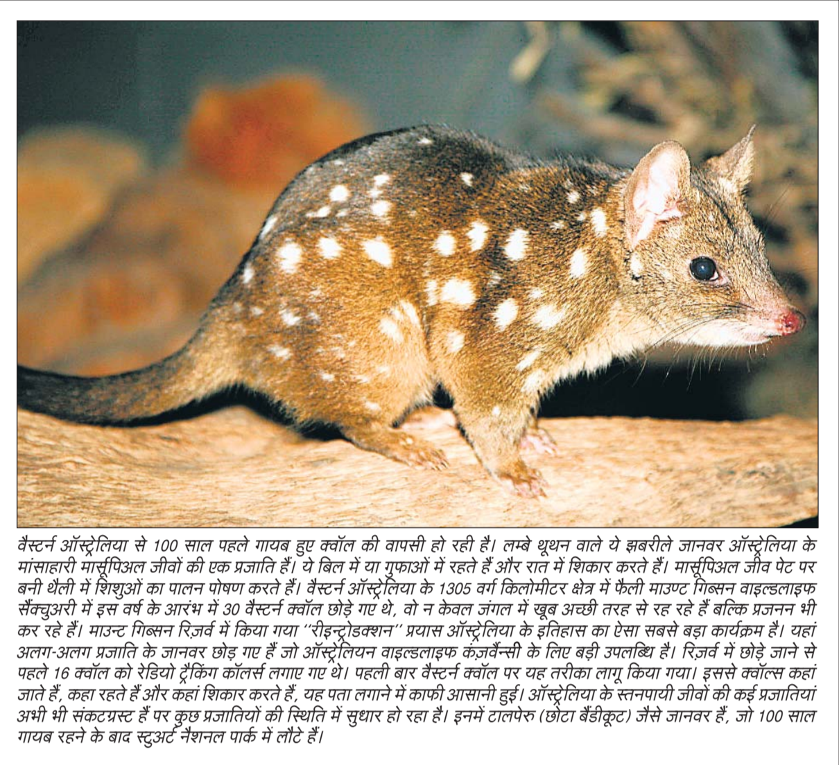
वैस्टर्न ऑस्ट्रेलिया से 100 साल पहले गायब हुए क्वॉल की वापसी हो रही है। लम्बे ध्यान वाले ये झबरीले जानवर ऑस्ट्रेलिया के मांसाहारी मार्सूपियल जीवों की एक प्रजाति हैं। ये बिल में या गुफाओं में रहते हैं और रात में शिकार करते हैं। मार्सूपियल जीव पेट पर बनी थैली में शिशुओं का पालन पोषण करते हैं। वैस्टर्न ऑस्ट्रेलिया के 1305 वर्ग किलोमीटर क्षेत्र में फैली माउण्ट गिब्सन वाइल्डलाइफ सर्वेकुअरी में इस वर्ष के आरंभ में 30 वैस्टर्न क्वॉल छोड़े गए थे, वो न केवल जंगल में खूब अच्छी तरह से रह रहे हैं बल्कि प्रजनन भी कर रहे हैं। माउण्ट गिब्सन रिजर्व में किया गया "रीइन्ट्रोडक्शन" प्रयास ऑस्ट्रेलिया के इतिहास का ऐसा सबसे बड़ा कार्यक्रम है। यहां अलग-अलग प्रजाति के जानवर छोड़े गए हैं जो ऑस्ट्रेलियन वाइल्डलाइफ कंजर्वेन्सी के लिए बड़ी उपलब्धि हैं। रिजर्व में छोड़े जाने से पहले 16 क्वॉल को रेडियो ट्रेकिंग कॉलर्स लगाए गए थे। पहली बार वैस्टर्न क्वॉल पर यह तरीका लागू किया गया। इससे क्वॉल्स कहा जाते हैं, कहा रहते हैं और कहां शिकार करते हैं, यह पता लगाने में काफी आसानी हुई। ऑस्ट्रेलिया के स्तनपायी जीवों की कई प्रजातियां अभी भी संकटग्रस्त हैं पर कुछ प्रजातियों की स्थिति में सुधार हो रहा है। इनमें टालपेर (छोटा बैडीकूट) जैसे जानवर हैं, जो 100 साल गायब रहने के बाद स्टुअर्ट नेशनल पार्क में लौटे हैं।