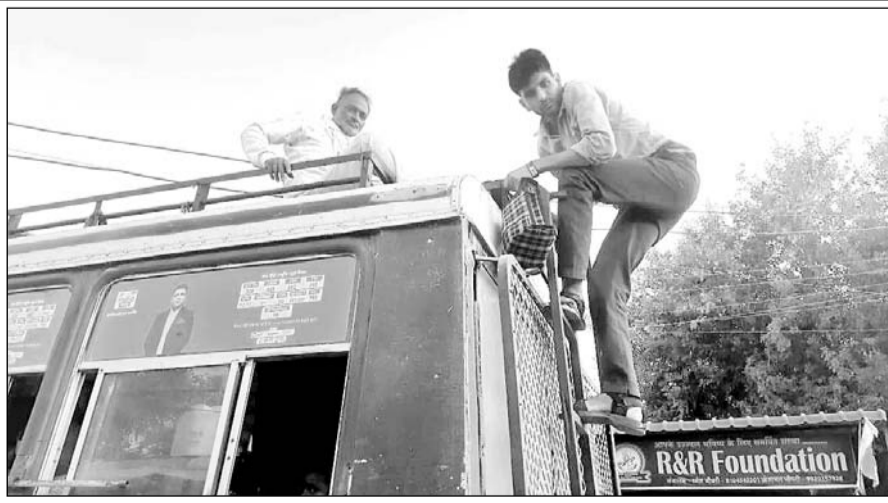
अरांड में रोडवेज बस पर बैठकर यात्रा करते यात्री।