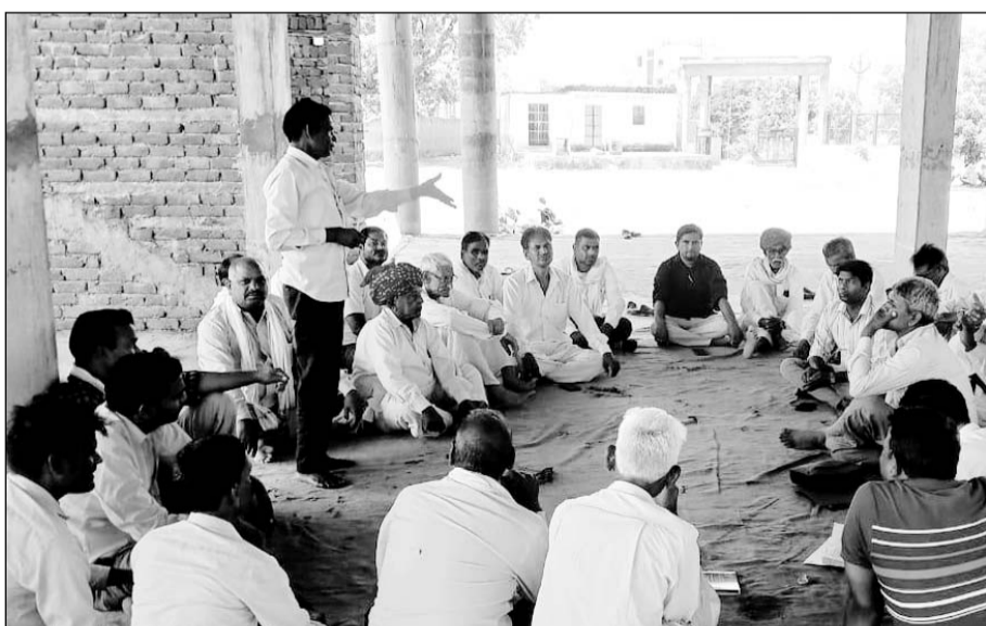
महात्मा ज्योतिबा फुले सेवा संस्थान की बैठक संपन्न।

के लोग राजनैतिक, सामाजिक, शैक्षिक, आर्थिक स्थिति से कमजोर है। बैठक में समाज के छात्रावास पर हो रहे निर्माण कार्य के आर्थ-व्यय का विवरण प्रस्तुत करते हुए, सावित्री बाई फुले सेवा संस्थान, फागी रोड, रेलवे स्टेशन के पास चाकसू पर आगामी अनावस्था 15 सितंबर 2023 को समाज की सामूहिक गोठ का आयोजन करते हुए मीटिंग का आयोजन किया जाना है साथ ही समाज