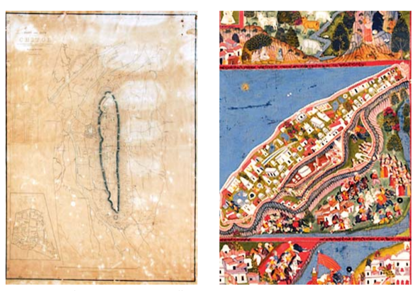
These two maps of Chittorgarh highlight the difference between indigenous and modern western cartography.

new age technology and methodology. The exhibition of maps is one such initiative.