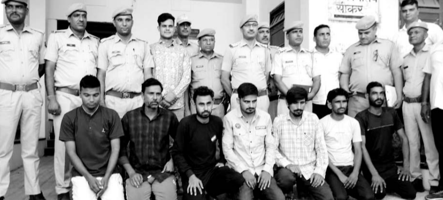
पुलिस ने विभिन्न स्थानों पर दबिश देकर आरोपियों को गिरफ्तार किया।

चार लाख दस हजार रुपये बरामद किये, हत्या, लूट, बलात्कार आदि प्रकरणों में वांछित है आरोपी