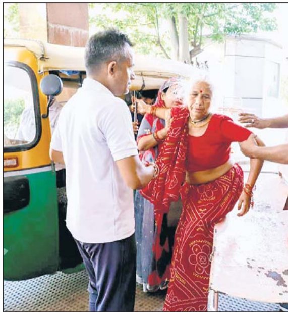
प्रदेश में एंबुलेंस कर्मियों की हड़ताल सोमवार को तीसरे दिन भी जारी रही। इससे मरीजों को भारी परेशानियों का सामना करना पड़ा। कई मरीजों को एंबुलेंस नहीं मिलने से अन्य साधनों से अस्पताल आना पड़ा।