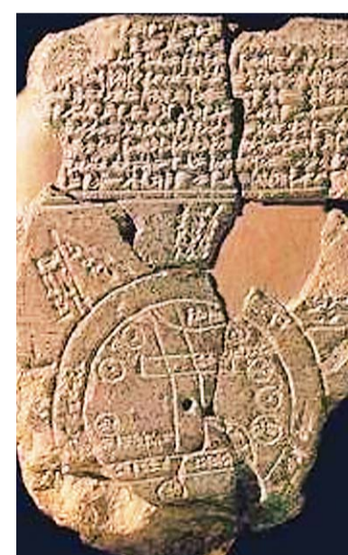
Two examples of earliest known maps drawn on ivory and clay tablets from Mesopotamia.