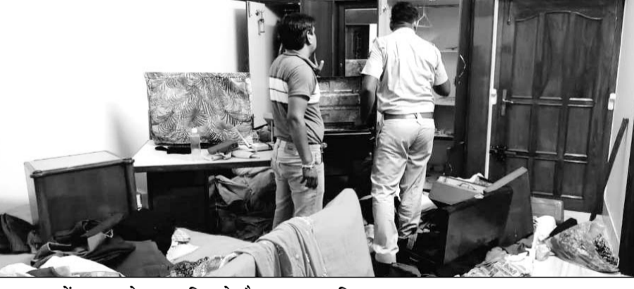
सुजानगढ़ में वारदात के बाद पुलिस ने मौका मुआयना किया।