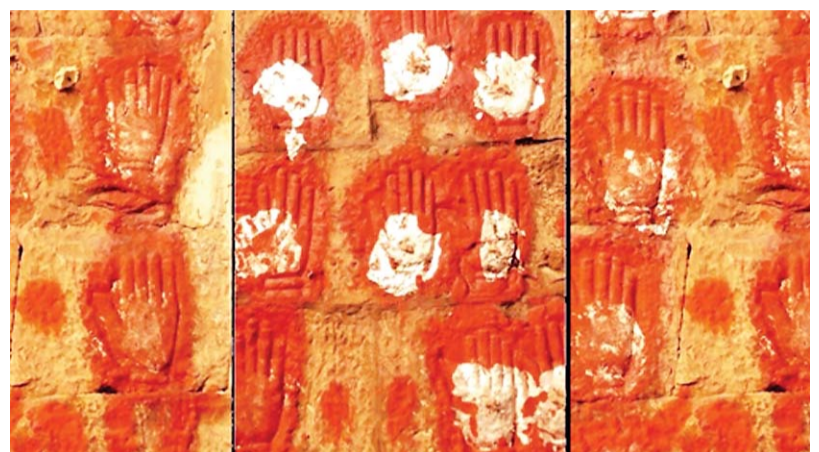
Seige of Chitor and Sutteee Handprints