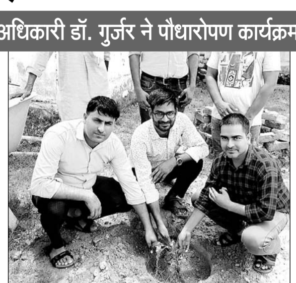
कैमरी गांव के सामुदायिक स्वास्थ्य केन्द्र पर पौधारोपण अभियान के तहत दर्जनों पौधे लगाए गए।

सुटीव सरपंच ने पेड़ों को पूजनीय बताते हुए इनकी कटाई पर लगाए गए।