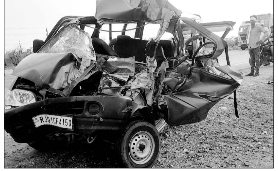
दुर्घटना इतनी भीषण थी कि कार के आगे का हिस्सा चकनाचूर होकर कबाड़ में तब्दील हो गया।

मृतक की पत्नी के अलावा सात घायल, अजमेर रेफर