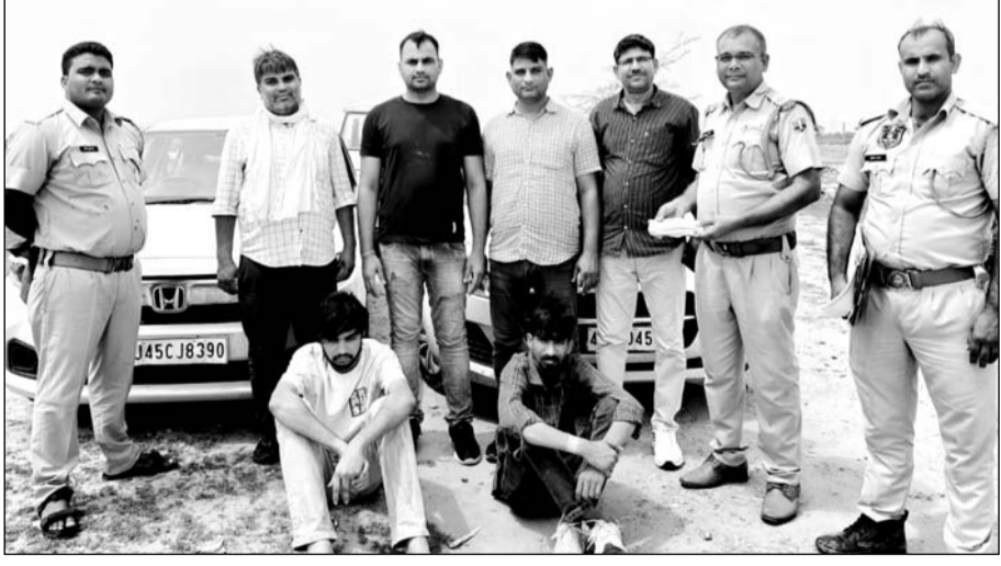
रामनगरिया पुलिस ने फिरोती के लिए 3 युवकों का अपहरण करने वाले दो बदमाशों को गिरफ्तार किया।