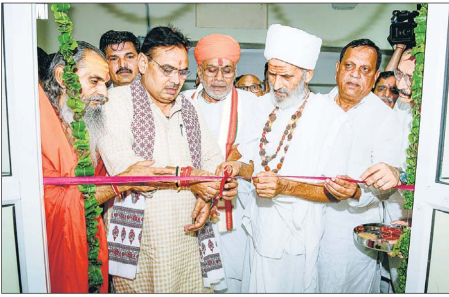
मुख्यमंत्री भजनलाल शर्मा ने जयपुर में राजपुरोहित छात्रावास का उद्घाटन किया। इस सार्वजनिक कार्यक्रम में संतजनों की भी उपस्थिति रही।

मुख्यमंत्री ने कहा कि पिछली सरकार ने हमारी युवा शक्ति को निराशा की गर्त में धकेल दिया था। पेपर लीक की घटनाओं से कड़ी मेहनत करने वाले इमानदार विद्यार्थियों का मनोबल टूट गया था। उन्होंने कहा कि हमारी सरकार बनते ही पेपर लीक के मामलों की जांच