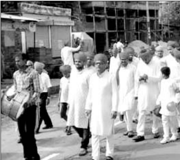
करोली के प्रमुख मार्गों से होकर गुजरती मंगल प्रवेश शोभा यात्रा।