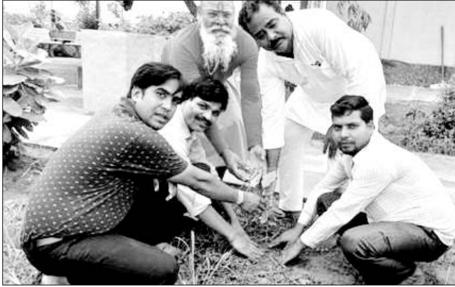
करोली में भाजपा कार्यकर्ताओं ने एक पौधा मां के नाम अभियान के तहत पौधा रोपण किया।