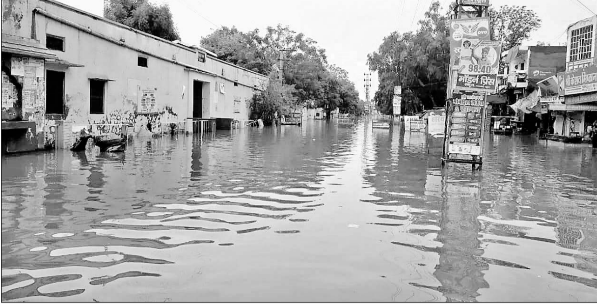
तारानगर में मूसलाधार बरसात होने से बाजारों में पानी भर गया।