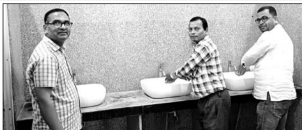
रामदेवजी महाराज के मेला परिसर में अवस्थित सार्वजनिक शौचालय को रेनोवेशन करवाया गया।

ईओ अनिल कुमार ने बताया कि गुप्ता के नवलगढ़ शहर के भ्रमण के दौरान स्वच्छता के प्रति जागरूकता एवं प्रदत्त निर्देशों को अनुपालना में निर्देशों की अक्षरशः पालना में केन्द्र सरकार द्वारा संचालित "स्वच्छ भारत मिशन" योजनागत स्वच्छ सर्वेक्षण की क्रियाविधि के लिए निर्देशानुसार रामदेवजी महाराज के मेला परिसर में अवस्थित सार्वजनिक शौचालय को रेनोवेशन करवाया गया। उक्त शौचालय पर साफ-सफाई के लिए दो-दो कार्मिकों की ड्यूटी लगाई गई है। जिनके द्वारा प्रतिदिन तीन बार सफाई