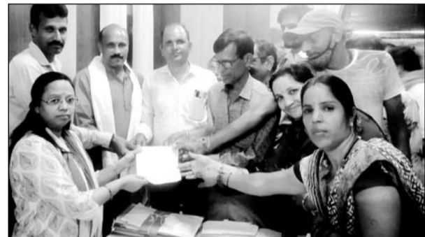
नागरिक अधिकार मोर्चा के कार्यकर्ताओं ने जिला कलेक्टर को ज्ञापन सौंपा।

जानकारी के अनुसार जिले में बजरी का टेका नहीं होने के बावजूद भी खनिज विभाग पूर्व के टेकेदारों की मदद से अवैध खनन भारी मात्रा में करवा रहे हैं। खनिज विभाग द्वारा बजरी एवं खनन माफिया से मिलकर हमेशा करोड़ों रूपय के राजस्व का नुकसान किया जा रहा है। खनिज विभाग में प्रशासन की मिलीभगत से अवैध बजरी दोहन परिवहन से राजस्व को नुकसान