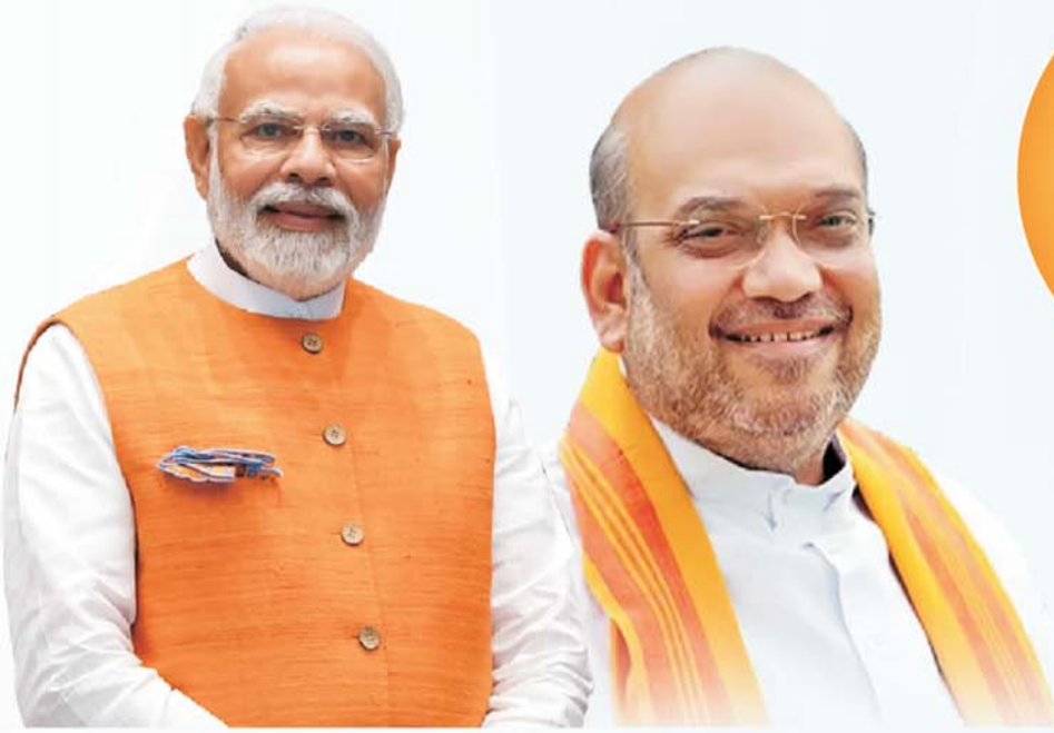
नरेन्द्र मोदी प्रधानमंत्री-भारत सरकार