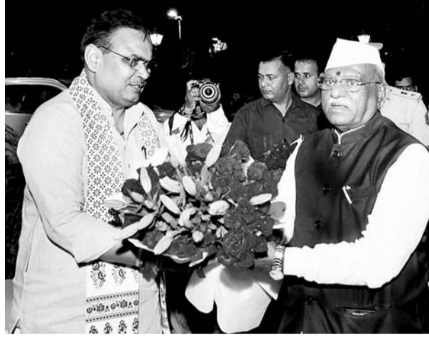
मुख्यमंत्री निवास पर नव नियुक्त राज्यपाल हरिभाऊ किशनराव बागड़े का मुख्यमंत्री भजनलाल शर्मा ने स्वागत किया।

जोड़ा जाए, इससे पहले राज्यपाल ने मुख्यमंत्री निवास पर नव नियुक्त राज्यपाल हरिभाऊ किशनराव बागड़े का मुख्यमंत्री भजनलाल शर्मा ने स्वागत किया।