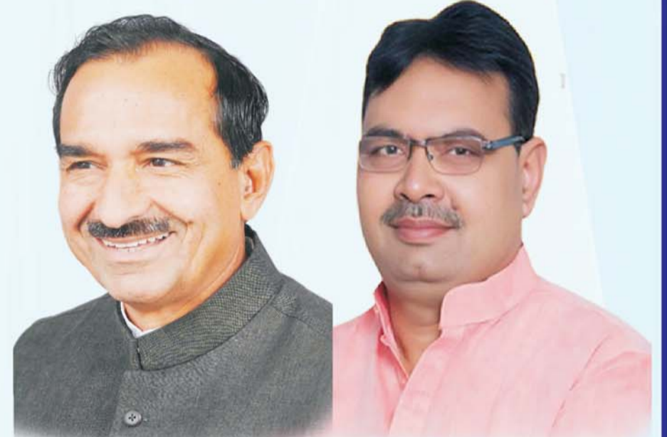
मदन राठौड प्रदेश अध्यक्ष-भाजपा