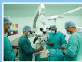
मॉड्यूलर ऑपरेशन थियेटर