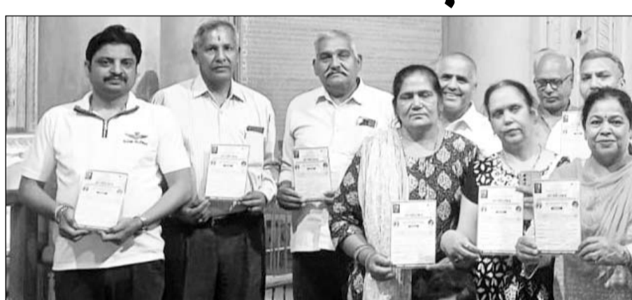
भरतपुर विप्र फाउंडेशन की ओर से भगवान परशुराम का जन्मोत्सव 10 मई से धूमधाम से मनाया जायेगा।

मई से तीन दिवसीय भगवान परशुराम की कथा प्रारम्भ होगी। जिसकी यात्रा प्रातः 7 बजे गायत्री मन्दिर किला से प्रारम्भ होकर बिहारी जी मन्दिर खाद श्याम मन्दिर मनसा देवी हनुमान मन्दिर चांदपोल दरवाजा होते हुए परशुराम मन्दिर सुंदरलाल बजाज बागीची सरकुलर रोड पर पहुंचेगी और कथा प्रारम्भ दोपहर 12 बजे से 4 बजे तक होगी। 9 मई को प्रातः 8 बजे गो शाला काली की बागीची में गो सेवा की जाएगी। तपश्चात् 12 से 4