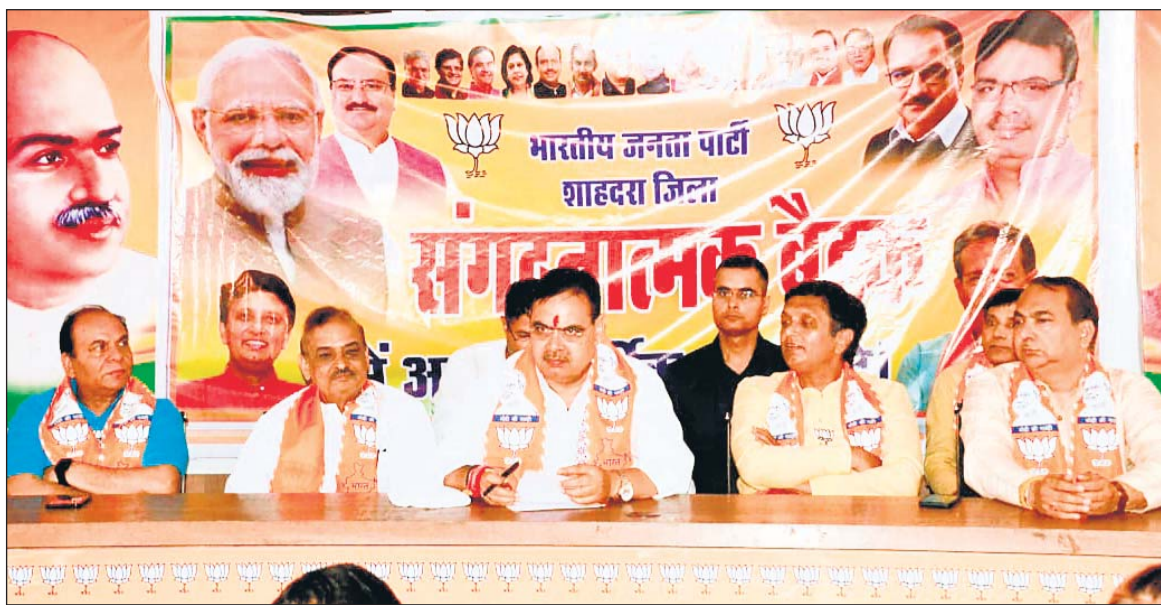
मुख्यमंत्री भजनलाल शर्मा राजस्थान, पं. बंगाल एवं झारखण्ड में चुनाव प्रचार के बाद अब दिल्ली में प्रचार कार्यक्रम की जिम्मेदारी संभाल रहे हैं। उन्होंने रविवार को पूर्वी दिल्ली लोकसभा क्षेत्र के शाहदरा स्थित भाजपा जिला कार्यालय में पार्टी कार्यकर्ताओं की समीक्षा बैठक की। इस मौके पर उन्होंने कार्यकर्ताओं की तारीफ की और उनका मनोबल बढ़ाने का प्रयास किया। मुख्यमंत्री भजनलाल शर्मा ने कहा कि, भाजपा के विकास कार्यों के कारण 2014 के बाद देश में बड़ा परिवर्तन आया है और यह परिवर्तन ही भाजपा को आम चुनाव में जीत दिलाया।