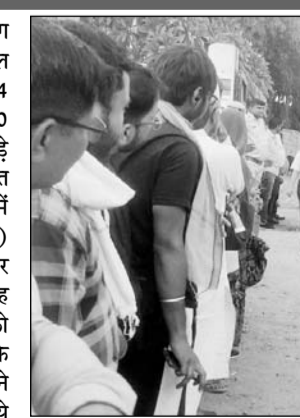
कोटा में नेशनल टेस्टिंग एजेंसी द्वारा सबसे बड़ी मेडिकल प्रवेश परीक्षा 'नीट' आयोजित हुई।