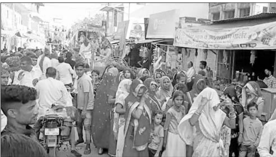
शोभायात्रा के दौरान सजी सजीव झांकी व शामिल महिलाएं।