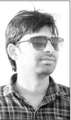
आरोपी कोचिंग संचालक।

जानकारी के अनुसार कोटा शहर के आईटी पार्क के पास पुलिस ने 30 अप्रैल को छह युवकों को शांतिभंग के आरोप में पकड़ा था। युवकों के मोबाइल की जांच में कई स्टूडेंट के परिमिशन कार्ड मिले थे। सखी से पूछताछ करने पर उन्होंने सीजीपीडी एजाम के फर्जीवाड़े का खुलासा हुआ। मास्टरमाइंड कोचिंग संचालक ने पेपर सॉल्व, कंप्यूटर को रिमोट एक्सेस पर लेने और अभ्यर्थियों के कंप्यूटर हैक करने के लिए अलग-अलग टीम लगा रखी थी। कोटा के विज्ञान नगर थाना