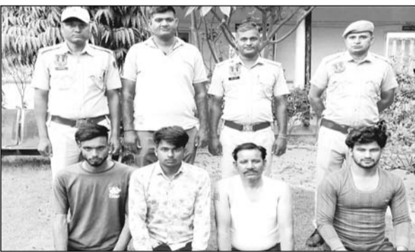
मानसरोवर थाना पुलिस ने महिला की हत्या के लिए सुपारी देने वाले सहित चार बरामदाओं को गिरफ्तार किया।

जयपुर। शहर में पहली बार एक ऐसा मामला सामने आया है जिसमें वाहन से टक्कर मार कर महिला को जान से मारने के लिए सुपारी ली गई है। पुलिस ने इस मामले में सुपारी देने वाले मुख्य सरगना सहित चार लोगों को गिरफ्तार किया है। पुलिस ने सुपारी देने वाले आरोपी को भी दस्तयाब कर लिया है। सुपारी देने वाले और परिवारिया के बीच आपस में पूर्व से विवाद चल रहा था।