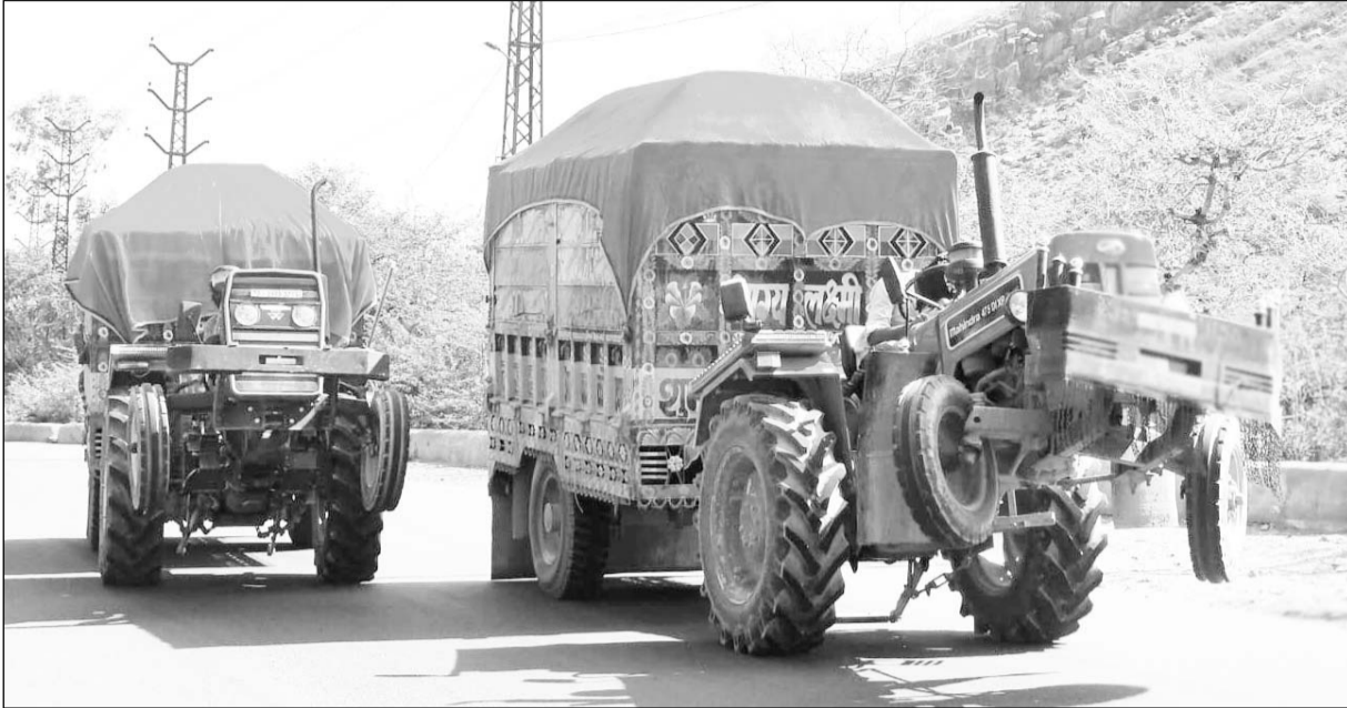
लालसोट थाना क्षेत्र के घाटे की चढ़ाई में ओवरलोड बजरी के ट्रैक्टर-ट्रॉली के आगे के टायर अधरझूल चलते दिखाई देते हैं।

हाल ही में चार दिन पहले घाटे की चढ़ाई के दौरान एक अवैध ओवरलोड ट्रैक्टर-ट्रॉली के चालक