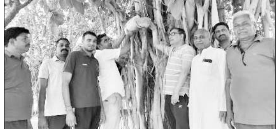
करोली में पक्षियों के लिए परिंडे बांधते भारत विकास परिषद के पदाधिकारी।

करोली, (नि.स.)। भारत विकास परिषद शाखा करोली के पर्यावरण प्रकल्प के अंतर्गत ग्रीष्म काल में पक्षियों के लिए परिंडा अभियान शनिवार से प्रारम्भ किया गया।