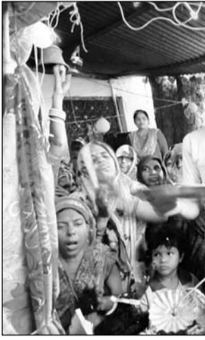
सुरौठ में भागवत कथा का आयोजन किया गया।