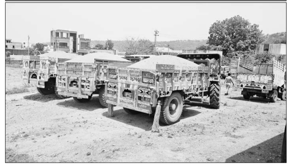
मांडलगढ़ पुलिस ने बनावस नदी से अवैध बजरी खनन कर परिवहन करते तीन ट्रैक्टर ट्रॉली जब्त किए।

पुलिस ने ओवरलोड अवैध बजरी ले जा रहे तीन ट्रैक्टर-ट्रॉली जब्त किये