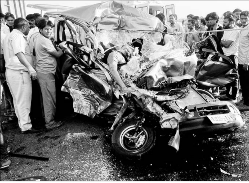
सड़क दुर्घटना में कार पूरी तरह से क्षतिग्रस्त हो गई।