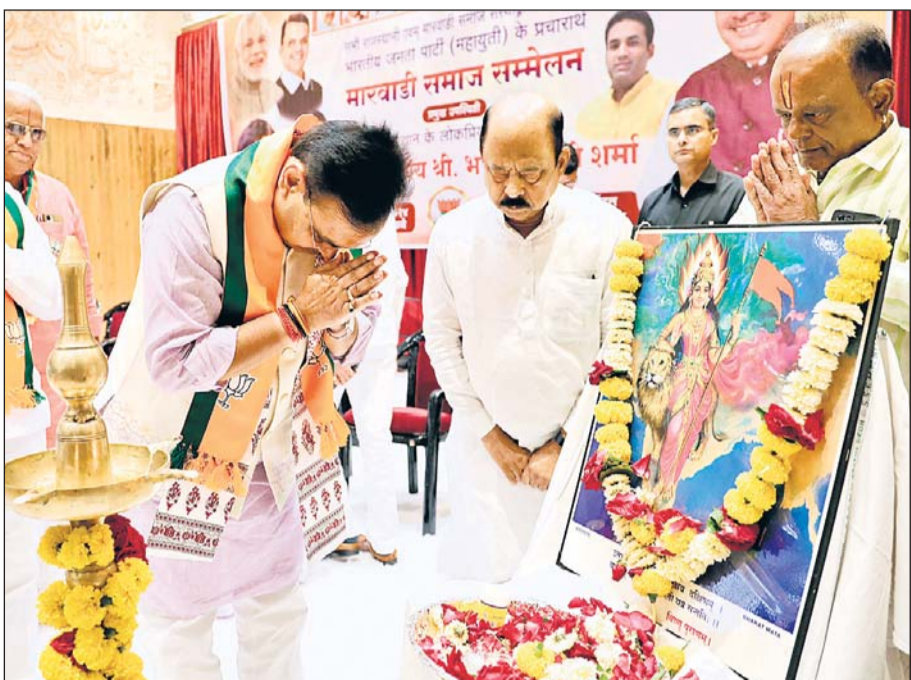
मुख्यमंत्री भजनलाल शर्मा ने महाराष्ट्र के सोलापुर में चुनाव प्रचार के दौरान राजस्थानी समाज के सम्मेलन में भाग लिया और प्रवासी राजस्थानियों से भाजपा को जिताने की अपील की।

आतंकी समर्थकों के मंसूबे से महाराष्ट्र को बचाना जरूरी-भजनलाल शर्मा