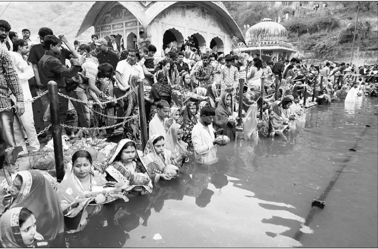
छठ सूर्य उपासना महापर्व के तीसरे दिन गुरुवार को 36 घंटे का व्रत रखे हुए श्रद्धालुओं ने शाम को सूर्यास्त के समय कमर तक पानी में खड़े होकर सूर्य भगवान को अर्घ्य दिया।

जयपुर। उत्तर भारतीयों के चार दिवसीय छठ सूर्य उपासना महापर्व के तीसरे दिन गुरुवार को 36 घंटे का व्रत रखे हुए श्रद्धालुओं ने शाम को सूर्यास्त के समय कमर तक पानी में खड़ी होकर सूर्य भगवान को अर्घ्य दिया। गलताजी, आमेर के सागर, मावठे में शाम होने से पहले ही बड़ी संख्या में व्रती बांस की टोकरी में मौसमी फल, ठेकुआ, कसर, गन्ना और पूजा का सामान लेकर पहुंच गए। सूर्य के अस्तातक की ओर बढ़ते ही सभी श्रद्धालु कमर तक पानी में खड़े होकर लोक गीत गाते हुए सूर्य भगवान को अर्घ्य दिया।