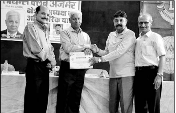
लायन्स क्लब के शिक्षकों एवं बाहर से आमंत्रित शिक्षकों को सम्मानित किया गया।

उन्होंने क्लब के कार्यों की प्रशंसा करते हुए डाॅब्लिटीज चाइल्ड केंसर तथा क्वेस्ट कार्यक्रम पर कार्य करने