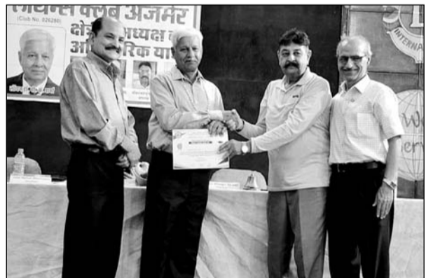
लायन्स क्लब के शिक्षकों एवं बाहर से आमंत्रित शिक्षकों को सम्मानित किया गया।

उन्होंने क्लब के कार्यों की प्रशंसा करते हुए डाटाबेसिड चैटइड कैंसर तथा क्वेस्ट कार्यक्रम पर कार्य करने