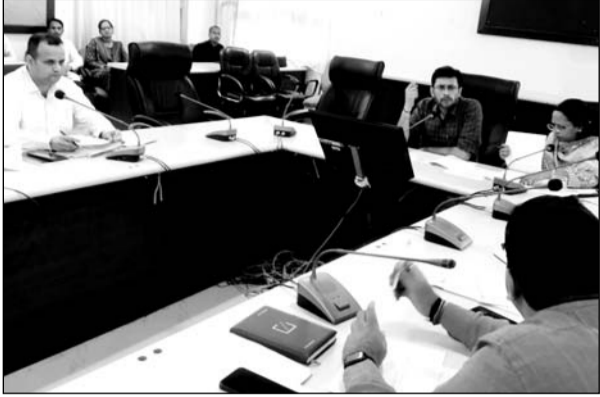
जिला कलक्टर ने अधिकारियों की विभागीय कार्यों की प्रगति समीक्षा बैठक कलेक्टर सभागार में आयोजित हुई।

बैठक में उन्होंने रोजगार उत्सव, राइजिंग राजस्थान, बजट घोषणाओं की क्रियान्विति प्रगति, शहर की सफाई, निराश्रित पशुओं के समाधान, बिजली, पेयजल, मौसमी बीमारियों की रोकथाम, संपर्क पोर्टल व विभागीय योजनाओं की समीक्षा करते हुए संबंधित विभागीय अधिकारियों को आवश्यक दिशा निर्देश दिए। उन्होंने जिले में 17 सितंबर को आयोजित होने वाले रोजगार उत्सव की तैयारियों को लेकर सीएमएचओ और रोजगार विभाग के उपनिदेशक को निर्देशित किया। साथ ही जिले में विभिन्न विभागों