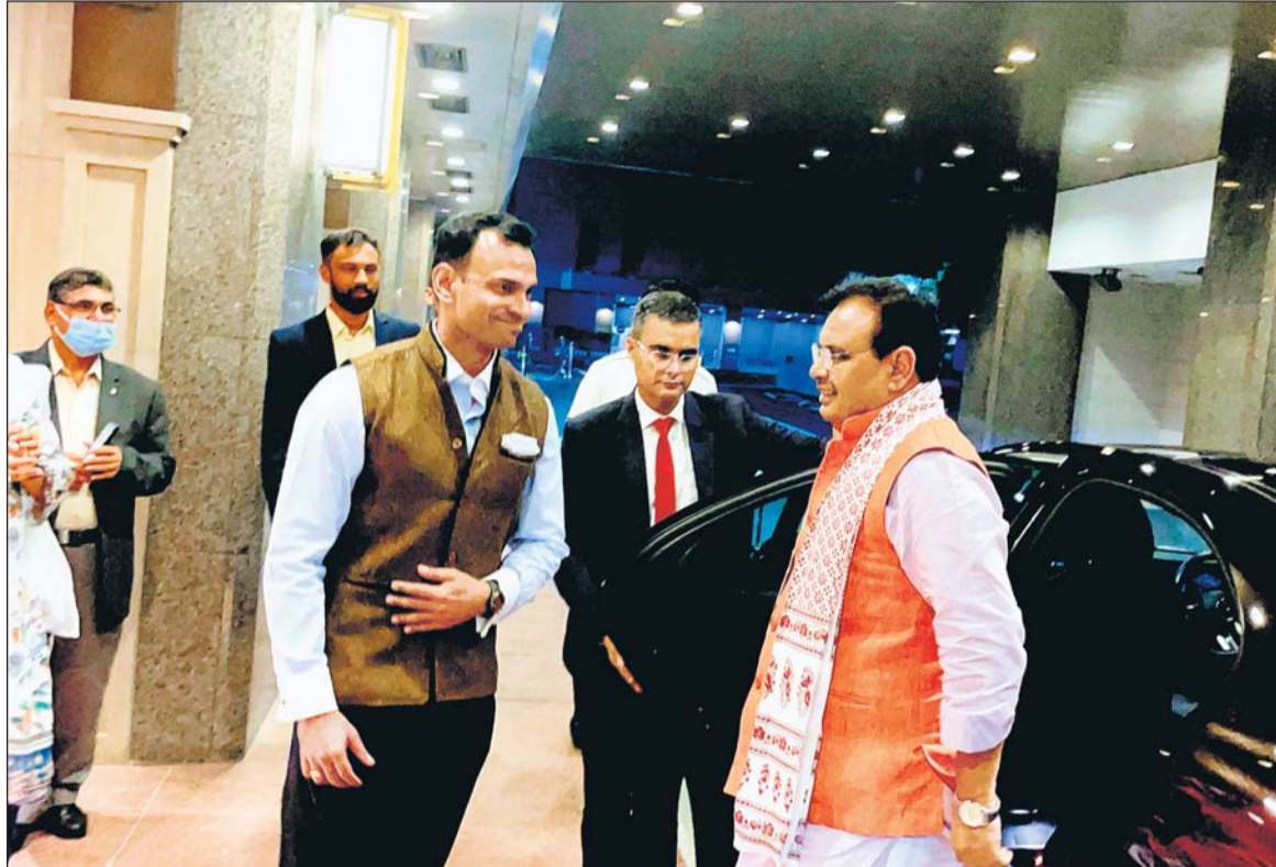
मुख्यमंत्री भजनलाल शर्मा के नेतृत्व में प्रदेश सरकार का प्रतिनिधिमंडल मंगलवार को सियोल (कोरिया) पहुंचा। सियोल में कोरियन स्टोन एसोसिएशन के प्रतिनिधियों ने मुख्यमंत्री का स्वागत किया। मुख्यमंत्री की कोरियन स्टोन एसोसिएशन के व्यापारियों एवं प्रतिनिधियों के साथ राजुड टैबल वार्ता हुई।