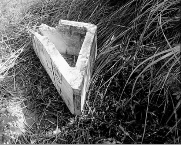
एक किमी के दायरे में दो जगह पर सीमेंट के ब्लॉक रखकर ट्रेन को बेपटरी करने की साजिश नाकाम हुई।

मामला फुलेरा से अहमदाबाद मार्ग पर रविवार रात का है। उजागर सोमवार रात्रि में हुआ। यह मालगाड़ी फुलेरा से अहमदाबाद जा रही थी। इस मामले में मांगलियावास थाना पुलिस में रिपोर्ट दर्ज कर ली गई है। सिविल पुलिस और रेलवे सुरक्षा बल मिलकर मामले में अनुसंधान कर रहे हैं। जानकारी के अनुसार इससे पहले 28 अगस्त को वारां के छबड़ा में मालगाड़ी के ट्रैक पर बाइक का स्क्रैप फेंका गया। इस घटना में इंजन बाइक के कबाड़ से टकरा गया। वहीं 23 अगस्त को पाली में अहमदाबाद-जोधपुर बंदे भारत ट्रेक पर रखे सीमेंट ब्लॉक से टकरा