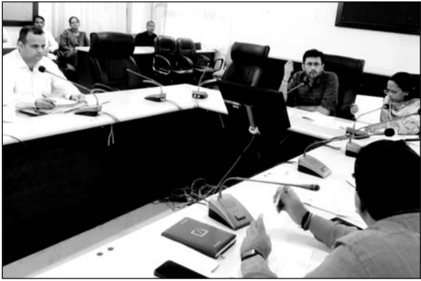
जिला कलक्टर ने अधिकारियों की विभागीय कार्यों की प्रगति समीक्षा बैठक कलेक्ट्रेट सभागार में आयोजित हुई।

बैठक में उन्होंने रोजगार उत्सव, राइजिंग राजस्थान, बजट घोषणाओं की क्रियान्विती प्रगति, शहर की साफ सफाई, निराश्रित पशुओं के समाधान, बिजली, पेयजल, मौसमी बीमारियों की रोकथाम, संपर्क पोर्टल व विभागीय योजनाओं की समीक्षा करते हुए संबंधित विभागीय अधिकारियों को आवश्यक दिशा निर्देश दिए। उन्होंने जिले में 17 सितंबर को आयोजित होने वाले रोजगार उत्सव की तैयारियों को लेकर सीएमएचओ और रोजगार विभाग के उपनिदेशक को निर्देशित किया। साथ ही जिले में विभिन्न विभागों