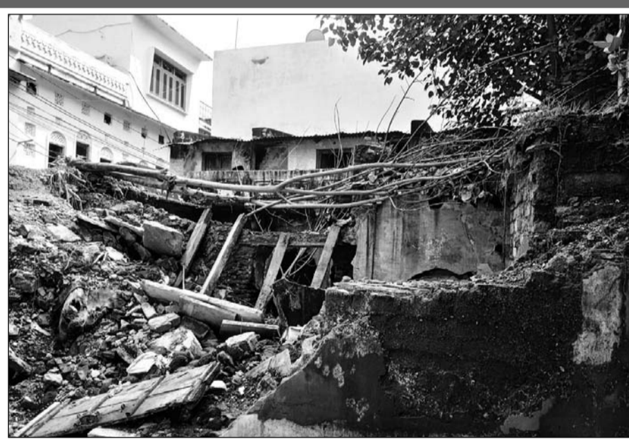
देवली शहर के बीचों-बीच जर्जर अवस्था में खड़े भवन हादसे को न्योता दे रहे हैं।