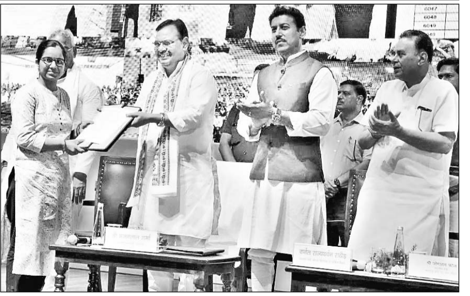
प्रदेश में पहली बार "मुख्यमंत्री रोजगार महोत्सव" आयोजित हुआ। राज्य स्तरीय समारोह का आयोजन मानसरोवर स्थित टैगोर इंटरनेशनल स्कूल के ऑडिटोरियम में हुआ। कार्यक्रम में मुख्यमंत्री भजनलाल शर्मा ने अपने हाथों से राजकीय सेवाओं में नवनि्युक्त कार्मिकों को नियुक्ति पत्र बाँटे।

रोजगार उत्सव" आयोजित किए जाएंगे। राज्य सरकार युवाओं को रोजगार देने के संकल्प पत्र के वादे को पूरा करने के लिए पारदर्शी एवं समयबद्ध भर्ती परीक्षाओं का आयोजन सुनिश्चित कर रही है। शर्मा ने कहा कि, प्रदेश में रोजगार (शेष अंतिम पृष्ठ पर)