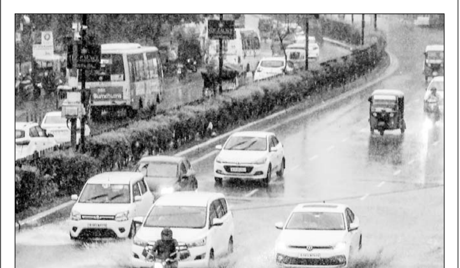
मानसून की आवक के साथ ही शनिवार को सुबह से ही जयपुर में काले-काले बादलों की आवाजाही लगी रही। शाम होते-होते तेज बारिश के कारण सड़कों पर पानी ही पानी भर गया।