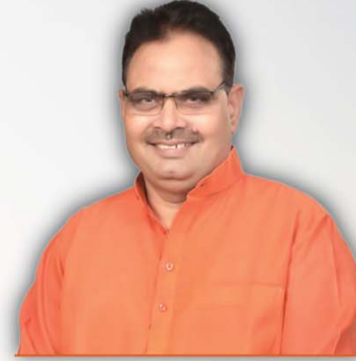
श्री भजनलाल शर्मा, मुख्यमंत्री

समृद्ध किसान - खुशहाल राजस्थान राजस्थान सरकार की ऐतिहासिक पहल 65 लाख से अधिक किसानों को ₹650 करोड़