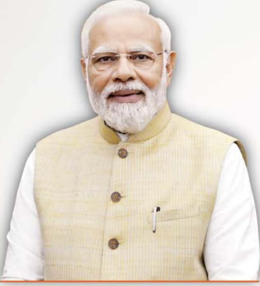
श्री नरेंद्र मोदी, प्रधानमंत्री