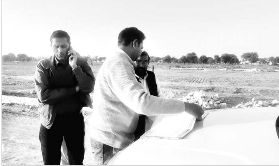
मुहाना गृह निर्माण सहकारी समिति के समापक और जयपुर विकास प्राधिकरण की प्रवर्तन शाखा ने गुरुवार को मुहाना स्थित सचिवालय नगर योजना में अवैध निर्माण व अतिक्रमण को रुकवाया।

जयपुर। मुहाना गृह निर्माण सहकारी समिति के समापक और जयपुर विकास प्राधिकरण की प्रवर्तन शाखा ने गुरुवार को मौके पर पहुंचकर मुहाना स्थित सचिवालय नगर योजना में अवैध निर्माण व अतिक्रमण को रुकवाया। यह अवैध निर्माण जेडीए के अनुमोदित नक्शे के विपरीत 132 के.वी. की हाईटेशन लाइन के पास सेक्टर रोड पर हो रहा था।