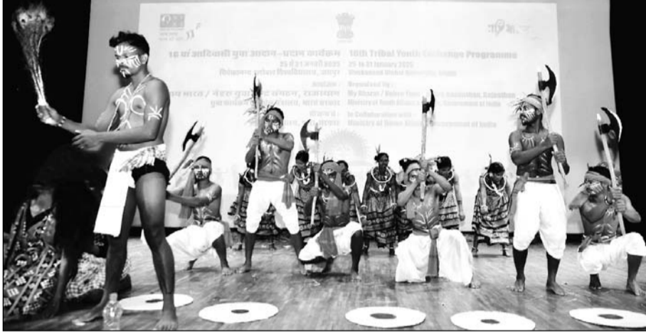
आरएएफ कैंप, लालवास में आयोजित सांस्कृतिक संध्या में विभिन्न राज्यों के आदिवासी कलाकारों ने अपनी पारंपरिक प्रस्तुतियों से दर्शकों को मंत्रमुग्ध कर दिया

जयपुर। आरएएफ कैंप, लालवास में आयोजित सांस्कृतिक संध्या में विभिन्न राज्यों के आदिवासी कलाकारों ने अपनी पारंपरिक प्रस्तुतियों से दर्शकों को मंत्रमुग्ध कर दिया। कार्यक्रम भारत सरकार के नेहरू युवा संगठन द्वारा गृह मंत्रालय के सौजन्य से आदिवासी युवा आदान-प्रदान कार्यक्रम के तहत आयोजित किया गया। झारखंड, ओडिशा और छत्तीसगढ़ के लोक कलाकारों ने अपने-अपने क्षेत्रीय नृत्य प्रस्तुत किए, जिनमें कृषि, प्रकृति, पारंपरिक आस्था और सामाजिक संदेश झलकते दिखे।