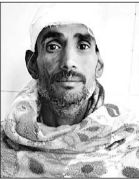
हमले में घायल युवक।