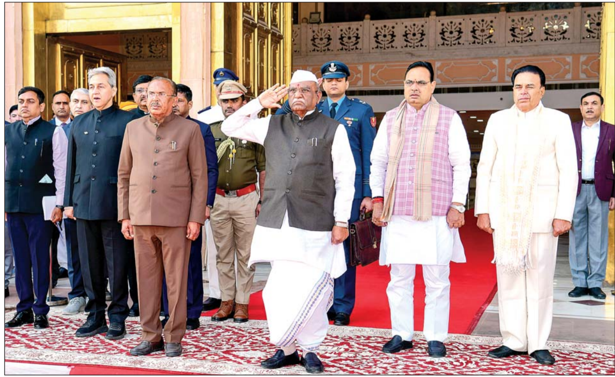
राज्यपाल हरिभाऊ बागड़े ने 16वीं विधानसभा के तीसरे सत्र के प्रथम दिन करीब 1 घंटे 26 मिनट अभिभाषण पढ़ा। उन्होंने पिछली कांग्रेस सरकार को पेपरलीक, जल जीवन मिशन घोटाले, थर्मल प्लांट्स में कोयले की कमी, राजस्थान में बिजली संकट सहित कई मुद्दों पर घेरा।

वसुंधरा राजे के नेतृत्व वाली सरकार ने शुरू किया था। दुर्भाग्य से, विगत सरकार के समय राजनीतिक लाभ के कारण इस परियोजना को अटक़ाया जाता रहा। हमारी सरकार ने इसे राम जल सेतु परियोजना का नाम दिया। मध्य प्रदेश के साथ इस परियोजना को लेकर एमओयू (शेष अंतिम पृष्ठ पर)