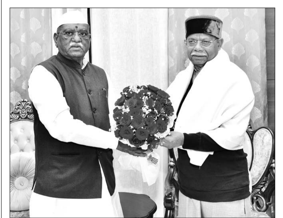
राज्यपाल हरिभाऊ बागडे से शुकुवार को राजभवन में हिमाचल प्रदेश के राज्यपाल शिवप्रताप शुक्ल ने मुलाकात की। राज्यपाल से उनकी यह शिष्टाचार भेंट थी। इस दौरान उन्होंने विभिन्न विषयों पर चर्चा की। वहीं दूसरी ओर राज्यपाल बागडे से नावें की राजदूत मै.एलिन स्टेनर ने राजभवन में मुलाकात की। इस दौरान राज्यपाल ने उनसे दुग्ध उत्पादन और पशुधन संयत्ता के बारे में जानकारी प्राप्त की। दोनों ने प्रदेश में विभिन्न क्षेत्रों में विकास योजनाओं के समन्वय और निवेश संभावनाओं के संबंध में चर्चा की। राज्यपाल के सचिव डॉ. पृथ्वीराज भी इस दौरान मौजूद रहे। राज्यपाल से उनकी यह शिष्टाचार भेंट थी।

हैं। उन्होंने कहा कि वहां कंपनी गार्डन की जगह रोजाना ढाई किलोमीटर परिया से 7 करोड़ की बजरी निकाल रही है लेकिन सरकार को बताए जाने के बाद भी कोई कार्रवाई नहीं हुई है। हमारी आंखों के सामने ऐसा हो रहा है। किरोड़ी लाल गुरुवार को विधानसभा के बजट सत्र के पहले दिन राज्यपाल का अभिभाषण सुनने आते थे। अब वह 3 फरवरी से विधानसभा की शेष बैठकों से अवकाश पर रहेंगे। इसकी अर्जी उन्होंने एक सप्ताह पहले विधानसभा अध्यक्ष को दे दी थी। जानकारी के अनुसार 3 फरवरी को विधानसभा अध्यक्ष उनके अवकाश की अनुमति का प्रस्ताव सदन में रखेंगे।