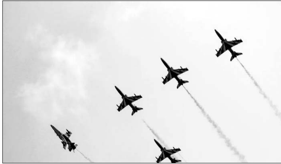
जोधपुर एयरफोर्स स्टेशन पर भारतीय वायु सेना के सबसे बड़े अभ्यास तरंग-शक्ति (फेज-2) में आसमान में भारतीय लड़ाकू विमानों ने विभिन्न प्रकार के करतब दिखाये।

जोधपुर, (कासं)। भारतीय वायु सेना का सबसे बड़ा अभ्यास तरंग-शक्ति (फेज-2) जोधपुर एयरफोर्स स्टेशन पर चल रहा है। शनिवार को ओपन-डे शो हुआ। आसमान में भारतीय लड़ाकू विमान सुखोई-30, तेजस और हेलिकॉप्टर ने प्रचंड ने करतब दिखाए। सूर्यकिरण के 9 हॉक्स विमान ने आसमान में तिरंगा बनाया और