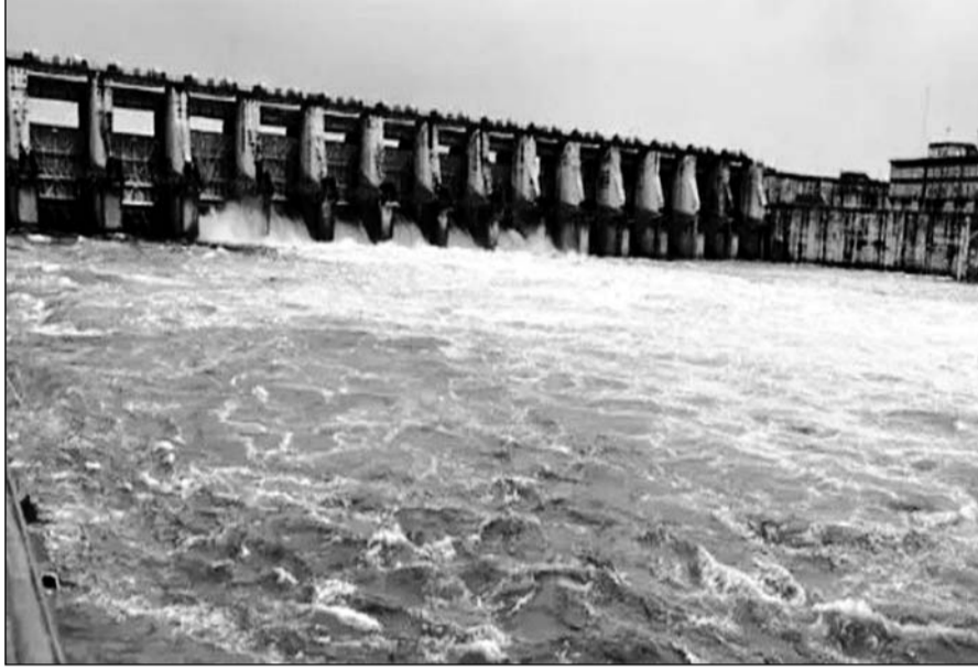
बीसलपुर बांध में पानी की आवक जारी रहने से शनिवार सुबह छह गेट खोले।

बीसलपुर बांध के 6 गेट 2-2 मीटर तक खोलकर 72120 क्यूसेक पानी बनास नदी में छोड़ा गया, लेकिन रात्रि 8:30 बजे बांध में पानी की आवक की गति धीमी हो जाने के कारण चार गेटों की ऊंचाई को घटाकर एक-एक मीटर कर दिया है। जिससे कि रात्रि 8:30 बजे 45255 क्यूसेक पानी छोड़ना शुरू कर दिया है। बीसलपुर परियोजना निर्माण खंड