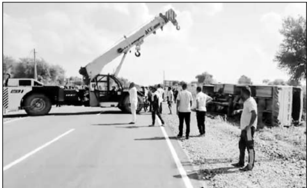
पलटी हुई राजस्थान रोडवेज बस को क्रेन की सहायता से हटवाया।

■ गनीमन रही कि बस 11 हजार केटी के पोल से टकराती हुई बच गई