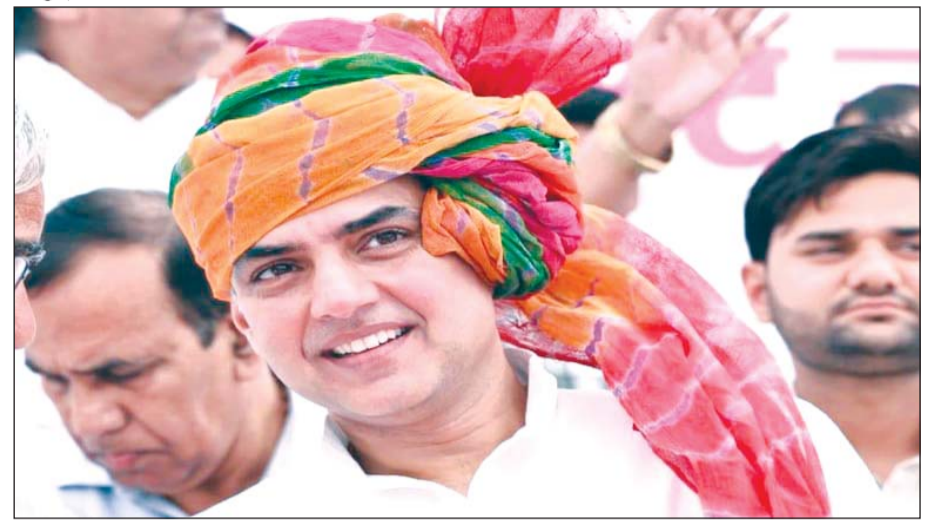
समर्थकों ने कांग्रेस के राष्ट्रीय महासचिव सचिन पायलट का 47वां जन्मदिन गौसेवा दिवस के रूप में मनाया। इस मौके पर कांग्रेस के सभी जिला एवं तहसील मुख्यालयों से गोशालाओं को हजारों किंवदंत चारा वितरित किया गया।