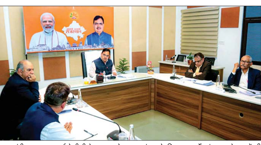
मुख्यमंत्री भजनलाल शर्मा ने वीसी के माध्यम से जयपुर संभाग के विकास कार्यों एवं बजट घोषणाओं की प्रगति की समीक्षा की। उन्होंने संभाग के सभी जिला कलक्टरों को आगामी तीन दिन में पिछले बजट वर्ष, 2024-25, की घोषणाओं के लम्बित प्रकरणों की रिपोर्ट भेजने के निर्देश दिए।

मुख्यमंत्री ने झुंझुनू जिले के विकास कार्यों की समीक्षा करते हुए कहा कि लोहारगल सहित अन्य पर्यटन स्थलों के विकास के लिए विस्तृत कार्य योजना तैयार की जाए। उन्होंने सीकर जिले की समीक्षा करते हुए