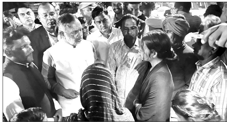
ऊर्जा मंत्री हीरालाल नागर ने गढ़पान के लोगों से मुलाकात की।

वहीं ऊर्जा मंत्री हीरालाल नागर रविवार को गढ़पान में बेहोश हुए स्कूली बच्चों से मिले। उन्होंने परिवार से मिलकर स्वास्थ्य की जानकारी ली। इसके बाद नागर ने ग्रामीणों से भी चर्चा की। वहीं सीएफसीएल पहुंचकर फैक्ट्री प्रबंधन से भी बात की है। सीएमएचओ को बुलाकर भी पीड़ित बच्चों को हर संभव मेडिकल ट्रीटमेंट देने के निर्देश दिए। इस दौरान ऊर्जा मंत्री ने मीडिया से बात करते हुए कहा कि यह कोई प्राकृतिक आपदा नहीं है, किसी न किसी स्तर पर लापरवाही हुई है। प्रथमदृष्टया गैस लीकज की ही संभावना है। लापरवाही जिस भी स्तर पर हुई है, दोषियों को बख्शा नहीं जाएगा। घटना को लेकर जिला कलेक्टर ने जांच कमेटी बनाई है। हमें जांच रिपोर्ट का इंतजार करना चाहिए। यदि इसके बाद में जरूर हुई तो उच्च स्तरीय कमेटी बनाकर जांच