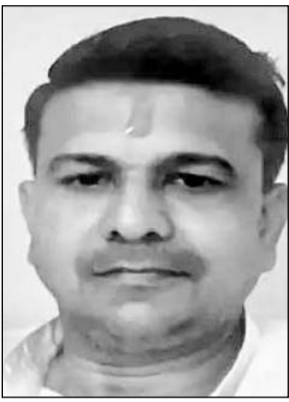
व्यापारी का फाइल फोटो