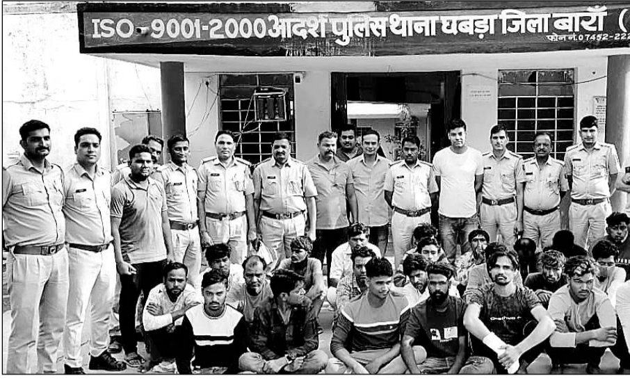
पुलिस ने विभिन्न मामलों में दो दर्जन आरोपियों को गिरफ्तार कर लिया।