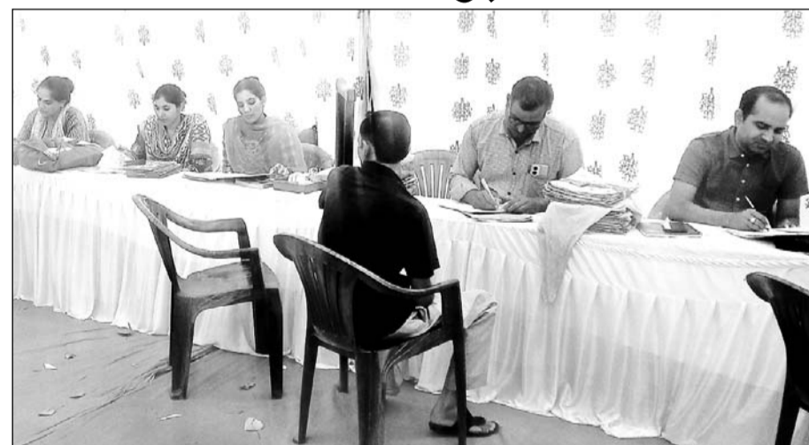
महंगाई राहत कैम्प में कर्मचारी अधिकांश समय खाली बैठे दिखाई पड़े।

कुछ लोगों का कहना है कि सरकार की ओर से इन शिविरों का लगाए जाने का कोई औचित्य नहीं है क्योंकि सरकार के पास व समस्त आंकड़े मौजूद पहले से ही हैं जो सरकार शिविर में पंजीयन के जरिए इकट्ठा करना चाहती है। कुछ जन प्रतिनिधियों ने यह भी बताया कि 2 माह तक लगातार शिविर आयोजित होने की वजह से नगरपालिका के कई महत्वपूर्ण कार्य एक प्रकार से टप हो जाएँ जो विकास में प्रमुख रूप से भूमिका निभाते हैं।