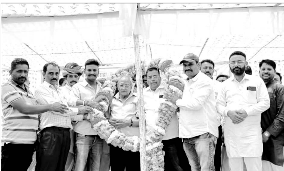
बरूधन चौगहे से लक्ष्मीपुरा डाबी लांबा खो से राणा जी का गुडा तक की 50 किलोमीटर सड़क के निर्माण कार्य शुभारंभ किया।

उन्होंने कहा कि कुछ लोग क्षेत्र की जनता को केवल मात्र राजनीतिक लाभ लेने के लिए गुमराह कर रहे हैं। कार्यक्रम में प्रदेश कांग्रेस कमेटी सदस्य सत्येश शर्मा ने कहा कि प्रदेश के मुख्यमंत्री अशोक महलोत ने विधानसभा क्षेत्र से कांग्रेस पार्टी का जनप्रतिनिधि नहीं होने के बाद भी हजारों करोड़ रुपये की सौगात दी है, जिसके लिए सभी बूंदी वासियों की ओर से हम उनका आभार प्रकट करते हैं। राज्य सरकार जनता के कल्याण के लिए पूरी तरह से समर्पित होकर काम कर रही है। उन्होंने सभी कांग्रेस पार्टी के