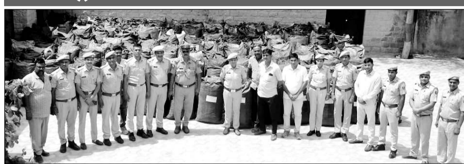
पुलिस ने पौने दो करोड़ का डोडा-पोस्त सहित दो जनों को गिरफ्तार किया।

दो ट्रकों में लादा गया था छह टन डोडा-पोस्त