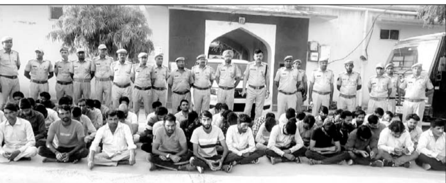
भाबरु थाना पुलिस ने असामाजिक तत्वों के विरुद्ध कार्रवाई की।

पावटा, (निसं)। प्रदेश में तेजी से बढ़ रही आपराधिक घटनाओं, वारदातों को रोकने के लिए राज्य सरकार व पुलिस द्वारा विशेष प्रयास किये जा रहे हैं। हाउडकोर, हिस्ट्रीशीटर, बांछित अपराधियों व अपराधियों व असामाजिक तत्वों के महिम मंडन के लिए सोशियल मीडिया पर अपराधियों को फॉलो करने वाले एवं उनकी पोस्टों को शेयर व लाइक करने के साथ-साथ अवैध हथियारों व बदमाशों के साथ पोस्ट डालने वाले असामाजिक तत्वों के विरुद्ध भाबरु थाना पुलिस द्वारा राजधानी जयपुर की भांति विशेष अभियान चलाकर निरन्तर कार्यवाही की जा रही है। अपराधियों को सोशल मीडिया पर लाइक फॉलो व शेयर करने वाले