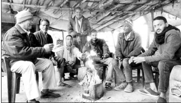
अजमेर में शीतलहर के कारण लोग अलाव तापते नजर आये।

अजमेर, (कास)। पश्चिम विश्वो भी और पहाड़ों पर हुई बर्फबारी व प्रदेश के जिलों में हुई पहली मबावत की बारिश के चलते मौसम ने करवट बदली है। मबावत और ठंडी हवाओं के चलते घने कोहरे व तापमान में गिरावट के चलते शीतलहर ने लोगों को धुंजणी छुड़ा दी है।