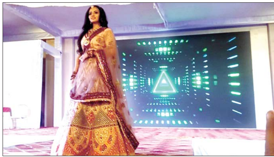
कोटा महोत्सव में कुदुर इंस्टीट्यूट ऑफ फैशन टेक्नोलॉजी की ओर से कोटा डोरिया फैशन शो का आयोजन किया गया।

इन अतिथियों परिधानों को संस्थान के मॉडलों ने रैंप पर प्रस्तुत कर दर्शकों का दिल जीत लिया। कार्यक्रम में किड्स शो और कोटा क्वीन प्रतियोगिता भी आयोजित की गई जिसमें बच्चों से लेकर हर उम्र की महिलाओं ने अपनी प्रतिभा का प्रदर्शन किया। किड्स शो में बच्चों की मासूमियत और रचनात्मकता