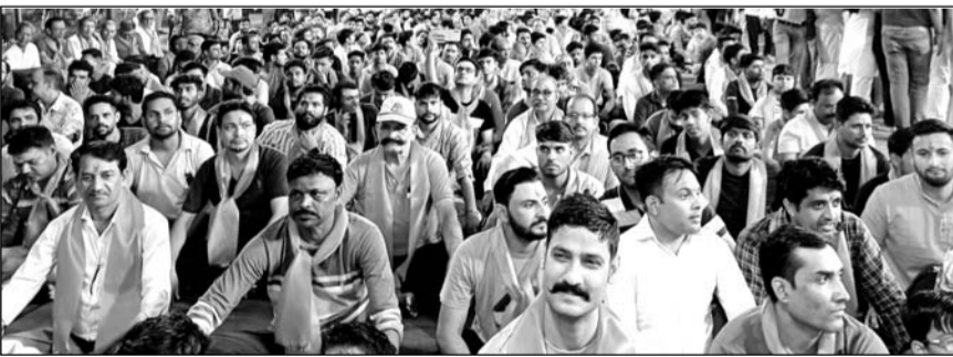
मुरलीपुरा के विकास नगर में मंगलवार शाम को सामूहिक हनुमान चालीसा पाठ में हजारों की तादाद में श्रद्धालु उमड़े।

जयपुर। सनातन धर्मावलंबियों को एकजुट करने का माध्यम बने हनुमान चालीसा के सामूहिक पाठ के आयोजनों की श्रृंखला में मंगलवार शाम को मुरलीपुरा के विकासनगर स्थित गौरब बाल विद्या मंदिर के पास सामूहिक हनुमान चालीसा पाठ किया गया। बड़ी संख्या में लोगों ने राम दरबार के समक्ष हनुमान चालीसा की चौपाइयां पढ़ी तो वातावरण में जोश और उमंग की हिलोली पैदा हो गई। प्रारंभ में राम दरबार का भक्तिभाव से पूजन किया गया। इसके बाद राम नाम का कीर्तन किया गया। इस बीच जय श्री राम के जयकारे लगते रहे। राम नाम कीर्तन के साथ भजनों की प्रस्तुतियां भी हुईं। इसके बाद संतों-महंतों के साहित्य में हनुमान चालीसा