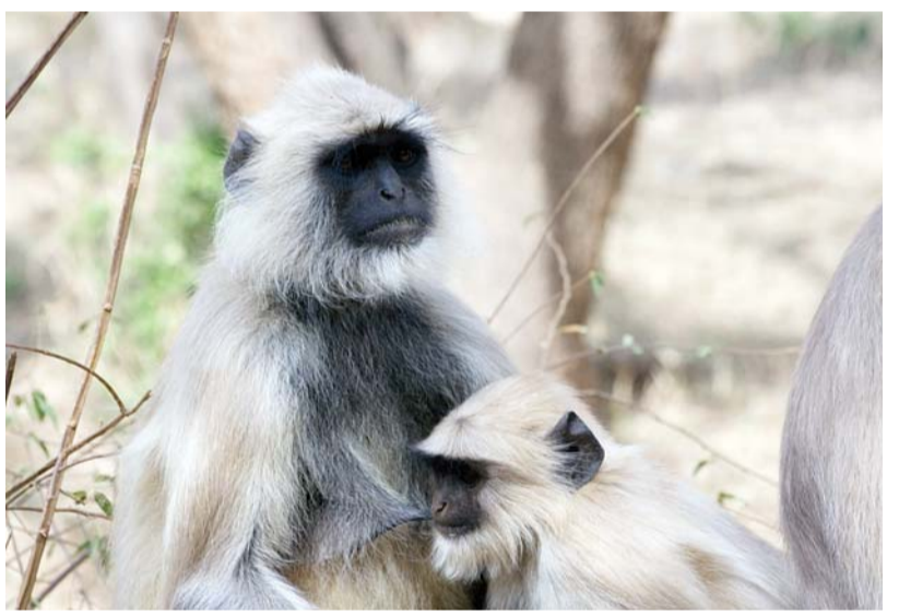
Langoor sentinel on job.