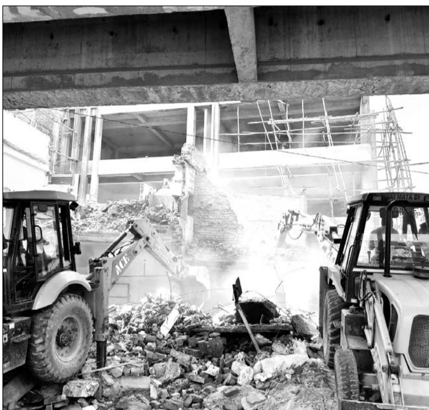
विधानसभा चुनावों से पहले झोटवाड़ा एलिवेटेड रोड का निर्माण कार्य पूरा करने के लिए जयपुर विकास प्राधिकरण के अधिकारी इन दिनों पुरजोर जुटे हुए हैं। मंगलवार को इस पुलिया के निर्माण में बाधा बन रही 8 दुकान, पांच मकान, सीढ़ियां व अन्य स्ट्रक्चर को जेसीबी से ध्वस्त किया।