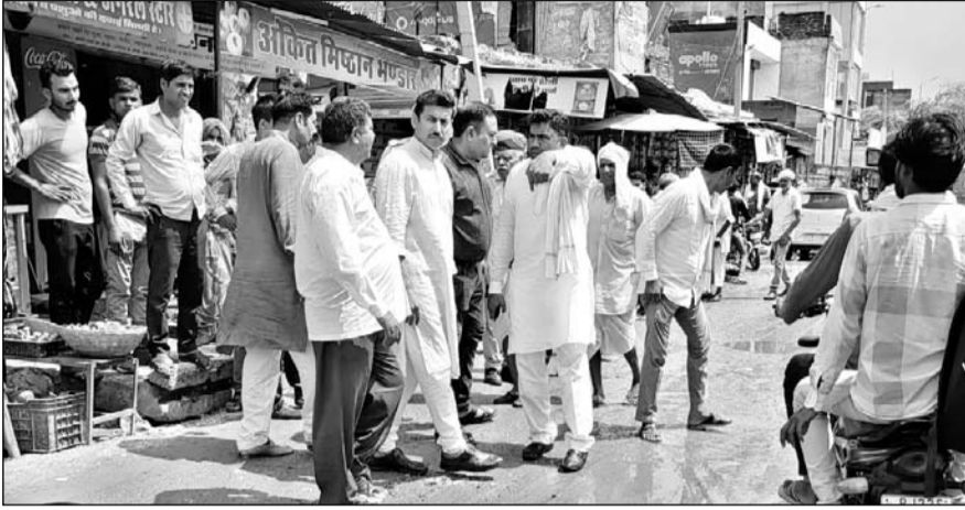
जयपुर ग्रामीण सांसद कर्नल राज्यवर्धन राठौड़ ने पावटा प्रागपुरा नगरपालिका में जायजा लिया।

वहीं व्यापारियों, किसानों, जनप्रतिनिधियों व आमजन ने मुख्य स्टैंड पर पब्लिक अंडरपास के स्थान