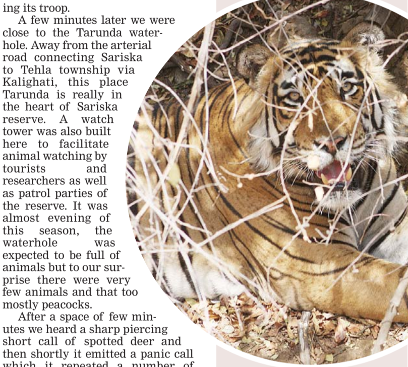
Tiger enjoying Siesta During summer.

At Brahmath we saw a myriad wild creatures on the water hole. Here we saw a herd of more than 100 sambar, unbelievable. But no carnivore seemed nearby and so no alarm calls except few typical shrill calls from a lone chital from the further north of the valley. Discarding it Saini said it did not denote presence of any large carnivore.