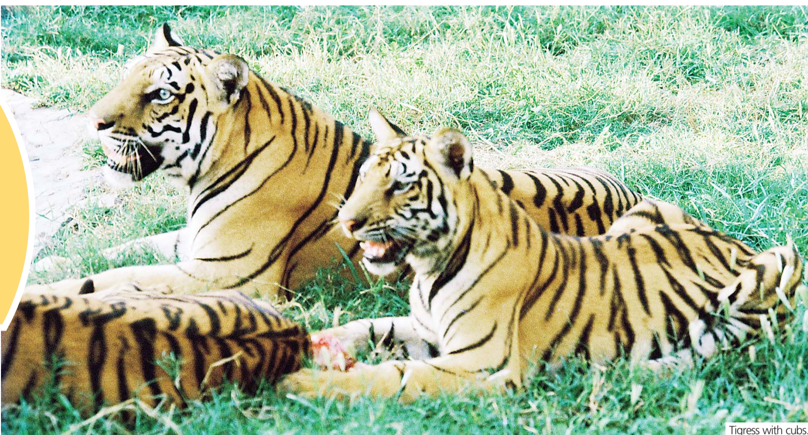
Tigress with cubs.

It was a huge tigress and her four cubs, all with their faces smeared in blood. It was a unique & unforgettable sighting of the majestic animals lapping up blood and muscles on Kill