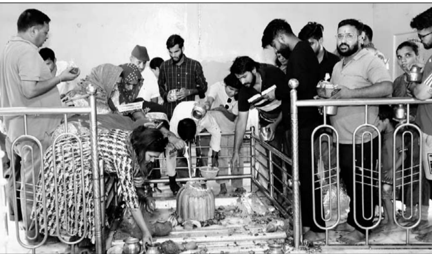
सावन माह शुरू होने के बाद मंगलवार को वैशाली नगर स्थित झारखंड महादेव मंदिर में भगवान भोलेनाथ के अभिषेक के लिए श्रद्धालुओं की कतारें लगीं।

-कार्यालय संवाददाता- जयपुर। आदिदेव महादेव भगवान भोलेनाथ की आराधना का प्रिय माह सावन मंगलवार को त्रिपुष्कर योग के साथ शुरू हो गया है। छोटीकाशी के शिवालय 'हर-हर-महादेव' के जयकारों से गूंजायमान हो उठे हैं। बाबा भोलेनाथ के जलाभिषेक एवं दर्शनों के लिए श्रद्धालुओं की कतारें सुबह से ही लग गईं। श्रद्धालुओं ने "ओम नमः शिवाय" मंत्र के साथ जल और दूध से भगवान आशुतोष का अभिषेक कर बिल्व पत्र अर्पित किए। शाम को शिव मंदिरों में आकर्षक झांकी सजाई गई। शिवालयों में भोले बाबा का अलग-अलग तरह से श्रृंगार किया गया।