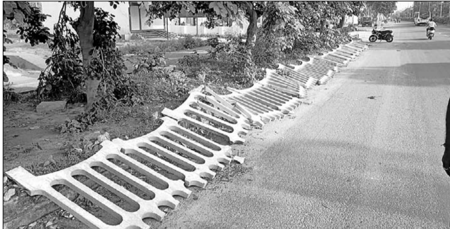
भीलवाड़ा में शहर के हाईवे मार्ग पर लगी सीमेंटेड जालियों को भी किन्हीं स्वार्थी तत्वों ने तोड़ दिया।

भीलवाड़ा, (निसं)। नगर विकास न्यास के आला अधिकारी जहां शहर की सुंदरता को बढ़ाने के लिए करोड़ों रुपए खर्च कर रहे हैं वहीं सुखाडिया सर्कल से अजमेर जाने वाले अति व्यस्त शहर के हाईवे मार्ग पर लगी सीमेंटेड जालियों के साथ लगी लोहे की मजबूत जालियों को भी किन्हीं स्वार्थी तत्वों ने तोड़ दिया। आश्चर्य का विषय तो यह है कि अजमेर चौराहे से लेकर भीलवाड़ा डेयरी तक रोजाना कई महत्वपूर्ण लोग इस रास्ते से गुजरते हैं मगर अभी तक किसी जिम्मेदार अधिकारियों का ध्यान इस ओर नहीं गया, जिसके कारण कुछ लोहे की जालियां तो लोग उड़ा कर भी ले गए।