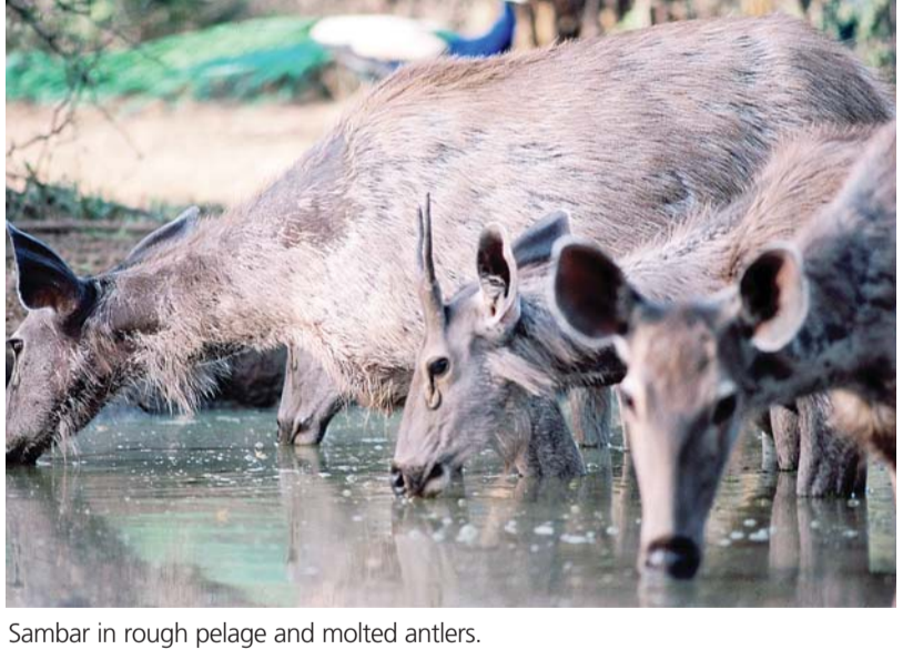
Sambar in rough pelage and molted antlers.