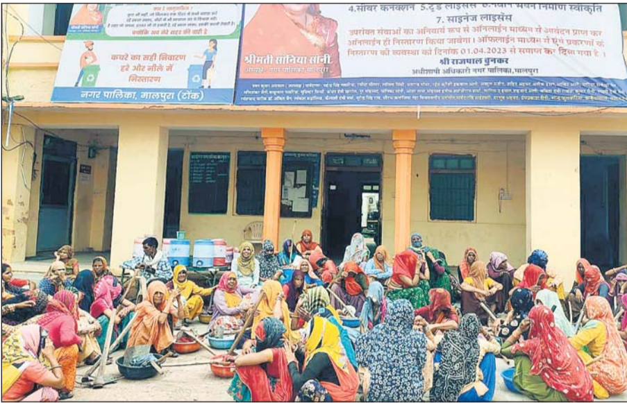
मनरेगा श्रमिकों ने समय परिवर्तन की मांग को लेकर पालिका परिसर में धरना दिया।