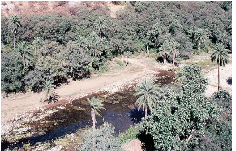
Silberri Nullah- lifeline for wildlife here.

Currently, the largest normal commercial aircraft are considered double-decker aircraft. However, they are actually designed with three decks. The top and middle deck are used to accommodate the passengers, and the bottom cargo deck to carry luggage and any other form of cargo. Good examples of this type of design are the Airbus A380 and the Boeing 747. Now, new aircraft could modify those cargo decks to accommodate as many passengers as possible.