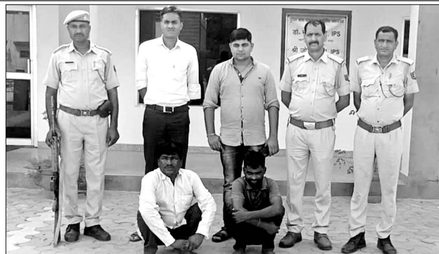
राजगढ़ थाना पुलिस ने शराब तस्करी मामले में दो जनों को गिरफ्तार किया।