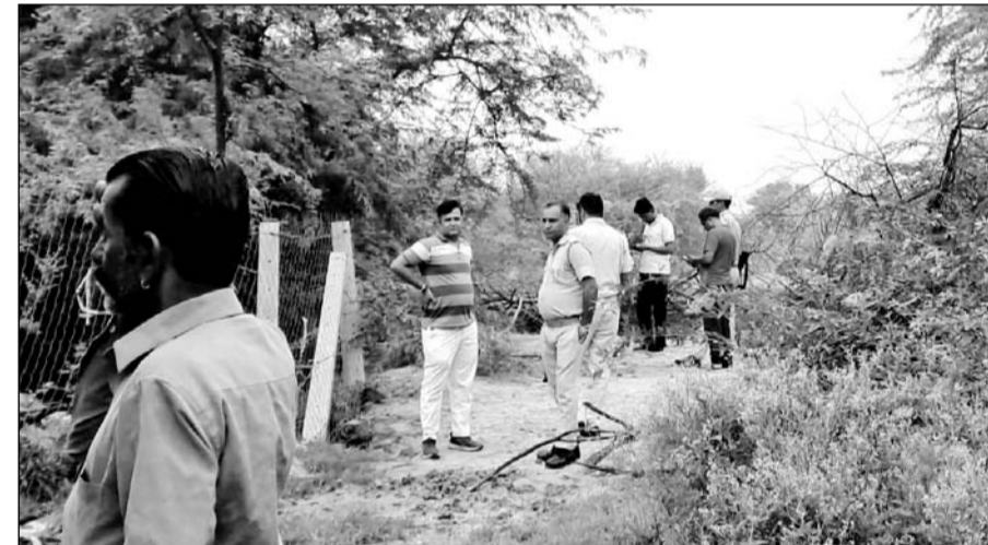
मालपुरा क्षेत्र में युवक का शव मिलने के बाद पुलिस ने जांच की।

मृतक युवक का ससुराल भी मालपुरा में ही बताया गया। परिजनों की ओर से किसी प्रकार का कोई अंदेशा नहीं जताने तथा कोई पुलिस प्रार्थमिकी नहीं देने पर मूग में मामला दर्ज कर घटना की जांच शुरू की गई। युवक का शव मिलने से क्षेत्र में सनसनी फैल गई देखते ही देखते घटना स्थल पर लोगों की भीड़ जमा हो गई। युवक द्वारा आत्महत्या किये के कारणों का कोई खुलासा नहीं होने पर पुलिस सभी पहलुओं पर बारीकी से जांच में जुटी।