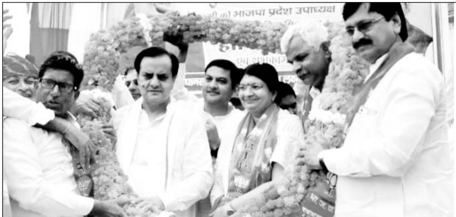
निवाड़ में नवनियुक्त प्रदेश उपाध्यक्ष सुखबीरसिंह जौनापुरिया (बाएं से दूसरे) का दर्जनों स्थानों पर भाजपा कार्यकर्ताओं ने स्वागत किया।

निवाड़, (निर्स)। टोंक सवाई माधोपुर सांसद सुखबीरसिंह जौनापुरिया को राजस्थान भाजपा प्रदेश कार्यकारिणी में प्रदेश उपाध्यक्ष के पद पर मनोनीत किये जाने के बाद मंगलवार को प्रदेश जौनापुरिया का निवाड़ पहुंचने पर निवाड़ सीमा से दर्जनों जगह पर भाजपा के कार्यकर्ताओं ने भव्य स्वागत किया।