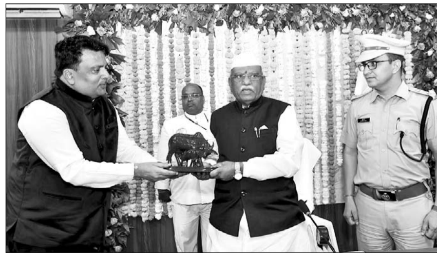
राज्यपाल हरिभाऊ बागड़े को जिला कलेक्टर ने पाली आने पर स्मृति चिन्ह भेंट किया।

पाली, (नि.सं.)। राज्यपाल हरिभाऊ बागड़े ने कहा कि समाज के वंचित वर्ग व पात्र व्यक्तियों को सरकार की योजनाओं का लाभ मिले जिससे कि उनका जीवन खुशहाल हो सके अधिकारी इसमें अपनी महत्वपूर्ण भूमिका का निर्वहन करें। राज्यपाल शनिवार को जिला परिषद के सभागार में जिला स्तरीय अधिकारियों के साथ संवाद किया। राज्यपाल ने जिला स्तरीय अधिकारियों के साथ संवाद के दौरान राज्य व केंद्र प्रवर्तित योजनाओं एवं कार्यक्रमों के प्रभावी क्रियान्वयन पर बल देते हुए इनका लाभ आमजन तक प्रभावी रूप से पहुंचाने के संबंध में आवश्यक दिशा-निर्देश दिए।