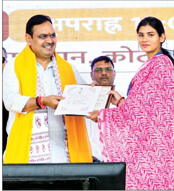
मु. मंत्री भजनलाल ने कोटा में आयोजित रोजगार उत्सव एवं युवा सम्मेलन में 7 हजार 800 से अधिक कार्मिकों को नियुक्ति पत्र प्रदान किये।

शुभारंभ किया। इस दौरान अभियान से संबंधित वीडियो फिल्म का प्रदर्शन एवं विवरणिका का विमोचन किया गया। शर्मा ने शिक्षा विभाग के दो ऐप एवं आरएसओएस अन्तर्गत ऑन डिमाण्ड परीक्षा तथा डिजिटल प्रवेश उत्सव का शुभारंभ किया तथा रोजगार प्रदर्शनी भी देखी।