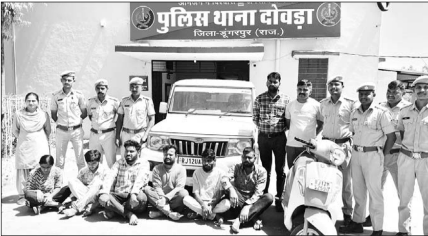
दोवड़ा थाना पुलिस ने लूट व मारपीट मामले का खुलासा कर आरोपियों को गिरफ्तार किया।

डूंगरपुर, (निसं)। गणेशपुर थानान्तर्गत गत 22 मार्च को एक कार में जा रहे भाजपा मण्डल अध्यक्ष पर हुए जानलेवा हमले व डकैती का एक सप्ताह में ही खुलासा कर आरोपियों को गिरफ्तार कर लिया, जिसमें मुख्य आरोपी प्रार्थी के पुत्र व पुत्री के साथ प्रेमी भी शामिल था, जिन्होंने अपने साथियों के साथ मिलकर घटना को अंजाम दिया था। यही नहीं पूरी योजना को दो लाख रुपये की सुपारी देकर करने के लिए तैयार किये थे, लेकिन घटना में भाजपा मण्डल अध्यक्ष अपनी सजगता से जान बचाकर भागने में सफल हो गये थे।