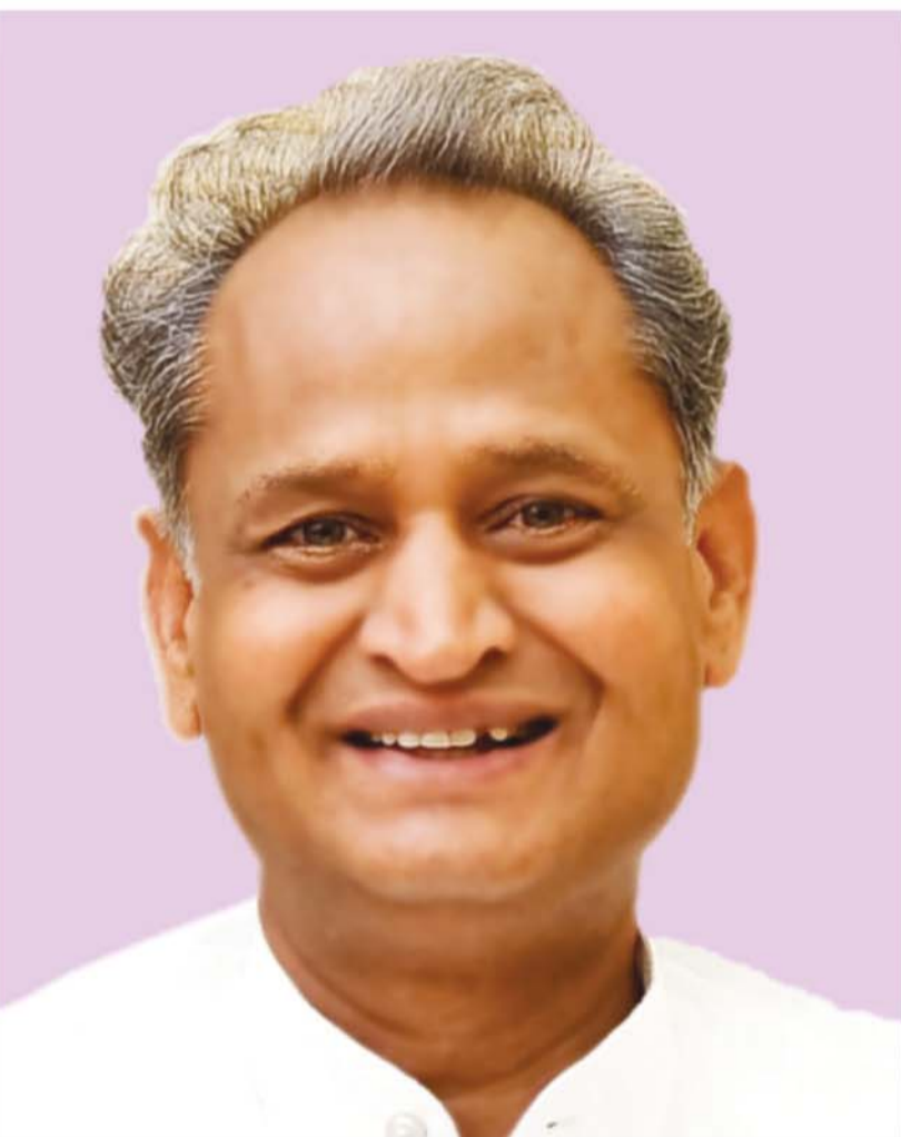
अशोक गहलोत मुख्यमंत्री, राजस्थान

दिनांक: 06 अक्टूबर, 2022 | समय: सायं 6.00 बजे | स्थान: कर भवन परिसर, जनपथ, जयपुर