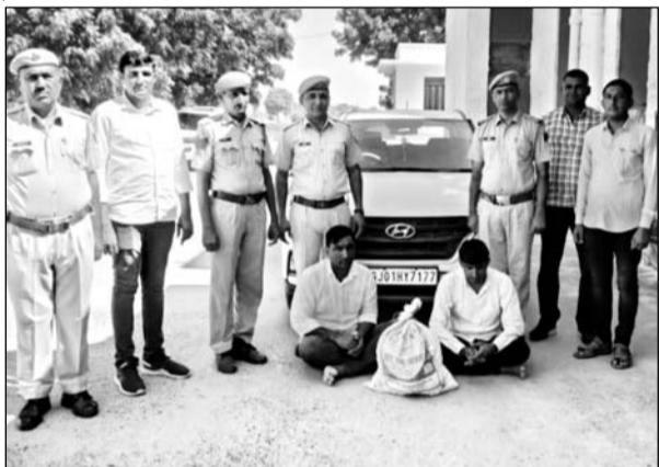
चितलवाना पुलिस ने अवैध अफीम का दूध बरामद कर अध्यापक सहित दो आरोपियों को गिरफ्तार किया।