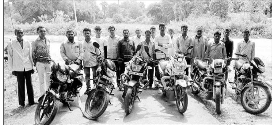
सारंगपुरा गांव के ग्रामीणों ने बदमाशों की बाइकों को पुलिस को सुपुर्द किया।

पकड़े गए युवकों सहित मौका पाकर भागे बदमाशों की सात बाइक ग्रामीणों ने पुलिस को दी