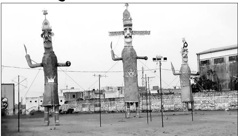
बारिश में भीगते हुए रावण, कुंभकरण एवं मेघनाथ के पुतले।

टोंक, (निसं)। जिला मुख्यालय पर दशहरा के दिन बुधवार शाम को अचानक मौसम बिगड़ने के साथ ही बारिश का दौर शुरू हो गया। शाम को 4 बजे बाद मौसम परिवर्तन होने लगा और बादल छाने के साथ घटाएं आना शुरू हो गईं और शाम 5 बजे बाद से बारिश का दौर शुरू हो गया। अचानक बारिश का दौर शुरू होने से टोंक शहर में दशहरा महोत्सव के तहत स्टैंडियम