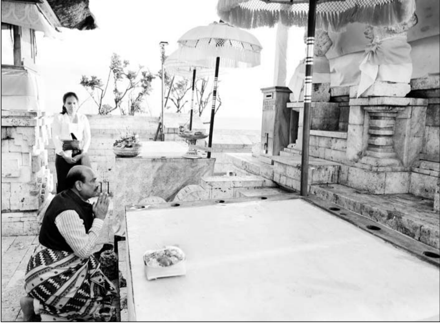
लोकसभा अध्यक्ष ओम बिरला ने बुधवार को बाली, इंडोनेशिया के उलुवातु मंदिर में पूजा अर्चना की।

20 शिखर सम्मेलन का उद्घाटन 6 अक्टूबर को होगा। इसका समग्र विषय “सतत सुधार के लिए सशक्त संसद” है। प्रतिनिधि समग्र विषय के व्यापक दायरे के भीतर चार उप-विषयों पर विचार-विमर्श करेंगे। शिखर सम्मेलन के अंत में एक संयुक्त वक्तव्य स्वीकार किया जाएगा। लोक सभा अध्यक्ष 6 अक्टूबर को “प्रभावी संसद, जीवंत लोकतंत्र” विषय