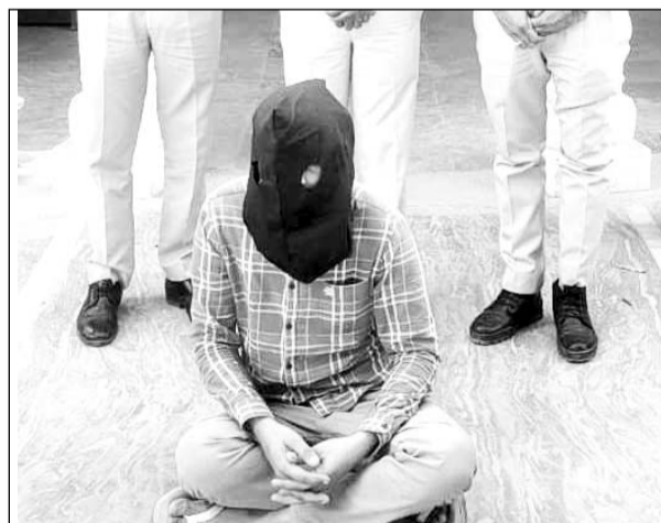
हत्या के मामले में पुलिस ने युवक को बापदां गिरफ्तार किया।