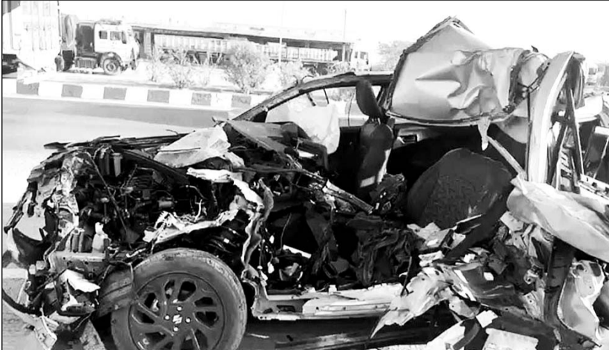
हादसे में कार के आगे का हिस्सा पूरी तरह चकनाचूर हो गया।