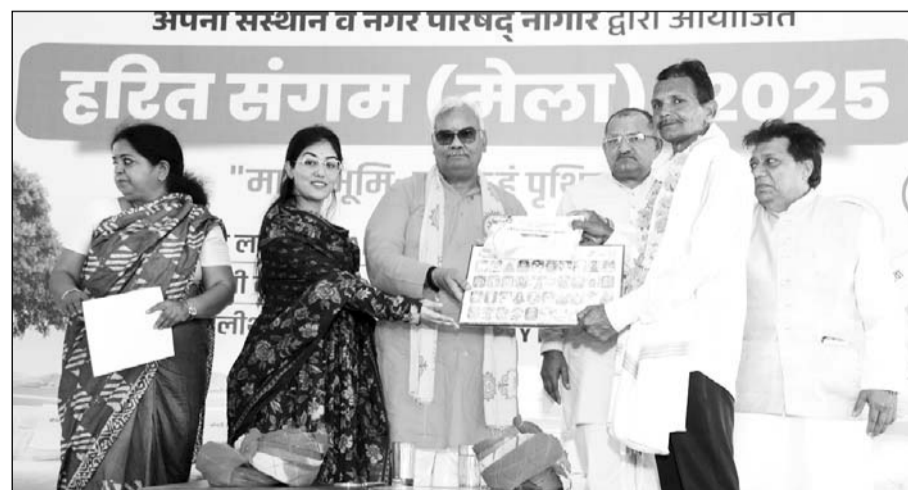
हरित संगम मेला का शिक्षा एवं पंचायती राज मंत्री मदन दिलावर ने उद्घाटन किया।

हैं। उन्होंने कहा कि सबसे पहला काम यह करना होगा कि पॉलीथिन के उपयोग को पूरी तरह छोड़ना होगा। पॉलिथिन की बजाय हम कपड़े से बनी थैली का प्रयोग करें तो गंदगी को काफी हद तक रोक सकते हैं। इसके अलावा डिस्पोजल आईटम के बजाय स्टील की थाली, ग्लास और अन्य बर्तन का उपयोग करें। इसके लिए सरकार पंचायतों को बर्तन बैंक बनाने के लिए एक लाख रुपय भी दे रही है। आपसी सहयोग से भी बर्तन बैंक बनकर उनका संचालन किया जा सकता है। इस अवसर पर शिक्षा एवं पंचायती राज मंत्री दिलावर ने सभा में उपस्थित