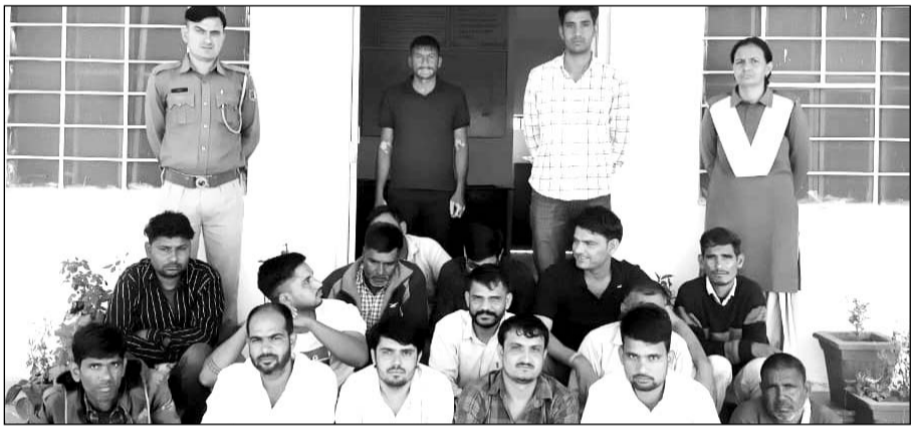
तीन थानों की पुलिस ने 16 जुआरियों को गिरफ्तार किया।

मालपुरा, (निर्स)। डिग्री थाना पुलिस ने रविवार को सावजनिक स्थान पर रुपये पैसे का दाव लगा जुआ खेलते 16 जुआरियों को गिरफ्तार कर 1 लाख 28 हजार रुपये की जुआ राशि व दो वाहन जब्त किया।