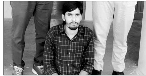
मादक पदार्थ सप्लाई के मामले में फरार आरोपी को गिरफ्तार किया।