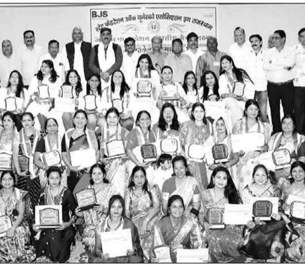
समारोह में युनैस्को ने 121 महिलाओं का सम्मान किया।

भीलवाड़ा, (निसं)। अंतर्राष्ट्रीय महिला दिवस के अवसर पर कोटा रोड स्थित यश विहार में स्टेट फेडरेशन ऑफ यूनेस्को एसोसिएशन इन राजस्थान, जवाहर फाउण्डेशन तथा भारतीय जैन संगठना द्वारा "महिला शक्ति सम्मान" समारोह का आयोजन किया गया। इस समारोह में विभिन्न क्षेत्रों की 121 महिलाओं सहित सांस्कृतिक कार्यक्रम पेश करने वाली महिलाओं व छात्राओं का भी विशेष अभिनन्दन किया गया।