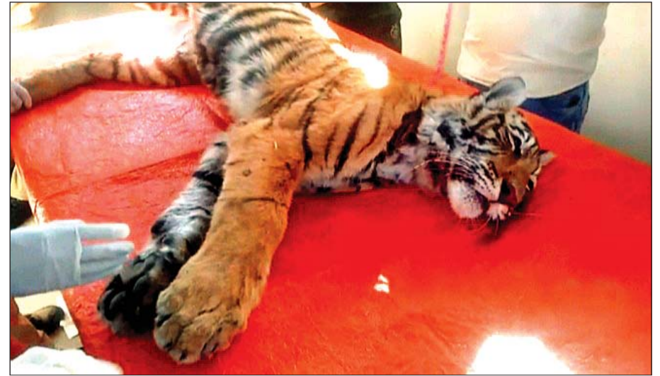
रणथंभौर टाइगर रिजर्व में बाघिन टी-125 की मौत हो गई। वन विभाग की टीम ने बाघिन के शव का नाका राजबाग पर मैडिकल बोर्ड से पोस्टमार्टम करवाया।