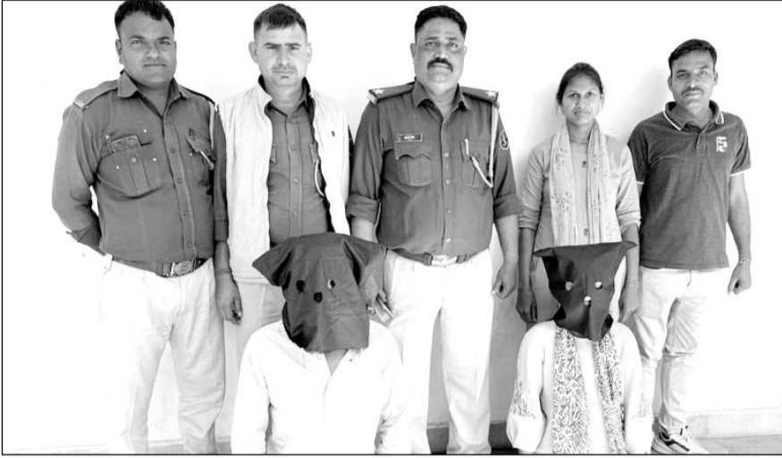
फैसबुक के जरिये व्यापारियों से लूट के सरगना व युवती को बापर्दा गिरफ्तार किया।