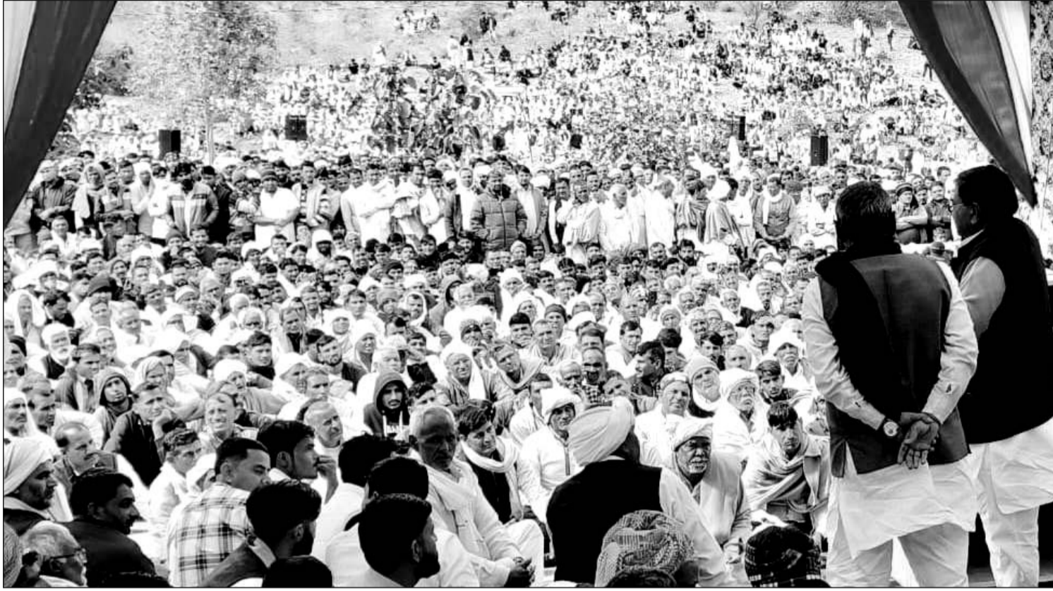
कोटपूतली के निकटवर्ती ग्राम कल्याणपुरा कुहाड़ा में आयोजित वार्षिकोत्सव में भारी जनसमुह उमड़ा।

वहीं दूसरी ओर समारोह में मुख्य अतिथि के तौर पर आमंत्रित पूर्व डिप्टी सीएम सचिन पायलट तो नहीं पहुंचे, लेकिन उन्हें मुख्यमंत्री बनाये जाने का मामला इस दौरान छाया रहा। कार्यक्रम में हैलीकॉप्टर द्वारा मुख्य अतिथि के रूप में भाग लेने पहुंचे यूपी के बिजनौर से लोकसभा सांसद मलूक नागर ने कहा कि अगर कांग्रेस आगामी चुनाव में सचिन पायलट को सीएम चेहरा नहीं