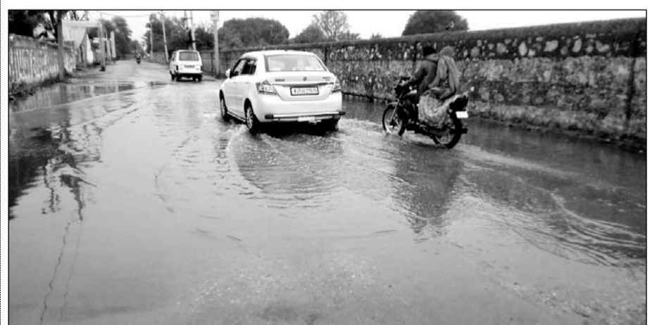
निवाई में बरसात होने से सड़क पर भरा हुआ पानी।

निवाई, (निर्स)। उपखण्ड सहित शहर में शनिवार की रात से सोमवार को दूसरे दिन भी मावठ होने से तापमान में गिरावट आने से ठण्ड बढ़ गई जिससे जन-जीवन प्रभावित रहा। ठण्ड के कारण दिनभर सरकारी दफ्तरों सहित घरों में लोग गर्म कपड़ों में लिपटे रहे और सर्दी से बचने के लिए अलाव