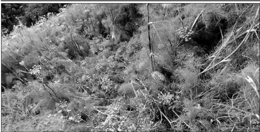
मालपुरा में हुई ओलावृष्टि व तेज बारिश से फसलों में भारी नुकसान हुआ।

किसानों ने फसल खराबे की गिरदावरी करवा सरकार से मुआवजा देने की मांग की