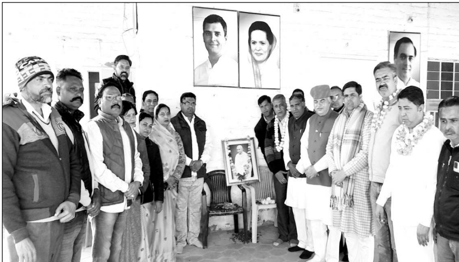
बीकानेर शहर कांग्रेस कार्यालय में भारत जोड़ो यात्रा के प्रथम चरण के समापन पर कांग्रेसजनों ने ध्वजारोहण कर बापू को श्रद्धांजलि दी।