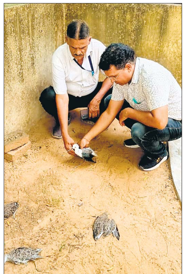
सांभर झील में पांच साल बाद विदेशी पक्षियों की मौत की खबर से प्रशासन सक्रिय हो गया। मृत पक्षियों को पालिका के डंपिंग यार्ड में निर्धारित रीति से दफनाने के निर्देश दिए गए।

आशंका व्यक्त की जा रही है कि गत दिनों नमक कारोबारियों द्वारा रंगीन