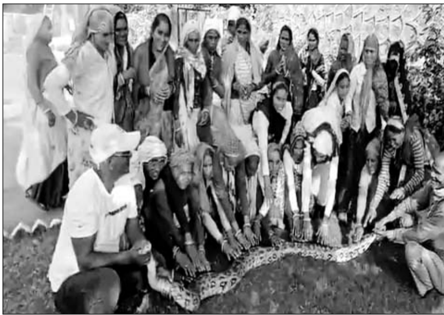
40 किलो वजनी अजगर को देखने गांव की महिलाएं भी पहुंचीं।

अलवर, (निर्स)। अलवर के राजगढ़-बांदीकुई सड़क मार्ग के मध्य स्थित गोठ गांव में एक खेत में करीब 12 फीट का अजगर मिला, जिसका वजन 40 किलो था। वनकर्मीयों की टीम ने अजगर को रेस्क्यू कर जंगल में छोड़ा। गांव के काफी लोग मौके पर पहुंच गए रेस्क्यू टीम के सदस्य जुगनू