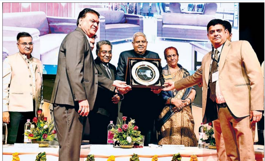
द बार एसोसिएशन जयपुर के ई-लायब्रेरी तथा लॉयर्स डायरी-2025 के लोकार्पण कार्यक्रम में उपराष्ट्रपति जगदीप धनखड़ ने भाग लिया।