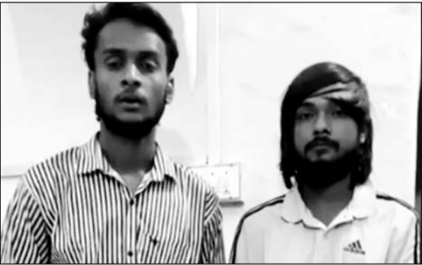
कार में आग लगाने वाले दो आरोपियों को पुलिस ने गिरफ्तार किया।