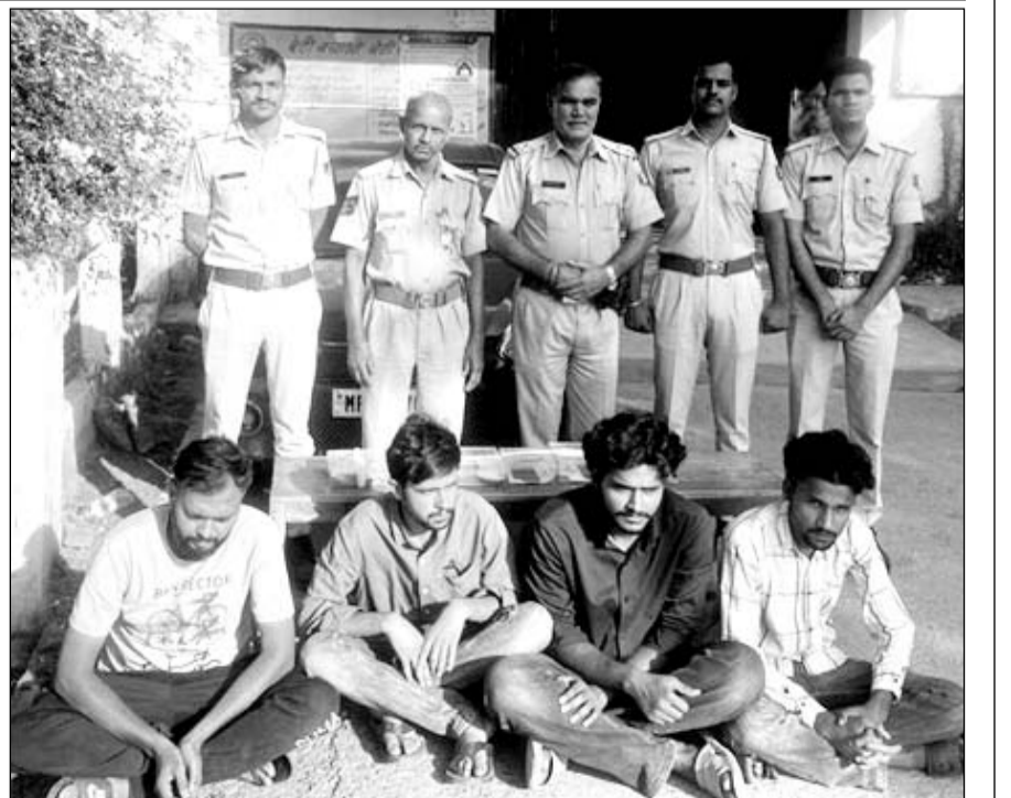
कारोई थाना पुलिस ने नकली नोट कब्जे में रखकर परिवहन करते चार लोगों को गिरफ्तार किया।