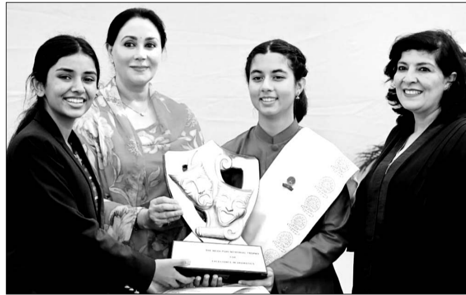
डिप्टी सीएम दीया कुमारी ने छात्राओं को ट्रॉफी प्रदान की।

मेयो कॉलेज में रविवार को आयोजित वार्षिक पारितोषिक वितरण समारोह में डिप्टी सीएम दीया कुमारी ने शिरकत की। इस अवसर पर उन्होंने कहा कि बालिकाएं देश के भविष्य को आकार देने वाली बनेंगी। उन्होंने कहा कि छात्राएं भारत के भविष्य में समाज की पथ प्रदर्शक बनेंगी। इनके द्वारा अपनी मेधा एवं नैतिकता के बल पर देश के भविष्य को आकार देने में महत्वपूर्ण भूमिका निभाई जाएगी। इनके द्वारा प्रदेश और देश का नाम रोशन किया जाएगा। दीया कुमारी ने कहा कि बेटियों ने देश का नाम रोशन किया है। मेयो कॉलेज गर्ल्स स्कूल को बेस्ट रेजिडेंशियल स्कूल का खिताब मिला है, इसके लिए सभी बधाई दी। समारोह में पेरिस ओलम्पियन 2024 दोहा (करर) में आयोजित शांतिगान ओलंपिक क्वालीफिकेशन चैम्पियनशिप में रजत पदक विजेता, इंडियन स्कॉट