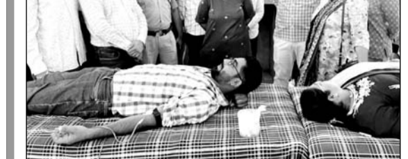
जवाहर नवोदय के पूर्व विद्यार्थियों ने दिवंगत गुरुजनों और साथियों की स्मृति में रक्तदान किया।