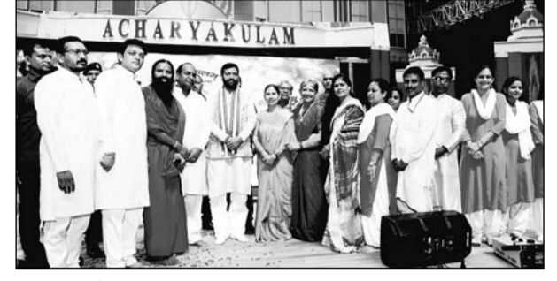
स्वामी रामदेव व आचार्य बालकृष्ण द्वारा स्थापित आवासीय शिक्षण संस्थान आचार्यकुलम् का वार्षिकोत्सव रविवार को धूमधाम से संपन्न हुआ।