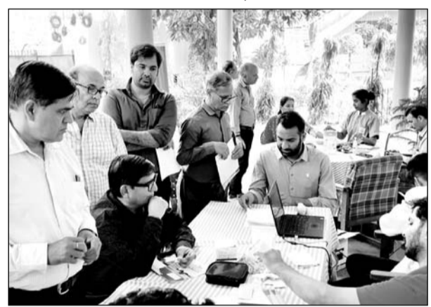
पिंकसिटी प्रेस क्लब में रविवार को निशुल्क चिकित्सा परामर्श एवं जांच कैम्प आयोजित किया गया।

जयपुर। पिंकसिटी प्रेस क्लब में रविवार को प्रियंका हॉस्पिटल कार्डियक सेंटर के सहयोग से निशुल्क चिकित्सा परामर्श एवं जांच कैम्प आयोजित किया गया। पिंकसिटी प्रेस क्लब की ओर से आयोजित इस कैम्प में पत्रकारों, मीडिया संस्थानों के विभिन्न विभागों में कार्यरत कार्मिकों और उनके सैकड़ों परिवारों ने विभिन्न स्वास्थ्य विशेषज्ञों से निशुल्क चिकित्सा परामर्श और जांच का लाभ लिया।