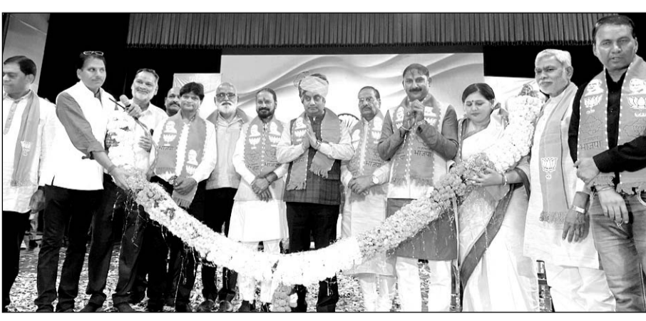
कोटा पहुंचने पर भाजपा के द्वारा सांसद सुधांशु त्रिवेदी का अभिन्नंदन किया गया।

कोटा, (निर्स)। राज्यसभा सांसद और भारतीय जनता पार्टी के राष्ट्रीय प्रवक्ता सुधांशु त्रिवेदी रविवार को कोटा दौरे पर रहे। वे दिनभर में कई कार्यक्रम में व्याख्यान दे रहे। इसी क्रम में करियर प्वाइंट के आर्टिस्टोरियम में भारतीय जनता पार्टी के विचार संगम कार्यक्रम को संबोधित किया। इस दौरान महाकुंभ के विषय पर बोलते हुए उन्होंने कहा कि 66 करोड़ लोगों ने महाकुंभ 2025 में स्नान किया है। जबकि भारत में लोकसभा चुनाव में 64 करोड़ लोगों ने मतदान किया था। महाकुंभ का पर्व संपन्न हुआ है यह मनुष्य जाति के इतिहास का सबसे बड़ा जन-समागम था। भारतीयता, धार्मिकता, संस्कृति की विराटता और वैज्ञानिकता का प्रमाण था। यह अफसोस की बात है कि इंडी गठबंधन के तमाम नेताओं ने अपमानजनक शब्द कहे। चाहे कांग्रेस अध्यक्ष खड़गे ने कहा हो कि गीता जल में डूबकी लगाने से क्या होगा। लालू प्रसाद यादव ने फालतू का बोला। सीएम ममता बनर्जी ने मृत कुंभ बोला है। देश की जनता सब समझती है। इन सभी नेताओं के मन में भारतीय संस्कृति