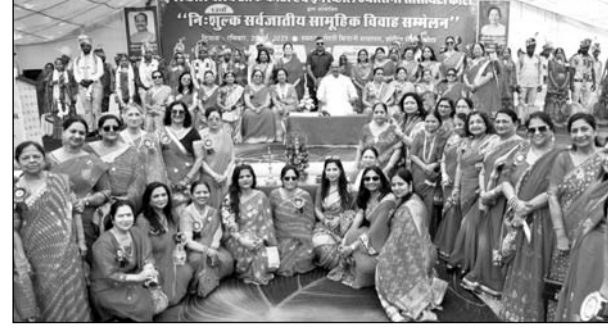
कोटा में निःशुल्क सर्वजातीय सामूहिक विवाह सम्मेलन संपन्न हुआ।