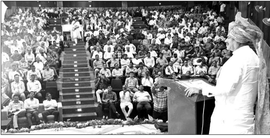
शिक्षा विभाग कर्मचारीगण सहकारी समिति 696वें कोटा-बारां की वार्षिक साधारण आमसभा का लोकसभा अध्यक्ष ओम बिरला ने संबोधित किया।

कोटा, (निर्स)। शिक्षा विभाग कर्मचारीगण सहकारी समिति 696वें कोटा-बारां की वार्षिक साधारण आमसभा में लोकसभा अध्यक्ष ओम बिरला ने शिक्षकों की समाज निर्माण में भूमिका पर प्रकाश डालते हुए कहा कि शिक्षा और सहकारिता के समन्वय से राष्ट्र-निर्माण को गति मिलती है। वसुधैव कुटुम्बकम् की भावना के अनुरूप सहकारिता आंदोलन ने विश्वभर में सामाजिक और आर्थिक परिवर्तन की दिशा में क्रांतिकारी बदलाव लाया है। इस आंदोलन में शिक्षकों की भूमिका अत्यंत महत्वपूर्ण रही है, क्योंकि वे व्यक्तित्व निर्माण, चरित्र निर्माण और राष्ट्र निर्माण के आधार होते हैं।