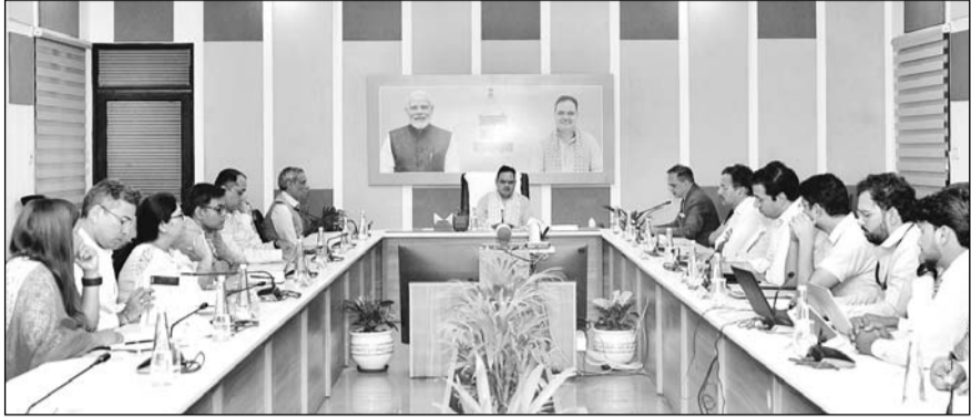
मुख्यमंत्री भजन लाल शर्मा ने अधिकारियों के साथ बैठक कर स्वास्थ्य, ग्रामीण विकास, शिक्षा, पेयजल सम्बंधी दिशा निर्देश दिए।

जयपुर, (निस)। मुख्यमंत्री भजनलाल शर्मा के सक्रिय प्रयासों के फलस्वरूप स्वास्थ्य, ग्रामीण विकास, शिक्षा, पेयजल, कृषि व आधारभूत संरचना आदि क्षेत्रों के विकास के लिए संचालित केन्द्रीय योजनाओं में राज्य को मिलने वाली राशि में उल्लेखनीय वृद्धि की गई है।