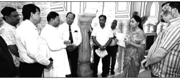
जयपुर विवाह स्थल समिति, जयपुर के पदाधिकारीओं ने उप मुख्यमंत्री दिया कुमारी को मांगों को लेकर ज्ञापन सौंपा।

जयपुर, (निस)। आज सिटी पैलेस में जयपुर विवाह स्थल समिति, जयपुर के पदाधिकारीओं ने उप मुख्यमंत्री दिया कुमारी को ज्ञापन पत्र देकर नगर निगम द्वारा विवाह स्थलों पर पार्किंग अनिवार्य करने के नियम में राहत देने का अनुरोध किया।