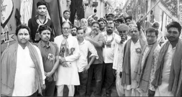
हनुमान जयंती पर शोभायात्रा शोभायात्रा निकाली।

सुरौट, (निर्स)। कस्बे में 2 अप्रैल को हनुमान जन्मोत्सव के पावन अवसर पर श्री हनुमान चालीसा कोर कमेटी, सुरौट के तत्वाधान में भव्य एवं आकर्षक शोभायात्रा का आयोजन किया गया। इस धार्मिक आयोजन को लेकर पूरे नगर में सुबह से ही उत्साह, श्रद्धा और भक्ति का अनूठा संगम देखने को मिला। जगह-जगह श्रद्धालुओं द्वारा पुष्प वर्षा कर शोभायात्रा का स्वागत एवं सम्मान किया गया, जिससे पूरा वातावरण भक्तिमय हो उठा।