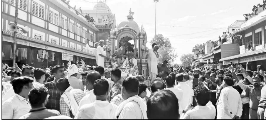
भगवान महावीर की रथयात्रा में जनसैलाब उमड़ा।