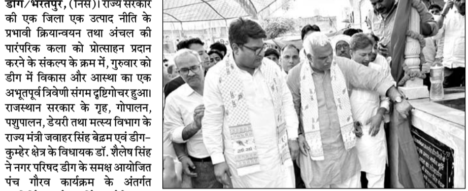
गृह राज्य मंत्री मार्बल मूर्ति प्रदर्शनी स्थल का लोकार्पण किया।