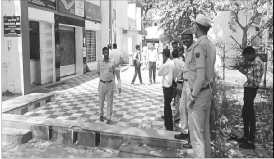
भरतपुर में करोड़ों की ठगी मामले में

जानकारी के अनुसार अलवर पासपोर्ट ऑफिस को इस महीने में तीसरी बार बम से उड़ाने की धमकी मिली है। इससे पहले भी दो बार बम से उड़ाने की धमकी मिल चुकी है। सूचना के बाद मौके पर पहुंची पुलिस ने पूरे ऑफिस को खाली कराकर सघन तलाशी अभियान शुरू कर दिया। इस दौरान पुलिस ने मुख्य गेट को बंद कर किसी भी व्यक्ति को एंट्री पर रोक लगा दी। बताया जा रहा है कि इस हफ्ते में यह दूसरी बार है, जब इस तरह की धमकी मिली है। ई-मेल के जरिए भेजी गई इस धमकी में राजस्थान के कई पासपोर्ट कार्यालयों को निशाना बनाने की बात कही गई है। मेल में लिखा गया कि दोपहर दो बजे से पहले ऑफिस खाली कर दिया जाए, क्योंकि उसके बाद बम विस्फोट किया जाएगा। साथ ही धमकी देने वाले ने कर्नाटक की राजधानी से जुड़े किसी पुद्दे का भी चित्र किया है।