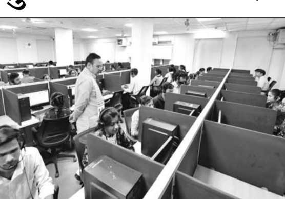
मुख्यमंत्री भजनलाल शर्मा ने बीआईएसएजी (एन) द्वारा विभिन्न विभागीय परियोजनाओं की समीक्षा की।

जयपुर, (निस)। मुख्यमंत्री भजनलाल शर्मा ने कहा कि विकसित ग्राम-विकसित वार्ड अभियान के अंतर्गत स्थानीय लोगों से सुझाव लेते हुए वर्ष 2030, 2035 एवं 2047 तक की आवश्यकताओं के अनुरूप गांव एवं शहरों के विकास का मास्टर प्लान एवं रोडमैप तैयार किया जा रहा है। मैपिंग इस अभियान का अत्यंत महत्वपूर्ण स्तंभ है। उन्होंने अधिकारियों को निर्देश दिए कि इस अभियान की डिजिटल मैपिंग के लिए भास्कराचार्य राष्ट्रीय अंतरिक्ष अनुप्रयोग एवं भू-सूचना विज्ञान संस्थान (बीआईएसएजी-एन) से सहयोग प्राप्त करते हुए ठोस कार्ययोजना बनाई जाए। शर्मा गुरुवार को मुख्यमंत्री निवास पर बीआईएसएजी (एन) द्वारा विभिन्न विभागीय परियोजनाओं में डिजिटल मैपिंग को बढ़ावा देने के संबंध में बैठक का संबोधित कर रहे थे। उन्होंने कहा कि विकसित ग्राम-विकसित वार्ड अभियान में इस तकनीक से गांवों और शहरों की वास्तविक जरूरतों को