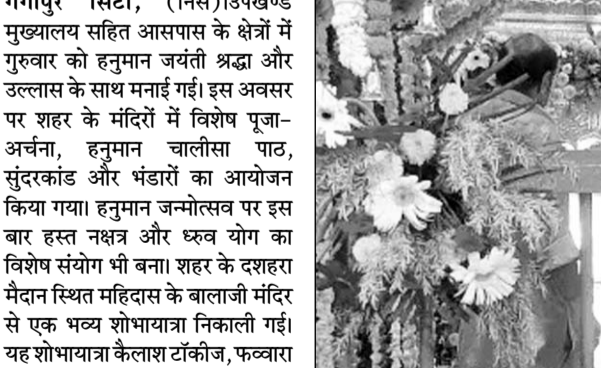
बालाजी चौक पर सजा फूल बंगला झांकी।

छप्पन भोग और फूल बंगला झांकी शामिल थी, जिसमें बड़ी संख्या में श्रद्धालुओं ने भाग लिया। वहीं ममलेश्वर महादेव मंदिर पर भी हनुमान जयन्ती के अवसर पर बालाजी महाराज के चौला चढाया गया एवं शाम को सभी ने सामूहिक सुन्दरकाण्ड का पाठ कर प्रसादी का वितरण किया। उदैई मोड स्थित मनोरथ