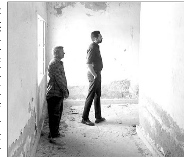
भरतपुर कलेक्टर ने मौका मुआयना कर कुम्हरे में दो उपयुक्त स्थलों का चयन किया।

जयपुर। राज्य सरकार के कौशल, नियोजन एवं उद्यमता विभाग द्वारा युवाओं को वैश्विक रोजगार के लिए तैयार करने की दिशा में एक महत्वपूर्ण पहल के तहत स्किल इंडिया इंटरनेशनल सेंटर्स की स्थापना की जा रही है। यह पहल भारत सरकार के कौशल विकास एवं उद्यमता मंत्रालय द्वारा संचालित एक महत्वाकांक्षी कार्यक्रम है, जिसका उद्देश्य युवाओं को अंतरराष्ट्रीय मार्गों के अनुरूप प्रशिक्षण प्रदान कर उन्हें वैश्विक जांब मार्केट के लिए सक्षम बनाना है।