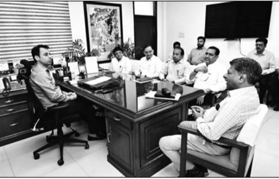
अधिकारियों के साथ औपचारिक बैठक लेकर ली विभिन्न परियोजनाओं की जानकारी।

जयपुर, (निस)। आमजन के आशियाने के सपने को साकार करना आवासन मंडल की सर्वोच्च प्राथमिकता है। यह कहना है आवासन