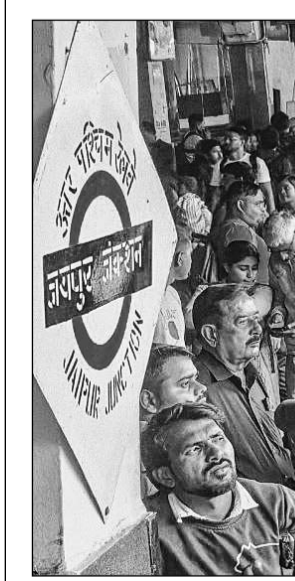
रीट की परीक्षा खत्म हुई तो घर लौटने वालों का रैला लग गया। जयपुर जंक्शन पर जान जोखिम में डालकर अभ्यर्थी रैलागाड़ी पर चढ़ने का प्रयास कर रहे थे।