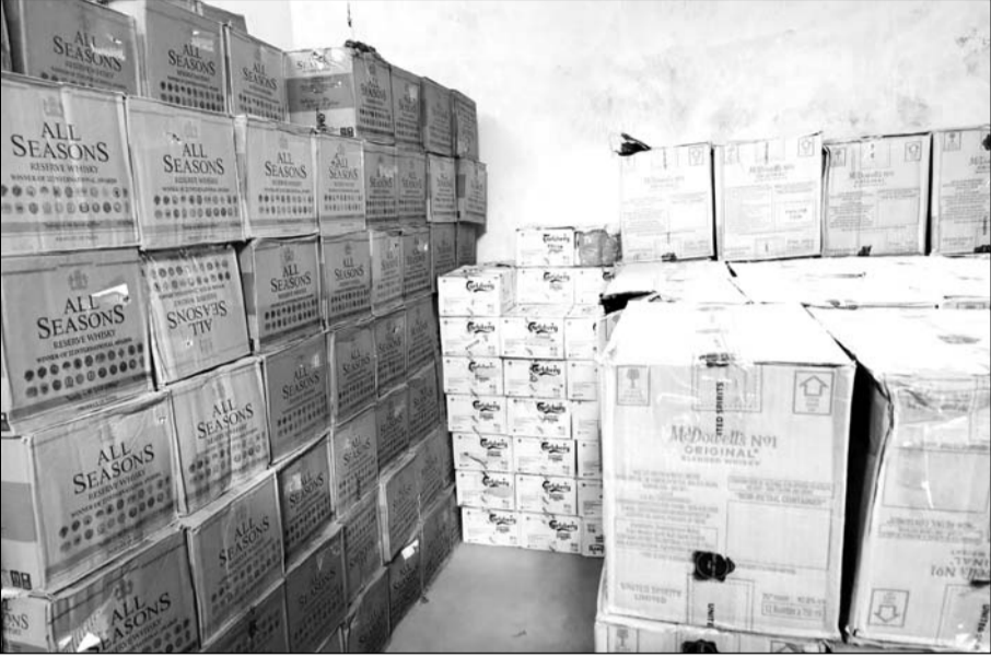
जयपुर ग्रामीण जिले में तस्करी की जा रही अवैध शराब जब्त की।