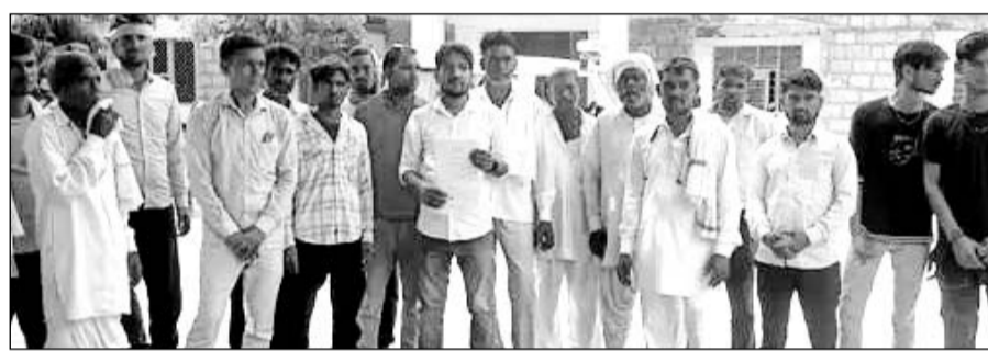
जिला कलेक्टर को ज्ञापन देने जाते ग्रामीण ।