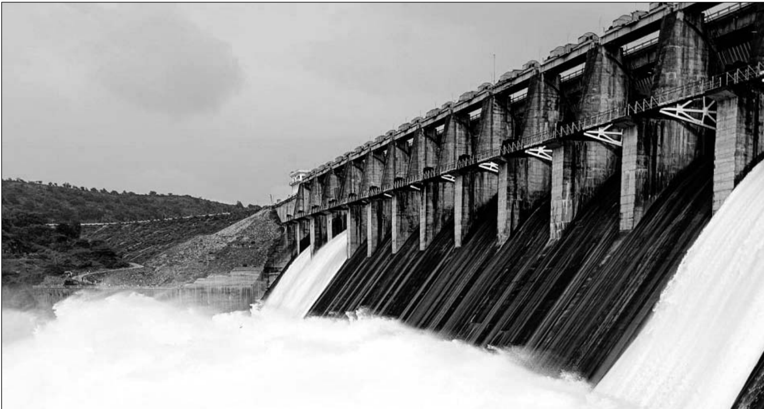
माही बांध के गेट खोलकर पानी की निकासी की जा रही है।