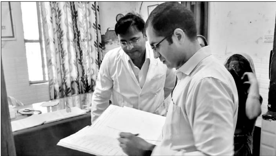
जिला कलेक्टर डॉ. अमित यादव ने सामुदायिक स्वास्थ्य केन्द्र छोंकरवाडा एवं पथैना का औचक निरीक्षण किया

भरतपुर, । जिला कलेक्टर डॉ. अमित यादव ने मंगलवार को सामुदायिक स्वास्थ्य केन्द्र छोंकरवाडा एवं पथैना का आकस्मिक निरीक्षण कर व्यवस्थाओं का जायजा लेकर मौसमी बीमारियों की रोकथाम के लिए किये गये प्रबन्धों की जानकारी ली। संबंधित अधिकारियों को भवन में साफ सफाई में सुधार करने, जांच उपकरणों को सुचारू रूप से चालू रखने के निर्देश दिये। जिला कलेक्टर ने छोंकरवाडा स्वास्थ्य केन्द्र में उपस्थित