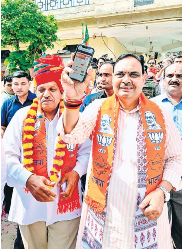
मु.मंत्री भजनलाल शर्मा ने मंगलवार को पुनः भाजपा की सदस्यता ग्रहण की। इसी के साथ ही प्रदेश में भाजपा के सदस्यता अभियान का आगाज हो गया।

जयपुर, 3 सितंबर (का.सं.) भाजपा के प्रदेश अध्यक्ष मदन राठौड़ ने भाजपा प्रदेश कार्यालय में मुख्यमंत्री भजनलाल शर्मा, उप मुख्यमंत्री दीपा कुमारी और डॉ प्रेमचंद बैरवा को पार्टी का सदस्य बनाकर प्रदेश में सदस्यता अभियान का आगाज किया। सदस्यता अभियान कार्यक्रम में भाजपा प्रदेश अध्यक्ष मदन राठौड़ ने कार्यकर्ताओं से अधिक से अधिक सदस्य जोड़ने का