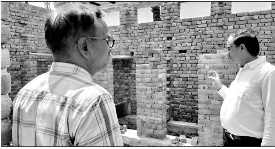
देवस्थान विभाग आयुक्त ने मंगलवार को जिले में देवस्थान विभाग के प्रगतिरत कार्यों एवं मंदिरों की व्यवस्थाओं का निरीक्षण किया

देवस्थान आयुक्त ने लोहागढ किले स्थित बिहारी जी मंदिर में चल रहे विकास कार्यों का निरीक्षण कर सामुदायिक शौचालय, मंदिर के बाहर पाकिंग आदि सुविधाओं के साथ साफ-सफाई कराने के निर्देश दिये। उन्होंने कहा कि मंदिर के सामने स्थित भूमि को समतल कर बिखरी हुई अनावश्यक निर्माण सामग्री हटवाकर इंटरलॉकिंग का प्रस्ताव तैयार करने के निर्देश दिये जिससे श्रद्धालुओं को परेशानी नहीं हो। उन्होंने सम्पूर्ण मंदिर परिसर में साफ-सफाई के साथ श्रद्धालुओं को मूलतः सुविधाओं को प्राथमिकता में रखने के निर्देश दिये। उन्होंने किला परिसर स्थित देवस्थान विभाग के अन्य मंदिरों का भी निरीक्षण किया तथा मंदिरों की साफ-सफाई के साथ परिसरमत्तियों के संरक्षण व सुरक्षा के इंतजाम करने के निर्देश दिये। उन्होंने केला देवी झील का बाड़ा मंदिर परिसर में चल रहे विकास कार्यों