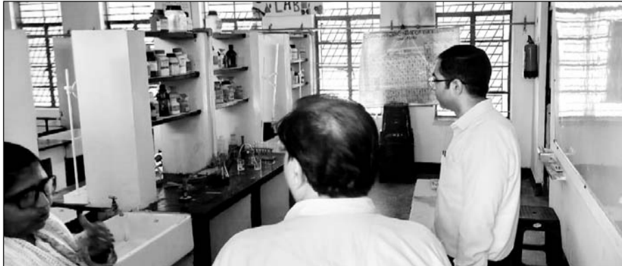
जिला कलेक्टर ने पीएम श्री जवाहर नवोदय विद्यालय छोंकरवाडा का निरीक्षण कर शैक्षणिक गुणवत्ता के साथ व्यवस्थाओं का जायजा लिया।

सुविधाएँ भी मिलें। उन्होंने विद्यालयों में शिक्षण कार्य, निर्माण कार्यों सहित अन्य व्यवस्थाओं, सुविधाओं व सरकार द्वारा विद्यार्थियों के हित में संचालित विभिन्न योजनाओं के क्रियान्वयन का जायजा भी लिया। उन्होंने विद्यालय परिसर का निरीक्षण कर विद्यालय से संबंधित गतिविधियों व उपलब्धियों पर चर्चा की साथ ही विद्यार्थियों व शिक्षकों के साथ वृक्षारोपण कर पर्यावरण संरक्षण का संदेश भी दिया। उन्होंने वृक्षों की महत्वता बताते हुये कहा कि प्रत्येक विद्यार्थी एवं शिक्षकों को भी पौधारोपण