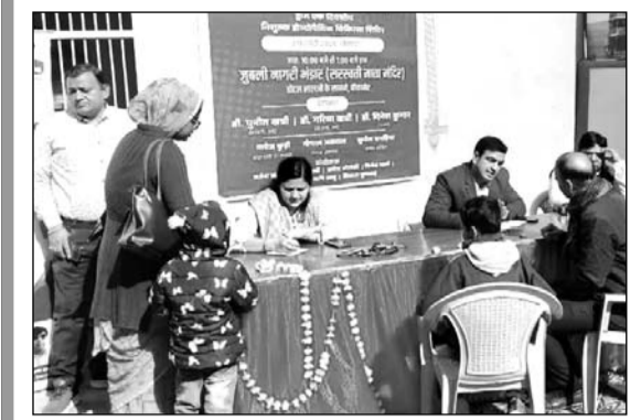
होम्योपैथिक जांच एवं परामर्श शिविर में 160 रोगियों की जांच करके दवाईयां दी।