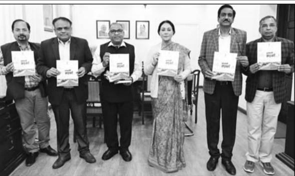
उपमुख्यमंत्री दिया कुमारी ने सोमवार को “आपणी सड़कां...एक मात्र संकल्प: गुणवत्तापूर्ण निर्माण” पुस्तिका का विमोचन किया।