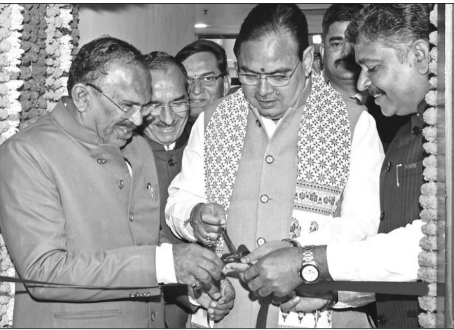
मुख्यमंत्री भजन लाल शर्मा व स्पीकर वासुदेव देवनानी ने विधानसभा में नेवा सेवा केन्द्र का उद्घाटन किया।

ई-लर्निंग कम ई-फैसिलेशन सेन्टर के रूप में कार्य करेगा नेवा सेवा केन्द्र : देवनानी