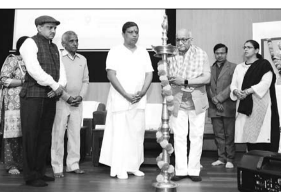
राष्ट्रीय आयुर्वेद विद्यापीठ की ओर से सोमवार को 6 दिवसीय आवासीय प्रशिक्षण कार्यक्रम ‘चरकायतन’ का शुभारम्भ हुआ।

कार्यक्रम के समापन अवसर पर मुख्य अतिथि के रूप में पतंजलि विश्वविद्यालय के कुलपति आचार्य