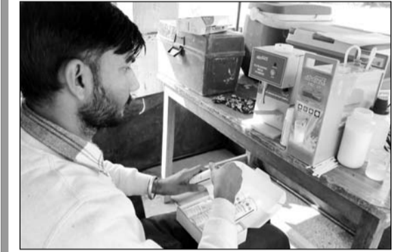
गंगाशहर स्थित महावीर चौक सरस बूथ संख्या-433 पर आयोजित शिविर में दूध के सैम्पलों की जांच की गई।