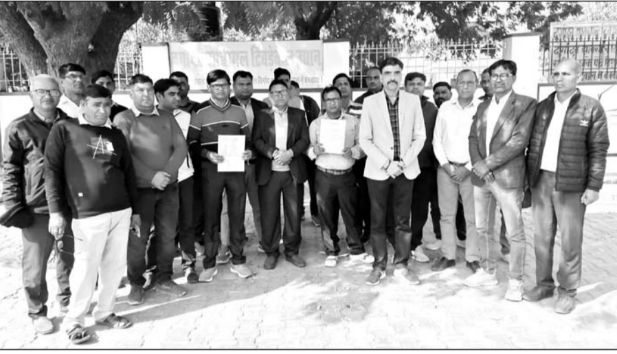
पांच सूत्री मांगों को लेकर आईटीआई संचालकों ने नारेबाजी की।