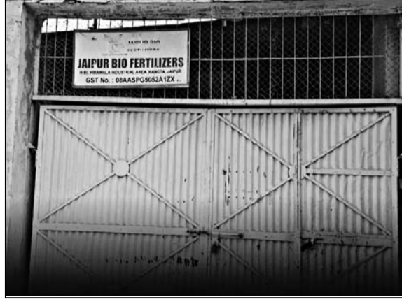
कृषि मंत्री डॉ. किरोड़ीलाल मीणा ने गुरुवार को कानोता क्षेत्र स्थित हीरावाला रीको औद्योगिक क्षेत्र में संचालित 'जयपुर बायो फर्टिलाइजर्स' इकाई पर औचक निरीक्षण कर कार्रवाई की।

से फैक्ट्री संचालकों और आपसपास के औद्योगिक क्षेत्र में हड़कंप मच गया। निरीक्षण के दौरान जैविक उर्वरक निर्माण और भंडारण से जुड़ी कई गंभीर अनियमितताएं सामने आईं, जिसके बाद कृषि विभाग ने नमूने जब्त कर जांच शुरू कर दी है।