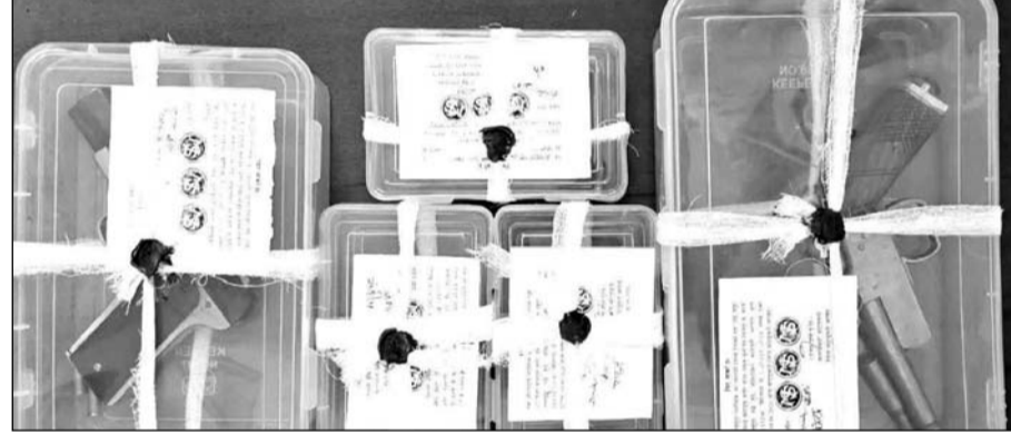
पुलिस ने आरोपियों के कब्जे से देशी पिस्टल, देशी कट्टा व जिन्दा कारतूस बरामद किये।

कोटपूतली, (निर्स)। स्थानीय थाना पुलिस ने अवैध फायर आर्म्स के खिलाफ प्रभावी कार्रवाई करते हुये 1 देशी पिस्टल, 1 देशी कट्टा व 8 जिन्दा कारतूस सहित 5 आरोपियों को गिरफ्तार किया। वहां उनके कब्जे से फायर आर्म्स हथियारों के अतिरिक्त लड़ाई-झगड़ा व मारपीट करने के उद्देश्य से तैयार करवाये हुये हथियार एवं अवैध हथियारों से लगे होकर घूमने में प्रयुक्त वाहन स्विचफ कार को जब्त किया गया है। इस संबंध में जिला