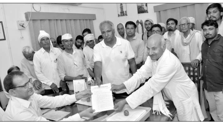
बिजली संबंधित विभिन्न समस्याओं को दुरुस्त करने की मांग को लेकर किसानों ने अधिशाषी अभियंता को ज्ञापन सौंपा।