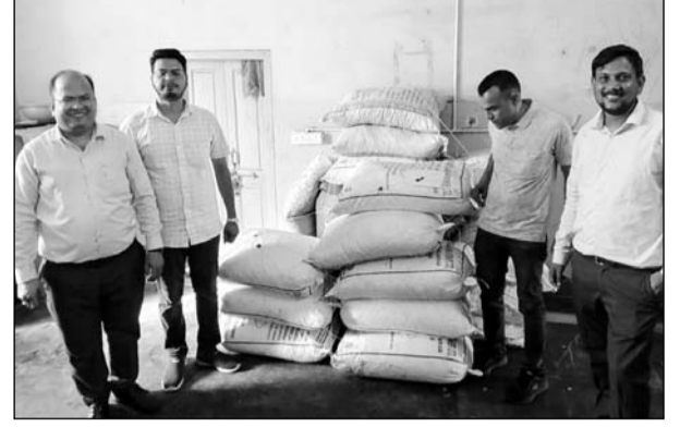
खाद्य सुरक्षा विभाग की टीम ने भीलवाड़ा में कार्रवाई की।

■ खाद्य सुरक्षा विभाग की टीम ने 1250 किलो चटगोला व आंवला कैडी सीज की