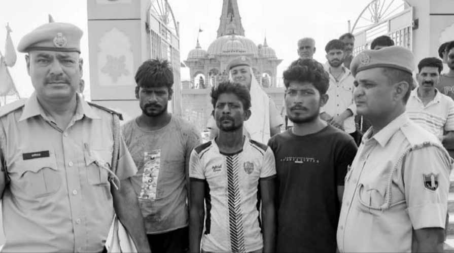
पुलिस ने मौके पर आरोपियों से सीन रिक्रिएशन कराकर साक्ष्य जुटाए और वारदात की तस्वीर की।