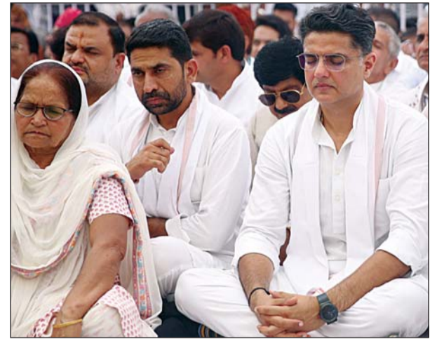
पूर्व उप मुख्यमंत्री सचिन पायलट ने गुरुवार को भंडाना में किसान नेता राजेश पायलट की 26 वीं पुण्यतिथि पर राजेश पायलट स्मारक पर पुष्पांजलि अर्पित की।