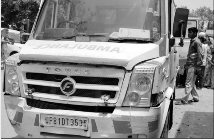
हिण्डौन सिटी के राजकीय जिला अस्पताल की 108 एंबुलेंस में कई खामियां मिलीं।

परिजनों ने आरोप लगाया कि एंबुलेंस में मौजूद खामियों के कारण मरीज की हालत लगातार बिगड़ती रही। स्थिति गंभीर होने पर एंबुलेंस कर्मियों ने दूसरी एंबुलेंस बुलाने की बात कही, जिससे मरीज को करीब आधे घंटे