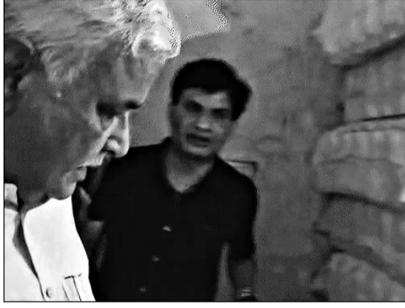
कृषि मंत्री डॉ. किरोड़ीलाल मीणा ने गुरुवार को कानोता क्षेत्र स्थित हीरावाला रीको औद्योगिक क्षेत्र में संचालित 'जयपुर बायो फर्टिलाइजर्स' इकाई पर औचक निरीक्षण कर कार्रवाई की।

■ मंत्री किरोड़ीलाल ने दोषियों पर सख्त कार्रवाई की चेतावनी दी