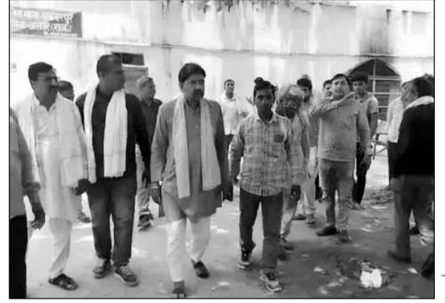
ग्रामीणों ने आरोपियों की गिरफ्तारी को लेकर प्रदर्शन किया