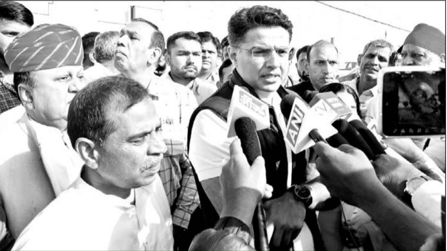
सचिन पायलट ने अजमेर में पत्रकारों से वार्ता की।

बिजनगर ब्लैकमेल कांड के सवाल पर पायलट ने कहा कि सवा साल से राजस्थान में बीजेपी की सरकार है, जो सरकार ने दावे किए और आंकड़े प्रस्तुत किए हैं, लेकिन हकीकत यह है कि लॉ एंड ऑर्डर, महिला उत्पीड़न, इस प्रकार के घिनौने अपराध बढ़ रहे हैं। इस पर अंकुश लगाने के लिए सरकार ने सिर्फ आश्वासन ही दिया है, लेकिन जो प्रशासन पर पकड़ होनी चाहिए और पुलिस के ऊपर प्रभावशाली तरीके से सरकार का नियंत्रण होना चाहिए, उसमें कमी दिखती है। सख्ती की भी कमी है।