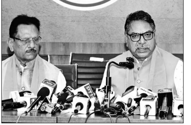
भाजपा के पूर्व प्रदेशाध्यक्ष डॉ.सतीश पूनिया प्रेस से रूबरू हुए।

जयपुर। भाजपा के पूर्व प्रदेश अध्यक्ष डॉ सतीश पूनिया ने रीट पात्रता परीक्षा 2025 के सफल आयोजन को लेकर