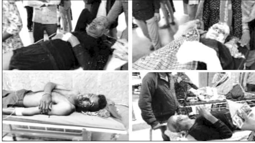
घायल हुये लोगों को अस्पताल में भर्ती कर उपचार किया।

रूपनगढ़, (निस)। निकटवर्ती रूपनगढ़ थाना इलाके के गांव सुरसुरा में सोमवार सुबह घरेलू गैस सिलेंडर बदलते समय अचानक सिलेंडर में आग लग गई तथा सिलेंडर धमाके के साथ फट गया, जिससे आसपास के लोगों में दहशत व्याप्त हो गई। वहीं गैस सिलेंडर की आग बुझाने के लिए अचानक सिलेंडर में आग लग गई तथा सिलेंडर बदल रहा था वही गंधीर रूप से झुलसा है। तीनों को उपचार के लिए जवाहरलाल नेहरू अस्पताल लाया गया जहां झुलसी महिला की हालत नाजुक बनी हुई है।