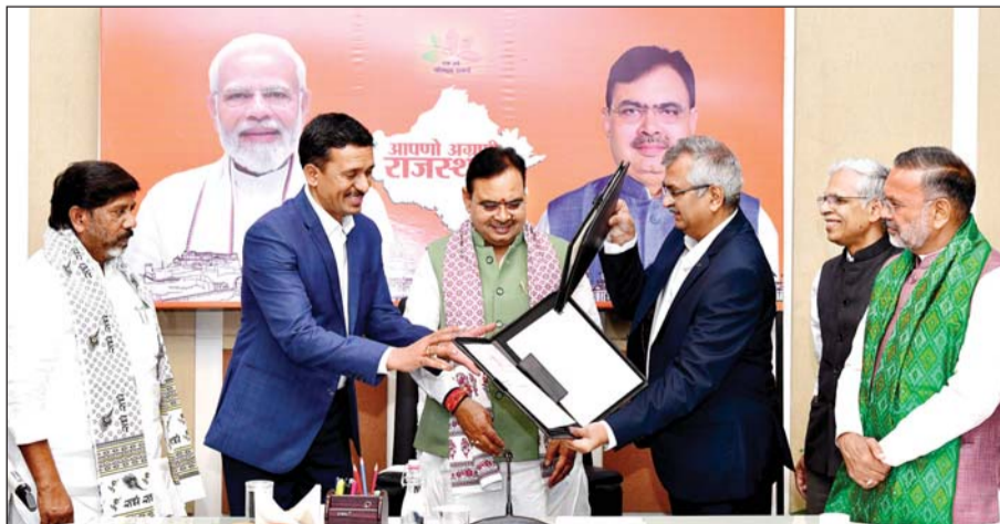
मुख्यमंत्री भजनलाल शर्मा ने सिंगरेनी कोलियरीज़ कंपनी लिमिटेड एवं राजस्थान विद्युत उत्पादन निगम लिमिटेड के मध्य आयोजित समझौता ज्ञापन हस्ताक्षर कार्यक्रम को संबोधित किया।