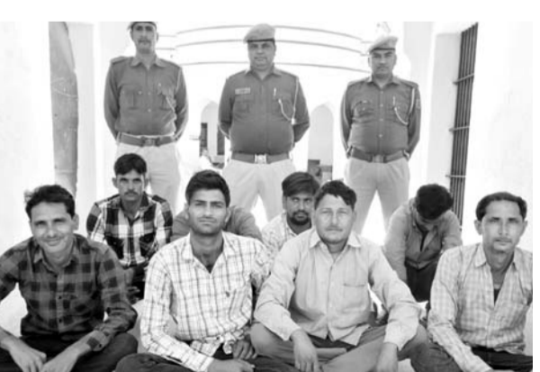
अवैध बजरी खनन व परिवहन की रैकी करते आठ जनों को पकड़ा।