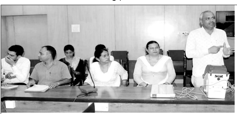
हनुमानगढ़ कलेक्टर रूक्मणि रियार ने वी. सी. के माध्यम से ट्रांसजेंडर्स समाज के बीच होने वाले भेदभाव तथा उनको आ रही दिक्कतों पर की चर्चा।

में कुल 31 पंजीकृत ट्रांसजेंडर मतदाता है। जिसमें संगरिया में 5, पीलीबंगा में 6, नोहर में 4, और भादरा में 2 मतदाता