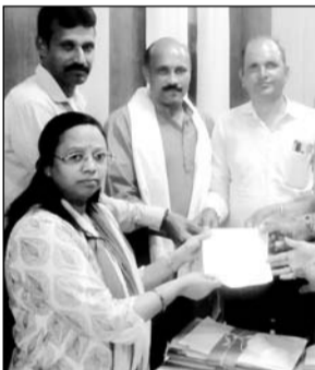
नागरिक अधिकार मोर्चा के कार्यकर्ताओं ने जिला कलेक्टर को ज्ञापन सौंपा।

जानकारी के अनुसार जिले में बजरी का टेका नहीं होने के बावजूद भी खनिज विभाग पूर्व के टेकेदारों की मदद से अवैध खनन भारी मात्रा में करवा रहे हैं। खनिज विभाग द्वारा बजरी एवं खनन माफिया से मिलकर हमेशा करोड़ों रूपय के राजस्व का नुकसान किया जा रहा है। खनिज विभाग में प्रशासन की मिलीभगत से अवैध बजरी दोहन परिवहन से राजस्व को नुकसान