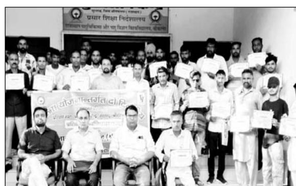
वैज्ञानिक बकरी पालन एवं प्रबंधन विषय पर आयोजित दो दिवसीय शिविर के समापन पर प्रतिभागियों को प्रमाण पत्र बांटे।