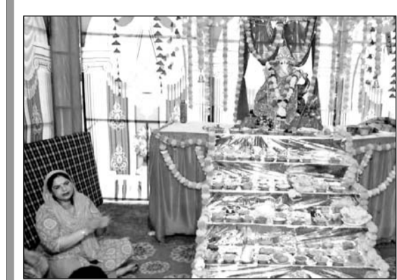
पवनपुरी विकास समिति ने नेहरू बाल उद्यान पार्क में गणेशजी को छप्पन भोग लगाया।