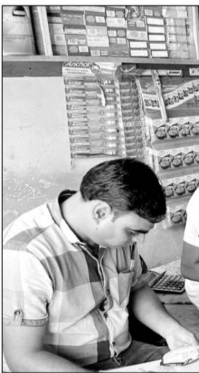
जिले में खाद्य पदार्थों के नमूनों के लिये चलाये जा रहे विशेष अभियान के तहत सादुलपुर में खाद्य सामग्री के खाद्य सुरक्षा टीम ने नमूने लिये।

इसके अलावा खाद्य लाइसेंस और रजिस्ट्रेशन के लिए विशेष शिविर