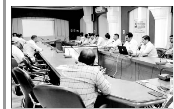
जिला निर्वाचन विभाग की ओर से राजनैतिक दलों के प्रतिनिधियों को प्रशिक्षण दिया गया।