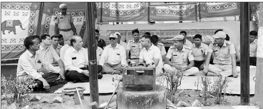
अजमेर में मैस का बहिष्कार कर धरने पर बैठे जेल प्रहरी।

वेतन विसंगति को दूर करने की मांग को लेकर लम्बे समय से संघर्ष कर रहे हैं जेल प्रहरी