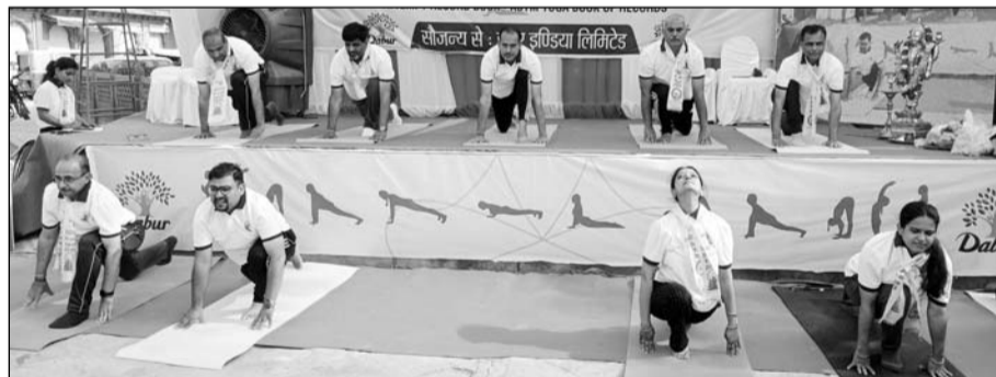
छात्र-छात्राओं एवं शिक्षकों का अखण्ड सूर्य नमस्कार कार्यक्रम।