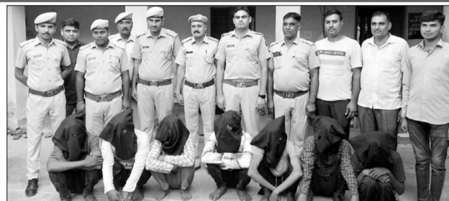
पुलिस की गिरफ्त में अन्तर्राज्यीय गैंग के सदस्य।