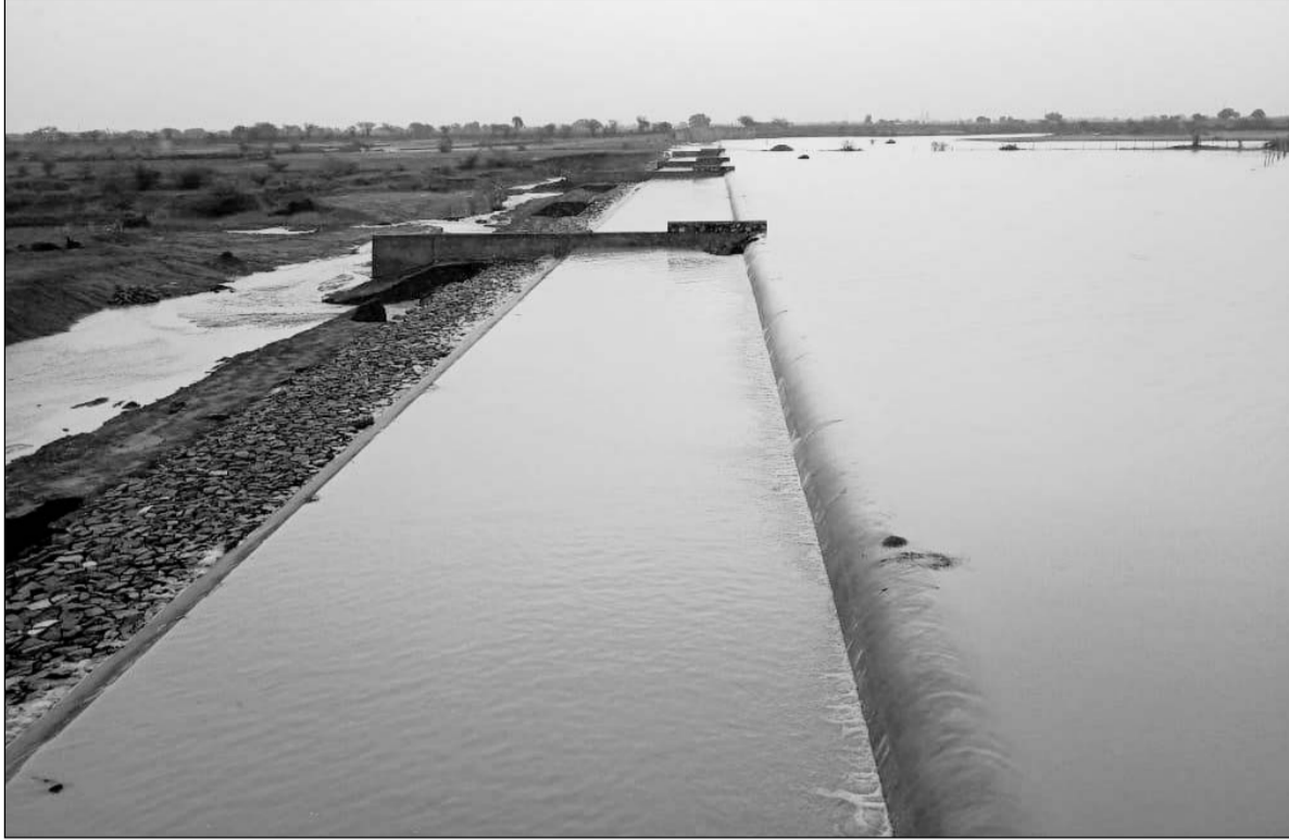
अनियारा क्षेत्र में स्थित गलवा बांध भी एक ही दिन में लबालब हो गया।

वहीं मानसून सीजन में बीसलपुर बांध से व्यर्थ बहने वाले पानी को रोकने के लिए अनियारा उपखण्ड में ईसरदा डैम बनाया जा रहा है। वहीं तूफान के चलते ईसरदा कॉफर डैम भी में पानी का जलस्तर बढ़ गया है। इसके चलते कॉफर डैम के 3 चैनल गेट खोल कर नदी में आ रहे पानी को डायवर्ट कर निकालना शुरू कर दिया गया है। बता दें कि ईसरदा मुख्य बांध निर्माण का कार्य प्रगति पर चल रहा है। इस निर्माण कार्य में बाधा नहीं पहुंचे। इसके लिए कॉफर डैम के चैनल गेट से पानी को डायवर्ट किया गया है।