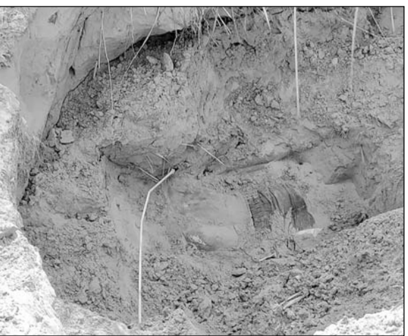
चंदवाजी के पास कंवरपुरा गांव में नदी के पास मिट्टी में युवक का शव दबा हुआ मिला

जानकारी के अनुसार रविवार सुबह कुछ ग्रामीणों को नदी के पास मिट्टी में दबा शव दिखाई दिया और पास ही खून भी बिखरा हुआ था। हत्यारों ने युवक की हत्या करने के बाद जल्दीवाजी में शव के ऊपर ठीक से मिट्टी डालना भूल गए। सूचना पर चंदवाजी थाना पुलिस मौके पर पहुंची। मृतक की पहचान हरचंदपुरा