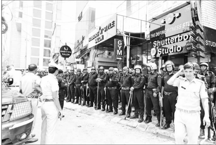
मालवीय नगर क्षेत्र में रविवार को पुलिस और आरएसी कंपनियों के जवानों ने फ्लैग मार्च निकाला। इसके साथ ही नंदपुरी क्षेत्र में बैरिकेड्स लगाकर रास्ते बंद कर दिए हैं।