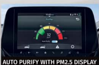
AUTO PURIFY WITH PM2.5 DISPLAY