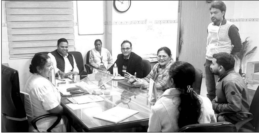
अजमेर जनना अस्पताल के मैटरनिटी ओटी को 98.33 प्रतिशत अंकों के साथ सर्वश्रेष्ठ प्रसव सुविधा के लिए प्रमाणित किया ।

इसी के साथ राजकीय महिला चिकित्सालय को भारत सरकार की ओर से 6 लाख रुपए प्रतिवर्ष 3 साल तक दिए जाएंगे ताकि अधिक गुणवत्ता सुविधाएं उपलब्ध कराई जा सकें। लक्ष्य योजना भारत सरकार के