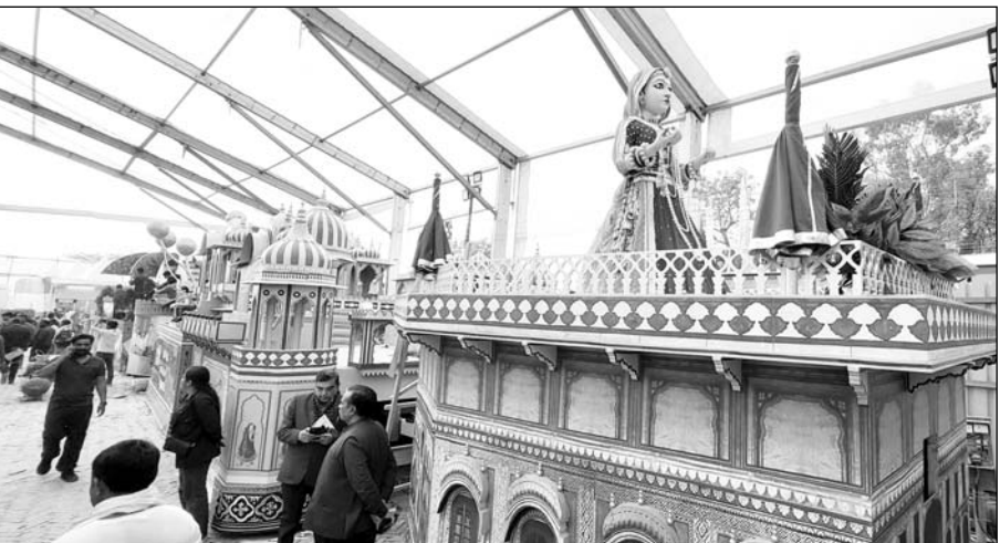
लाल किला प्रांगण में निकलने वाली झांकी का दृश्य।

नई दिल्ली। राष्ट्रीय राजधानी नई दिल्ली में इस वर्ष गणतंत्र दिवस की मुख्य परेड में कर्तव्य पथ से निकलने वाली चुनिंदा झांकियों और दिल्ली के ऐतिहासिक लाल किला प्रांगण में 26 से 31 जनवरी तक आयोजित होने वाले भारत पर्व-2025 में भाग लेने वाली झांकियों की तैयारियों का बुधवार को नई दिल्ली के दिल्ली कैंट परेड ग्राउंड दिल्ली कैंट स्थित गणतंत्र दिवस परेड राष्ट्रीय रंगशाला शिविर में प्रेस प्रिव्यू हुआ। इस वर्ष गणतंत्र दिवस परेड में विभिन्न राज्यों सहित केन्द्रीय मंत्रालयों की 31 झांकियां शामिल होंगी, जबकि लाल किला प्रांगण में 26 से 31 जनवरी तक आयोजित होने वाले भारत पर्व-2025 में मुख्य परेड में शामिल झांकियों सहित विभिन्न राज्यों की 43 झांकियां भाग लेंगी। हालांकि इस बार राजस्थान की झांकी गणतंत्र दिवस की परेड में कर्तव्य पथ से निकलने वाली चुनिंदा झांकियों में तो शामिल नहीं होंगी, लेकिन दिल्ली के ऐतिहासिक लाल किला प्रांगण में आयोजित होने वाले भारत पर्व-2025 में राजस्थान की झांकी सोणो राजस्थान भी मुख्य