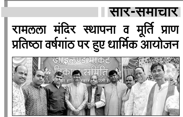
बाजारों में लगाई गई पताकाएं व कार्यक्रम में उपस्थित पदाधिकारी।

उलूखट कार्य करने वाले होंगे सम्मानित : उलूखट कार्य करने वाले व्यक्तियों और संस्थाओं का चयन करने हेतु अतिरिक्त जिला कलेक्टर प्रशासन