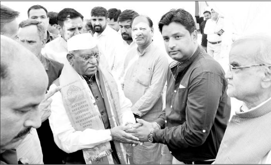
राज्यपाल हरिभाऊ बागड़े का चूक आगमन पर स्वागत किया।

इस अवसर पर राज्यपाल बागड़े ने कहा कि भारत वैश्विक ताकत बनकर उभर रहा है। प्रधानमंत्री नरेन्द्र मोदी के नेतृत्व में देश को अर्थव्यवस्था सुदृढ़ हो रही है और देश सर्वोच्च शक्ति के रूप में स्थापित हो रहा है। उन्होंने कहा कि राजस्थान वीरों की धरती है। राज्यपाल बागड़े ने जिला परिषद सभागार में जिला स्तरीय अधिकारियों से संवाद कर समुचित दिशा-निर्देश दिए। इस दौरान राज्यपाल ने कहा कि राष्ट्रीय शिक्षा नीति-2020 का बेहतरीन क्रियान्वयन करें और भावी पीढ़ी को बौद्धिक रूप से सुदृढ़ करें। बच्चे बौद्धिक रूप से सक्षम होंगे, जिससे सकारात्मक बदलाव हमारे सामने आएगा। इस दिशा में शिक्षा नीति के बेहतर क्रियान्वयन के लिए शिक्षकों को प्रशिक्षण दे तथा शैक्षिक सुदृढ़ीकरण के लिए संकल्पित रहें। उन्होंने कहा कि हरियाणा राजस्थान अभियान के दौरान बड़ी संख्या में पौधे