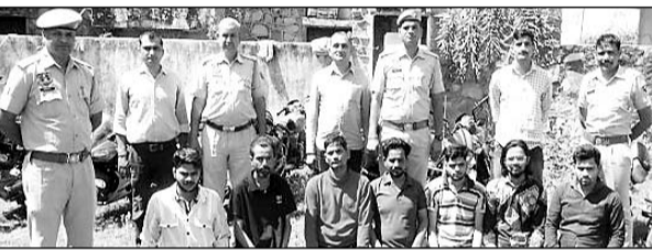
पुलिस ने हुडदंग करने वाले 15 युवकों के खिलाफ कार्रवाई कर उन्हें गिरफ्तार किया।