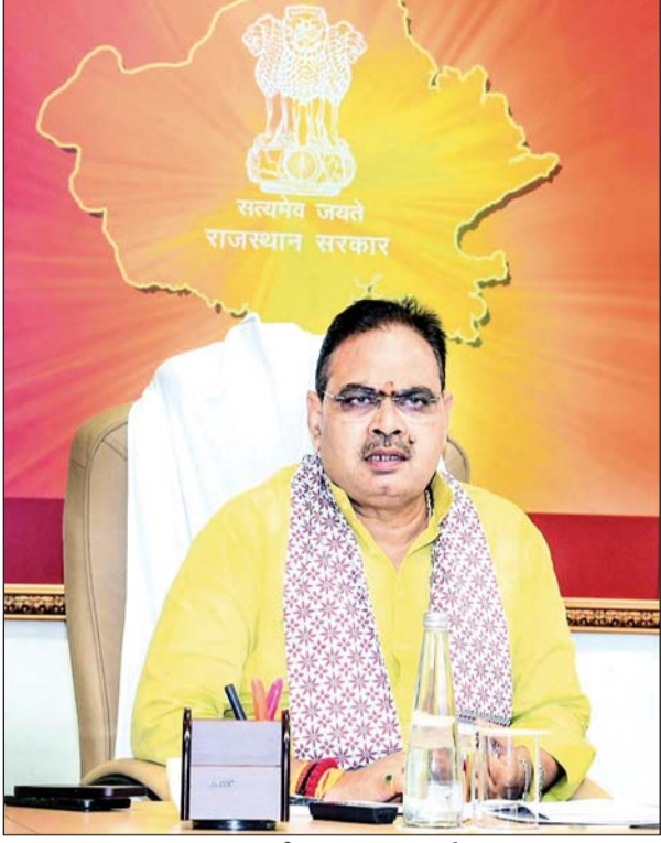
मुख्यमंत्री भजन लाल शर्मा

प्रकरण में सेवानिवृत्त अधिकारी की पेंशन रोकने तथा 3 प्रकरणों में सेवारत अधिकारियों के विरुद्ध राजस्थान सिविल सर्विसेज (क्लासिफिकेशन, कंट्रोल एण्ड अपील) रुल्स, 1958 के नियम 16 के अंतर्गत वार्षिक वेतन वृद्धि रोकने का निर्णय किया। साथ ही, उन्होंने भ्रष्टाचार निवारण संशोधन अधिनियम-2018 के अंतर्गत प्रस्तुत 5 प्रकरणों में 7 अधिकारियों के विरुद्ध