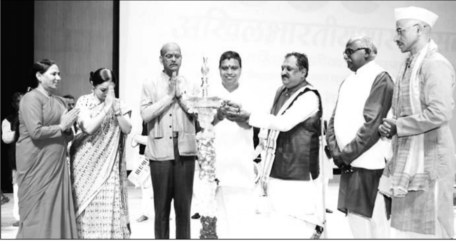
केंद्रीय संस्कृत विश्वविद्यालय, नई दिल्ली एवं पंतजलि विश्वविद्यालय, हरिद्वार के संयुक्त तत्वावधान में आयोजित 62वीं अखिल भारतीय शास्त्र स्पर्धा का उद्घाटन किया गया।