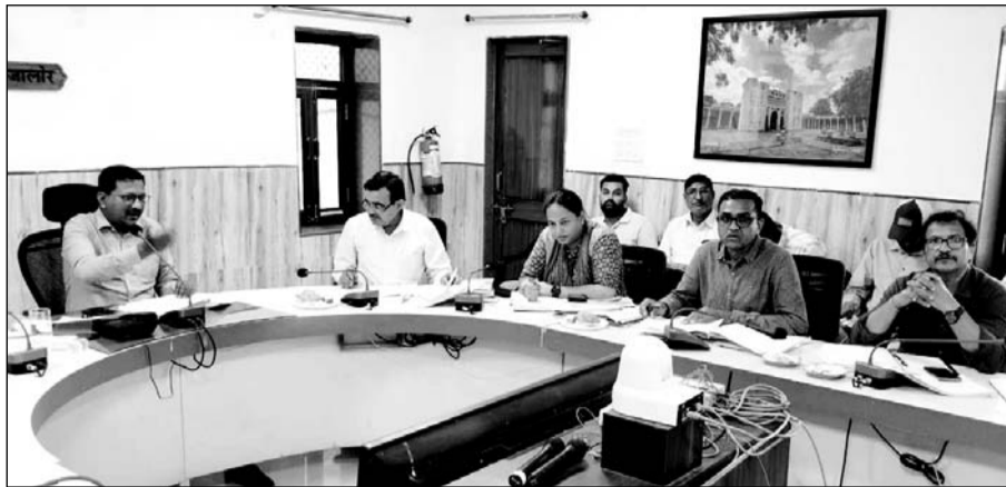
जालोर के कलेक्ट्रेट सभागार में जिला कलेक्टर डॉ. प्रदीप के. गवांडे की अध्यक्षता में ग्रामीण विकास एवं पंचायतीराज विभाग के कार्यों की समीक्षा बैठक हुई।

उन्होंने नरेगा के तहत श्रमिकों को अधिकतम रोजगार मुहैया करवाने के साथ ही मनरेगा कार्य पूर्ण होने पर उसकी जियो टैगिंग करवाने के निर्देश दिए। उन्होंने पंचायत समितियों के पदस्थापित विकास अधिकारियों को कार्यों का विभाजन कर लक्ष्यानुरूप प्रगति अर्जित करने के साथ ही प्रगतिरत कार्यों का नियमित निरीक्षण किये जाने की बात कही। उन्होंने प्रधानमंत्री आवास