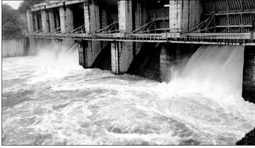
करौली जिले के सबसे बड़े बांध पांचना से पानी की निकासी की जा रही है।