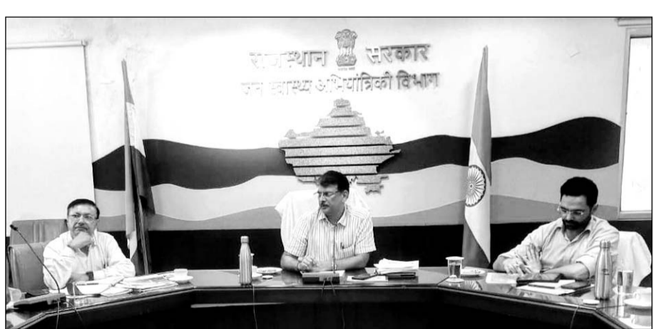
प्रमुख शासन सचिव भास्कर सावंत ने बुधवार को जल भवन में आयोजित जल जीवन मिशन कार्यों की प्रगति की समीक्षा बैठक के दौरान उपस्थित अधिकारियों को सम्बोधित किया।

जयपुर। प्रमुख शासन सचिव भास्कर ए. सावंत ने कहा कि जल जीवन मिशन के तहत जो कार्य आदेश जारी किये गये हैं, उनकी योजना-वार मॉनिटरिंग की जाए। साथ ही प्रत्येक स्तर पर समय सीमा निर्धारित की जाए। उन्होंने कहा कि