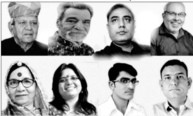
सम्मति होने वाले साहित्यकार।