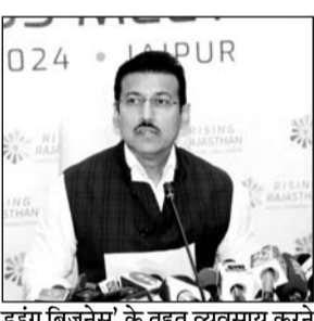
डूइंग बिजनेस' के तहत व्यवसाय करने की लागत में कमी लाना और लाजपताशाही को कम करने का निरंतर प्रयास कर रही है, ताकि उद्योग जगत को प्रदेश में काम करने में आसानी हो।

जयपुर। मुख्यमंत्री भजन लाल शर्मा के नेतृत्व में इस वर्ष दिसंबर में जयपुर में आयोजित होने वाले 'राइजिंग राजस्थान' ग्लोबल इन्वेस्टमेंट समिट 2024 से पहले उद्योग एवं वाणिज्य मंत्री कर्नल राज्यवर्धन राठौड़ ने आज मीडिया को संबोधित किया। आज आयोजित प्रेस कॉन्फ्रेंस में माननीय मंत्री कर्नल राठौड़ ने कहा कि सरकार अगले पांच वर्षों में राज्य के सकल घरेलू उत्पाद को मौजूदा 15 लाख करोड़ रुपये से दोगुना करके 30 लाख करोड़ रुपये तक पहुंचाने का लक्ष्य लेकर चल रही है और 'राइजिंग राजस्थान' ग्लोबल इन्वेस्टमेंट समिट 2024 के जरिए प्रदेश में निवेश जुटाना सरकार की सर्वोच्च प्राथमिकता है। कर्नल राठौड़ ने यह भी कहा कि सरकार 'इज ऑफ