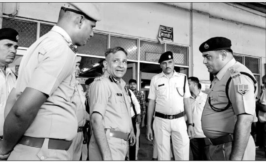
वारदात के बाद अजमेर रेलवे स्टेशन का जीआरपी एएसपी ने मौका मुआयना किया।

अजमेर, (कास)। अजमेर रेलवे स्टेशन पर मासूम बच्चियों के अपहरण और दुराचार की बारदातें धमके का नाम नहीं ले रही हैं। मंगलवार देर रात ऐसा ही एक मामला सामने आया, जब अजमेर स्टेशन के प्लेटफार्म नंबर संख्या एक से 4 साल की मासूम बालिका अपहरण हो गया। बालिका का परिवार सिरौही से दरगाह जियायत के लिए अजमेर आया था और गंतव्य स्थान पर जाने के लिए स्टेशन के प्लेटफार्म पर ट्रेन का इंतजार कर रहा था। घटना के बाद जीआरपी, आरपीएफ और रेलवे अधिकारियों ने तत्परता दिखाते हुए आरोपी को दस घंटे के अंदर अहमदाबाद के चांदोलिया रेलवे स्टेशन पर पोरबंदर एक्सप्रेस से गिरफ्तार कर लिया और बच्ची को सुरक्षित कब्जे में ले लिया। आरोपी को पुलिस टीम देर अजमेर लेकर आई।