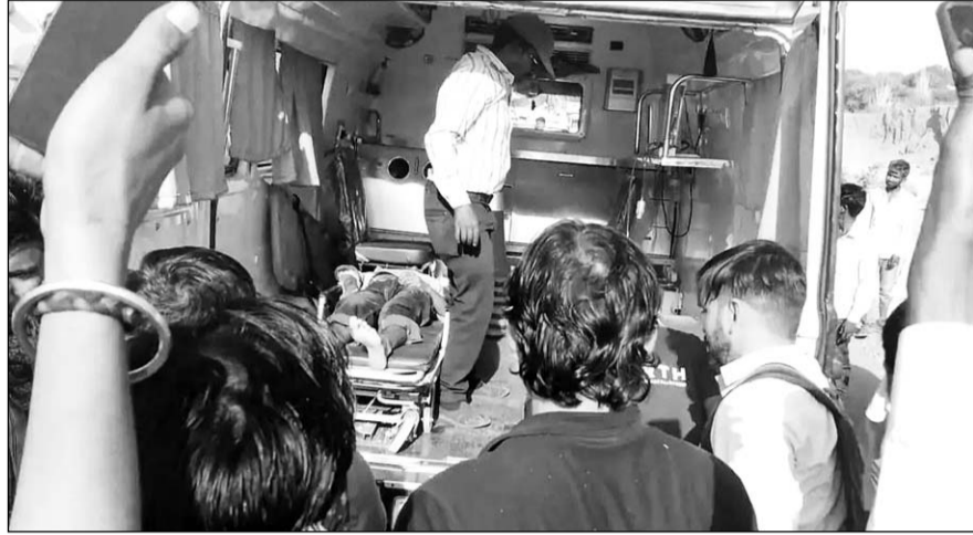
लालसोट में हुये हादसे के घायलों को एंबुलेंस की मदद से अस्पताल पहुंचाया।