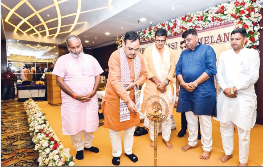
मुख्यमंत्री भजनलाल शर्मा ने शनिवार को कोलकाता में आयोजित राजस्थान प्रवासी सम्मेलन का उद्घाटन किया।

मुख्यमंत्री भजनलाल ने पहले कालीघाट मंदिर में विधि-विधान से पूजा-अर्चना की। फिर बेलीगंज स्थित गोविन्दम इस्कॉन मंदिर में राधा-कृष्ण के दर्शन किए व पूजा की।