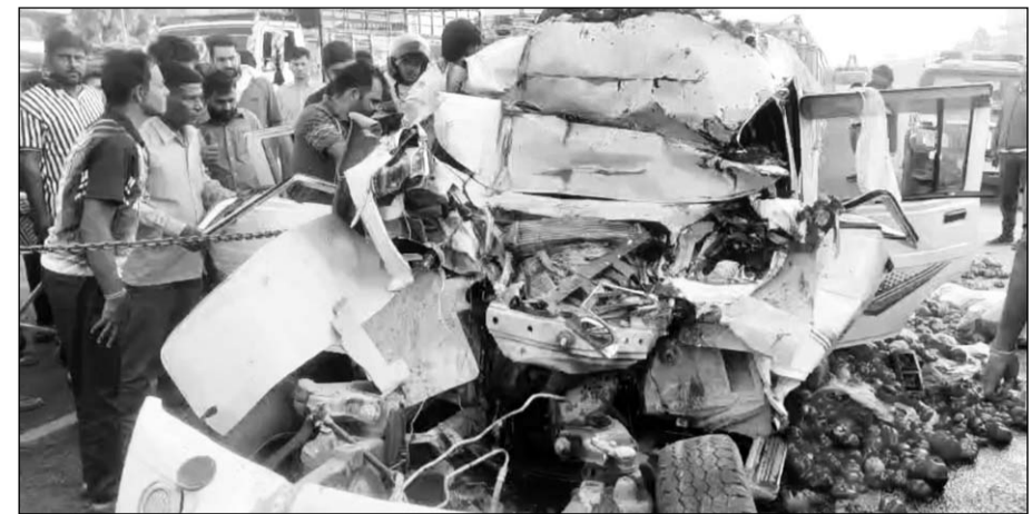
हादसे के बाद स्थानीय लोगों ने तत्परता दिखाते हुए पिकअप में फंसे चालक को बाहर निकाला।

चौमूं/जयपुर। चौमूं थाना क्षेत्र में जयपुर-सीकर हाईवे स्थित राधा स्वामी बाग चौराहे पर शनिवार सुबह एक तेज रफ्तार पिकअप और स्लीपर बस के बीच भीषण टक्कर हो गई। हादसा इतना जोरदार था कि सब्जियों से लदी पिकअप के परखच्चे उड़ गए और चालक वाहन में ही बुरी तरह फंस गया। घटना के बाद मौके पर अफरा-तफरी और चीख-पुकार मच गई।