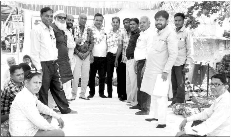
शाहपुरा जिले की मांग को लेकर लोगों ने प्रदर्शन किया।

जिला बचाओ संघर्ष समिति के तत्वावधान में 28 मार्च को शाहपुरा के प्रतिष्ठान बंद रहेंगे