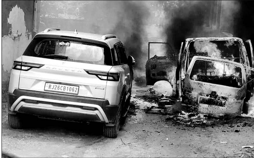
अवैध रूप से गैस रिफिलिंग करते समय लगी आग से जली कारों।

मिली जानकारी में सामने आया कि डेयरी तिराहे के पास आबादी क्षेत्र में मकान के पीछे अवैध रूप से वाहनों में गैस रिफिलिंग के चल रहे अवैध कारोबार की कॉलोनीवासियों द्वारा कई बार शिकायतें करने के बावजूद गैस एजेंसी सहित थाना पुलिस व पालिका प्रशासन द्वारा ठोस कार्यवाही नहीं किये जाने से इस अवैध गैस रिफिलिंग का कारोबार फल-फूल रहा है। मंगलवार की दोपहर रिफिलिंग के दौरान लगी आग से मारुती वैन मौके पर ही जलकर राख हो गई। तो पास ही एक लार्जरी कार के आगे के दोनों टायर सहित वॉयरिंग व अन्य पार्टस जल