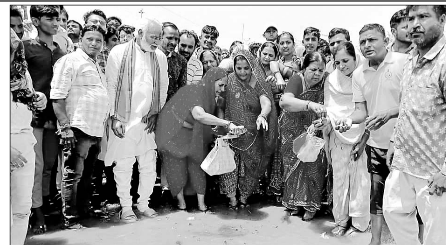
बालोतरा में लूणी नदी के आने से ग्रामीणों ने पूजा-अर्चना की।

सिवाणा उपखण्ड क्षेत्र के मोतीसरा गांव में घुसा पानी :-