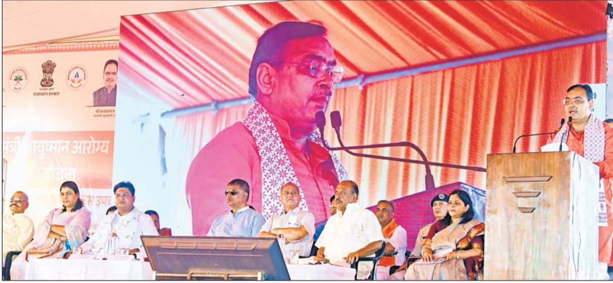
मुख्यमंत्री भजनलाल शर्मा प्रधानमंत्री के वर्चुअल शिलान्यास कार्यक्रम में भरतपुर के आर.बी.एम. अस्पताल से वीडियो कॉन्फ्रेंस के जरिए शामिल हुए।