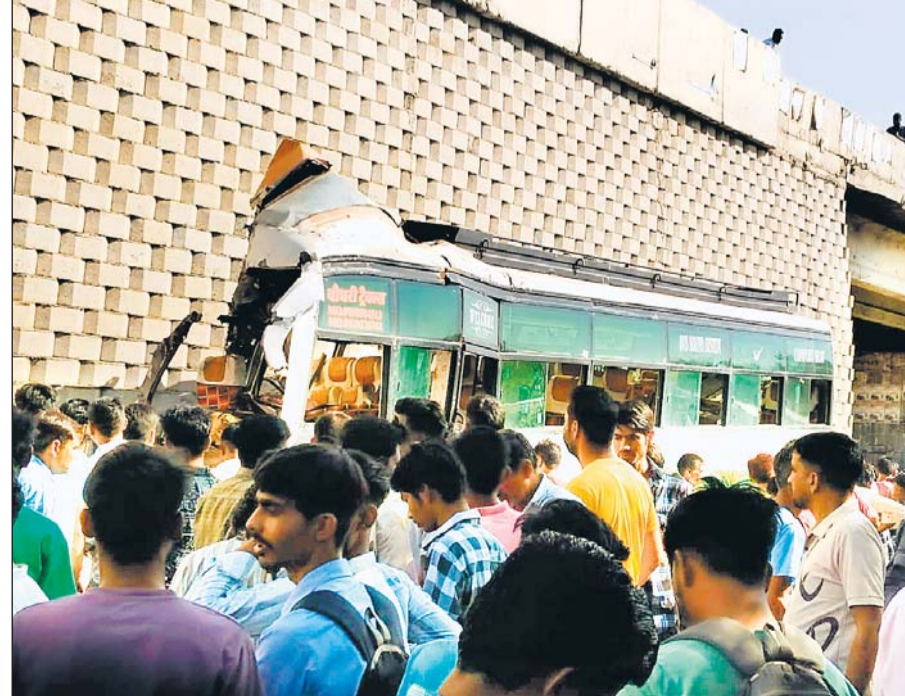
सीकर के पास लक्ष्मणगढ़ में निजी बस अनियंत्रित होकर पुलिया से टकराई। दुर्घटना में 12 जनों की मृत्यु हुई।