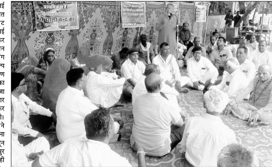
जवाई बांध में पर्याप्त पेयजल आरक्षित रखने की मांग को लेकर कलेक्ट्रेट के बाहर धरना जारी रहा।