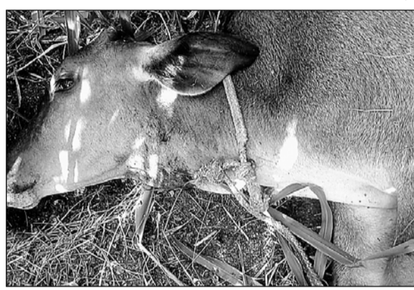
मृत गोवंश के गले में नाखूनों के लगे निशान।