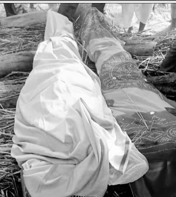
पति-पत्नी का एक ही चिता पर दाह संस्कार किया गया।