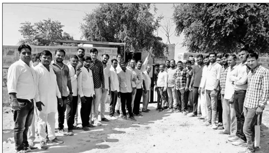
आम पशुपालक को सुविधा नहीं मिलने से क्षुब्ध गो पुत्र सेना ने धरना-प्रदर्शन किया।

बाप, (निसं)। जोधपुर जिले के बाप कस्बे में संचालित प्रथम श्रेणी राजकीय पशु चिकित्सालय में एक भी पशु चिकित्सक नहीं है। स्वीकृति 7 पदों में से पांच रिक्त पड़े हैं। अभी अस्पताल महज एक पशु परिचर के भरोसे ही है। इस कारण लंबी स्किन जैसी भयंकर बीमारी में बीमार गोवंश को उपचार नहीं मिल पाया। हजारों गोवंश काल कलवित हो गया। बीमारी की भयावता अभी भी जारी है। पशुओं के अंग सड़ने लगे हैं। कीड़े तक पड़ गए हैं। सरकारी पशु चिकित्सालयों में किसी प्रकार की आम पशुपालक को सुविधा नहीं मिलने से क्षुब्ध गो पुत्र सेना ने पूर्व सूचना अनुसार सोमवार को बाप में संचालित प्रथम श्रेणी पशु चिकित्सालय के मुख्य द्वार पर ताला जड़कर अनिश्चितकालीन धरना शुरू कर दिया।