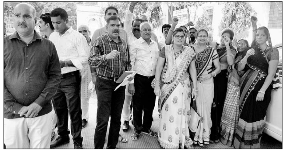
मांग को लेकर जिला कलक्ट्रेट के बाहर प्रदर्शन करते गुर्जर गौड़ ब्राह्मण समाज के लोग।