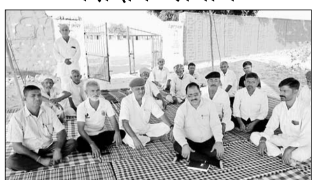
बाप में धरना स्थल पर ग्रामीणों से सीबीईओ ने वार्ता की।

बाप, (निसं)। धोलिया स्थित राजकीय माध्यमिक विद्यालय में रिक्त पद भरने की मांग को लेकर किया जा रहा तालाबंदी आंदोलन व धरना प्रदर्शन पांचवे दिन सोमवार सुबह समाप्त हो गया।