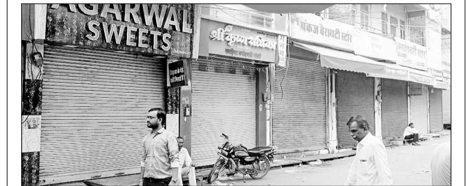
घटना के विरोध में बंद पड़े खाटूश्यामजी के बाजार।