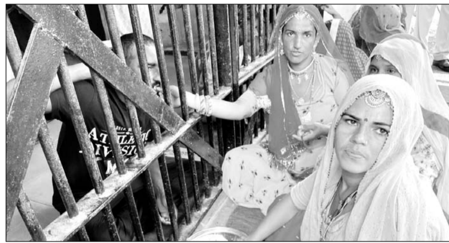
अजमेर सेंट्रल जेल में कैदी भाइयों को मिठाई खिलाती बहनें।

रक्षाबंधन के पर्व पर देशवासियों की रक्षा करने वाले सीआरपीएफ के जवानों को महिला मोर्चा की बहनों ने कल ई प रक्षा सूत्र बांध कर उनके