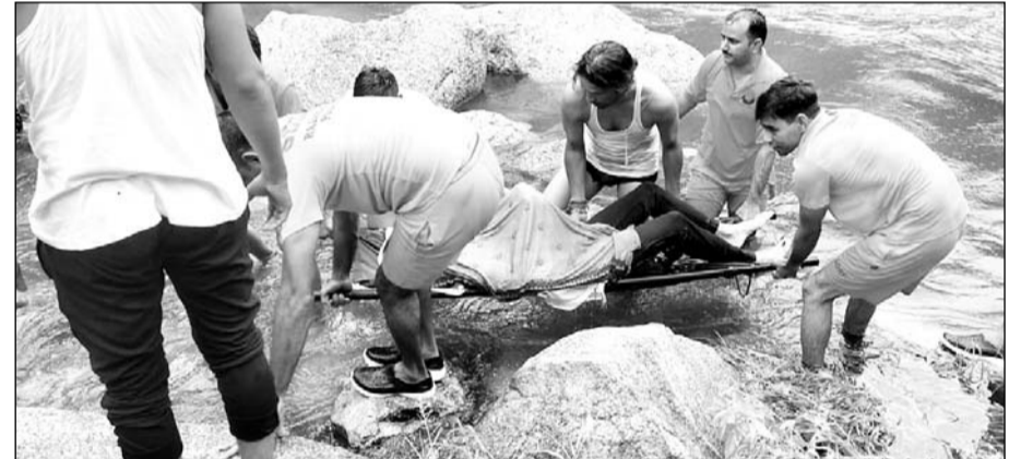
स्थानीय गोताखोरों की मदद से एसडीआरएफ की टीम ने शव को कुंड से बाहर निकाला।

स्वरूपगंज, (निसं)। स्वरूपगंज थाना क्षेत्र के काछोली गांव के पास आंबू की पहाडियों में गंगाजलिया कुंड में गहरे पानी में युवक डूब गया। सूचना पर स्वरूपगंज पुलिस मौके पर पहुंची और सूचना पर पहुंची एसडीआरएफ की टीम ने पांच घंटे की मशकत के बाद युवक के शव को बाहर निकलवाकर स्वरूपगंज अस्पताल की मोर्चरी में रखवाया। मामले में शुक्रवार को मृतक के परिजन आने के बाद शव को पोस्टमार्टम होगा।