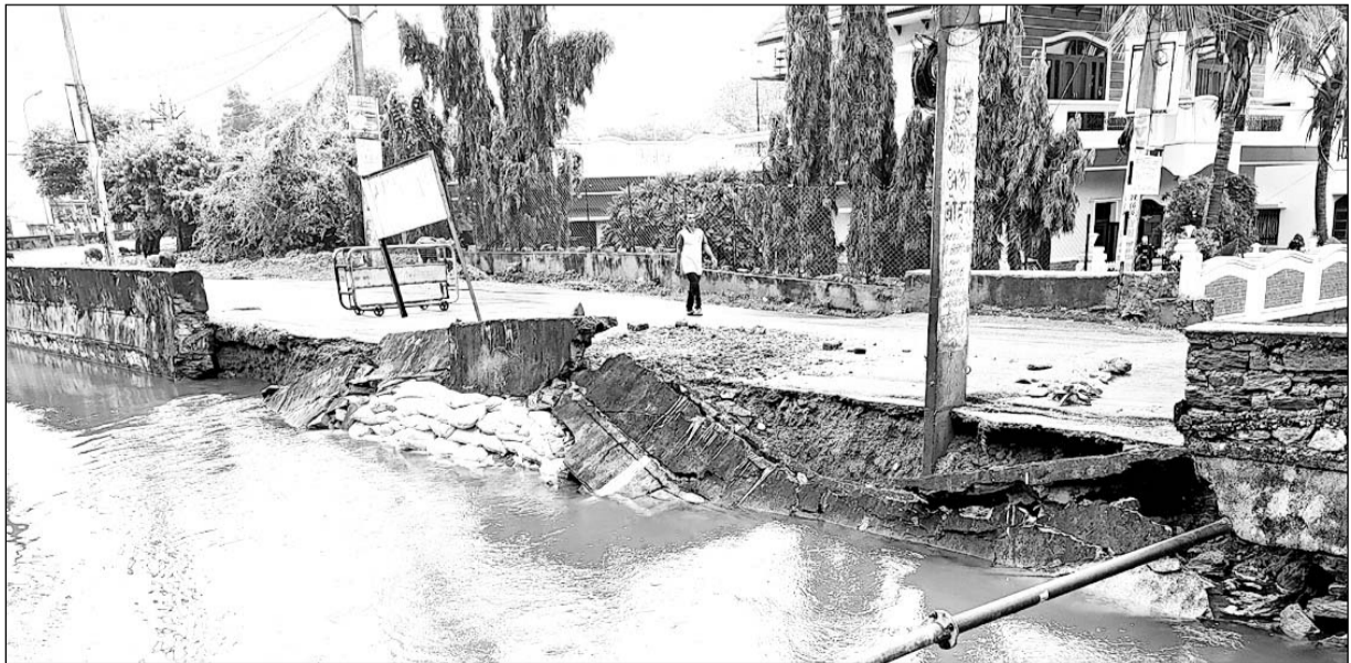
उदयपुर की मदार नहर के बुधवार को ढहे हिस्से की पूरी दीवार गुरुवार को भी धंस गई।

उदयपुर, (कासं)। शहर के नीमचखेड़ा पुलिया के समीप बुधवार को क्षतिग्रस्त हुई मदार नहर के दीवार का कुछ हिस्सा धंसने के बाद गुरुवार को हिस्से के आगे की दीवार भी ढहकर पानी में गिर गई। इधर पानी की आवक बढ़ने पर अब नहर का