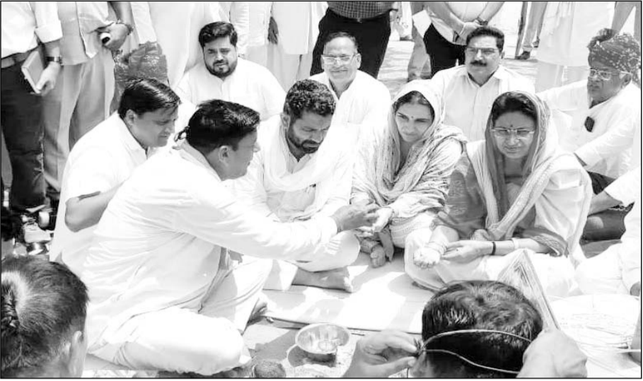
हनुमानगढ़ में उद्योग व वाणिज्य मंत्री शकुंतला रावत ने गोगामेडी मेले का पूजन कर शुभारंभ किया।

हनुमानगढ़,(कासं)। सांप्रदायिक सद्भावना के प्रतीक उत्तर भारत के प्रसिद्ध गोगामेडी मेले का शुभारंभ बुधवार को देवस्थान, उद्योग एवं वाणिज्य मंत्री शकुंतला रावत ने पूजा-अर्चना के बाद ध्वजारोहण कर विधिवत रूप से किया। ध्वजारोहण के बाद मंत्री रावत ने सभागीय आयुक्त व अन्य अधिकारियों व जनप्रतिनिधियों के साथ गोगाजी के दरबार में समाधि का दर्शन कर चादर व पुष्प चढ़ाए।