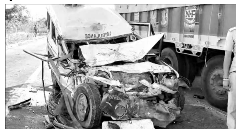
ट्रक व एंबुलेंस की टक्कर में एंबुलेंस गाड़ी क्षतिग्रस्त हो गई।