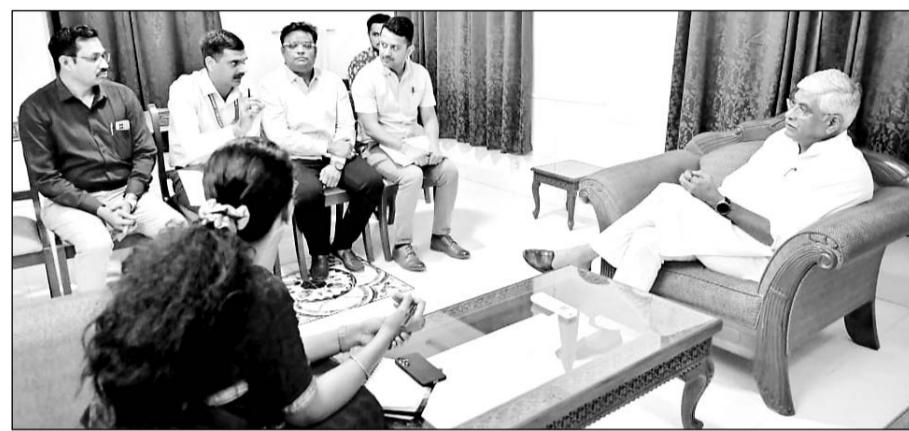
केंद्रीय मंत्री गजेंद्रसिंह शेखावत ( दांये से प्रथम ) ने सर्किट हाउस में आर्कियोलॉजिकल सर्वे ऑफ इंडिया के अधिकारियों के साथ सोनार किला की व्यवस्थाओं को लेकर चर्चा की।

जैसलमेर, (निसं)। केंद्रीय संस्कृति एवं पर्यटन मंत्री गजेंद्रसिंह शेखावत ने सर्किट हाउस में आर्कियोलॉजिकल सर्वे ऑफ इंडिया (एसआई) के अधिकारियों के साथ सोनार किले की व्यवस्थाओं को लेकर चर्चा की। उन्होंने कहा कि मुख्य विषय किले के द्वितीय द्वार को खोलने और पर्यटकों की