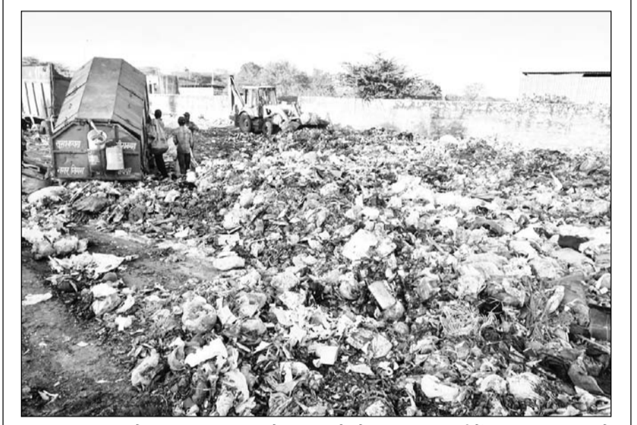
जयपुर नगर निगम ग्रेटर घर-घर कचरा कलेक्शन करके सेवापुर डंपिंग यार्ड में पहुंचा रहा था जिससे वहां कचरे का पहाड़ बन गया। अब पिछले 10 दिन से टोडी मोड़ पर एक निजी प्लॉट में कचरा डिपो बना दिया है जिससे वहां से गुजरने वाले लोगों का बदबू से हाल बुरा है।

धौलपुर जिले के पुलिस थाना बाड़ी से करीब डेढ़ साल पहले गायब हुए 11 साल के दिव्यांग बालक की तलाश पुलिस अभी नहीं कर पाई है। पुलिस की ओर से हाईकोर्ट में दायर तथ्यात्मक रिपोर्ट में पुलिस का कहना है कि 15 जून 2023 से लापता बालक की तलाश के लिए हमने 25 हजार के इनाम की भी घोषणा की है। बालक की तलाश में पुलिस टीम धौलपुर जिले, उत्तर प्रदेश और मध्य प्रदेश के सीमावर्ती जिलों में भेजी गई। बालक की तलाश के लिए उसके पोस्टर रेलवे स्टेशन और बस स्टैंड पर चस्पा किए गए। होटल, बाबों पर बालक की तलाश की गई। पिछले साल 31 दिसम्बर 2024 को बालक के पीवीसी कार्ड के लिए 50 रुपए का भुगतान हुआ। यह भुगतान किस बैंक, खाते अथवा ऑनलाइन ऐप के जरिए किया गया। उसकी जानकारी के लिए यूआईडीएआई रोजनल ऑफिस, दिल्ली को लिखा गया, लेकिन उन्होंने बिना हाईकोर्ट के आदेश के जानकारी देने से मना कर दिया।