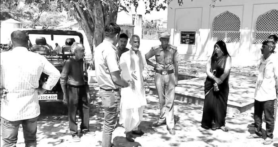
पुलिस ने मौका मुआयना कर मामले की जांच शुरू की।