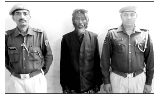
पुलिस गिरफ्त में बांग्लादेशी नागरिक।

अजमेर, (कासं)। अजमेर पुलिस की स्पेशल टास्क फोर्स द्वारा अवैध रूप से रह रहे बांग्लादेशी नागरिकों की धरपकड़ के लिए चलाए जा रहे अभियान में कार्रवाई करते हुए गुरुवार को चौथी कार्यवाही करते हुए दरगाह थाना पुलिस ने चोरी छिपे बांडर क्रॉस कर भारत में प्रवेश कर दरगाह क्षेत्र में रह रहे बांग्लादेशी को गिरफ्तार किया है।