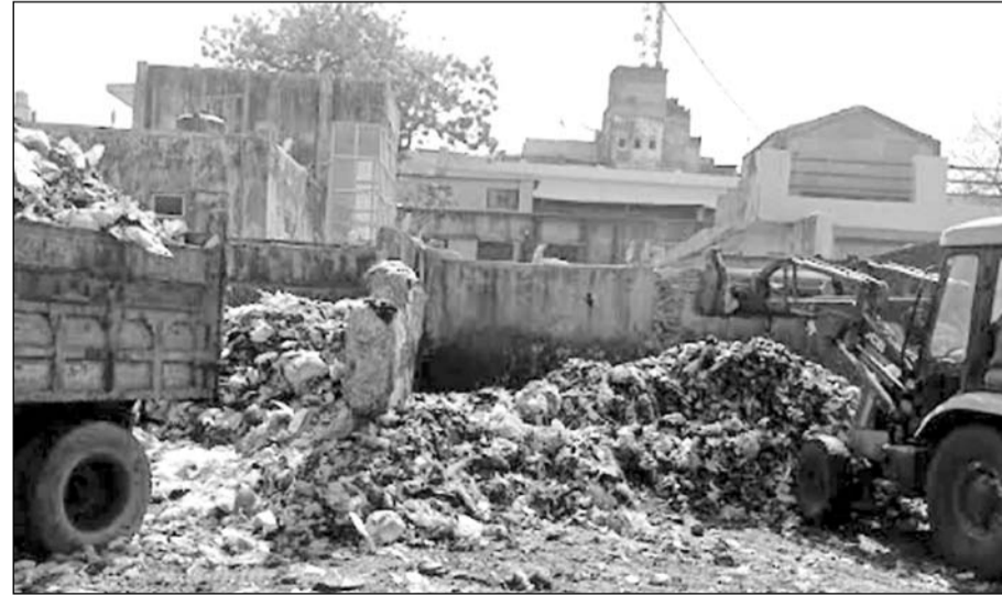
अजमेर के गंज क्षेत्र के मुख्य मार्ग पर लगा गंदगी का ढेर।

अजमेर, (निसं)। स्मार्ट सिटी कहलाने वाले अजमेर शहरभर में सरकारी आवासीय योजनाओं व कॉलेजियों में खाली पड़े भूखंडों सहित शहर के मुख्य मार्गों पर खाली स्थानों पर मिट्टी और निर्माण सामग्री का मलबा डाला जा रहा है। इससे न केवल आस-पड़ोस में गंदगी फैल रही है, बल्कि शहर की स्वच्छता रैंकिंग पर भी प्रतिकूल असर पड़ रहा है। अजमेर शहर की स्वच्छता रैंकिंग में गिरावट की सबसे बड़ी वजह सरकारी मशीनों की लापरवाही और आमजन की उदासीनता व जागरूकता में कमी है। वहीं गंज क्षेत्र में बना कचरा डिपो शहर की स्वच्छता में कौढ़ में खाज का काम कर रहा है। कमेवेश शहर भर में यही स्थिति बनी हुई है। तो वहीं आज भी शक्ति नगर वार्ड नम्बर में 54 की कई गलियों में डोर टू डोर कचरा संग्रहण करने वाला ऑटो टैपर नहीं आता है, जिसके कारण क्षेत्रवासी कचरा कॉलेजो के खाली प्लाटों में ही डाल देते हैं, जिसके कारण गंदगी का आलम बना हुआ है। अजमेर नगर निगम व अजमेर विकास प्राधिकरण की पंचशैल, हरिभाऊ उपाध्याय नगर, कोटड़ा