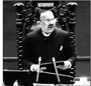
विधान सभा अध्यक्ष वासुदेव देवानी

से प्राप्त जवाब सदन के पटल पर आने के बाद उन्हें सभी के संज्ञान में आया हुआ माना जाता है। उन्होंने कहा कि ऐसी स्थिति में प्रश्नों और उनके जवाबों की पढ़ा नहीं जाता है। देवानी ने कहा कि विधानसभा में भी अब यही व्यवस्था रहेगी। उन्होंने कहा कि इससे सदन के महत्वपूर्ण समय के प्रत्येक पल का अधिक सदुपयोग होगा और प्रश्नकाल के निर्धारित समय में अधिक से अधिक प्रश्नों पर चर्चा हो सकेगी।