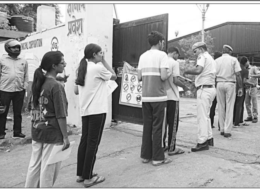
नीट परीक्षा देने पहुंचे अभ्यर्थियों को परीक्षा केंद्र में प्रवेश देने से पूर्व पुलिस ने उनकी गहनता से जांच की।

-कार्यालय संवाददाता- जयपुर। राष्ट्रीय पात्रता सह प्रवेश परीक्षा (नीट-यूजी) की पुनः परीक्षा रविवार को राजधानी जयपुर में कड़े सुरक्षा प्रबंधों और प्रशासनिक निगरानी के बीच शांतिपूर्ण एवं सुव्यवस्थित ढंग से संपन्न हुई। जयपुर जिले के 103 परीक्षा केंद्रों पर आयोजित परीक्षा में 37128 अभ्यर्थी पंजीकृत थे। जिनमें से 34031 अभ्यर्थी उपस्थित रहे, जबकि 3,097 अनुपस्थित रहे। इस प्रकार कुल उपस्थित 91.66 प्रतिशत दर्ज की गई। परीक्षा दोपहर 2 बजे शुरू होकर शाम 5:15 बजे समाप्त हुई। नेशनल टेस्टिंग एजेंसी (एनटीई) ने अभ्यर्थियों को 15 मिनट का अतिरिक्त समय दिया। परीक्षा समाप्त होने के बाद 22 गोदाम सिकिल, परकोटा क्षेत्र के प्रमुख बाजारों तथा शहर के कई व्यस्त मार्गों पर परीक्षाार्थियों और उनके परिजनों की भीड़ उमड़ने से यातायात व्यवस्था प्रभावित नहीं और कई स्थानों पर वाहन रंगते नजर आए। परीक्षा की संवेदनशीलता को देखते हुए इस बार अभूतपूर्व सुरक्षा व्यवस्था की गई थी। अभ्यर्थियों को परीक्षा केंद्र में प्रवेश से पहले श्री-लेयर सिक्वोरिटी जांच से