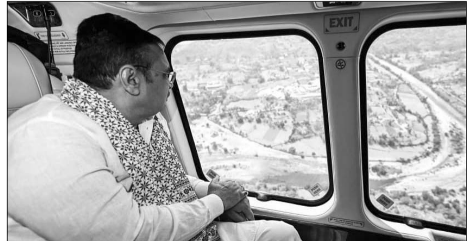
सीएम भजनलाल शर्मा ने देवास-3 एवं 4 पेयजल परियोजना का हवाई सर्वे किया।