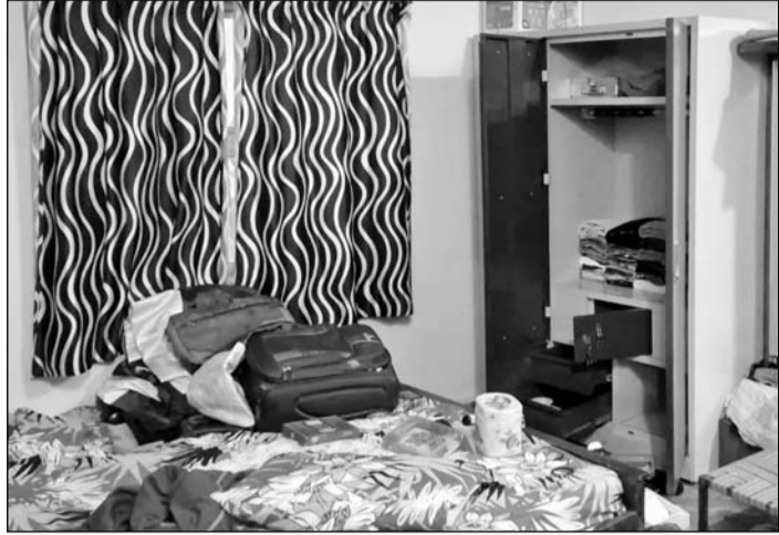
बदमाशों ने लूट करने के लिये अलमारियों में रखा सामान बिखेर दिया।

वारदात को अंजाम देने के बाद आरोपी घर में लगे सीसीटीवी कैमरों का डीवीआर भी अपने साथ ले गए। माना जा रहा है कि पहचान दिया गया ताकि वे किसी को सूचना न दे सकें। परिवार के अनुसार बदमाश कट्टों, रिवाल्वर और चाकुओं जैसे हथियारों से लैस थे। उन्होंने पूरे