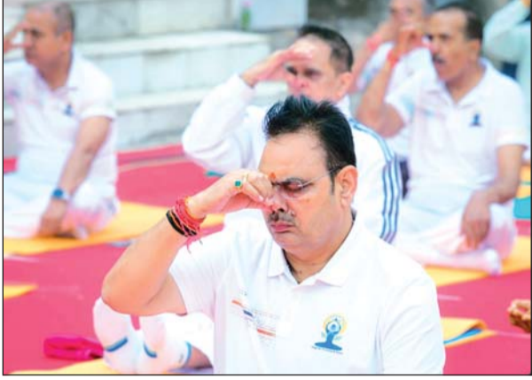
मुख्यमंत्री भजनलाल शर्मा ने अंतर्राष्ट्रीय योग दिवस के अवसर पर सिरोंही जिले के आबू राज में आयोजित राज्यस्तरीय कार्यक्रम में योगाभ्यास किया।

अंतर्राष्ट्रीय योग दिवस की थीम 'स्वस्थ वृद्धावस्था के लिए योग' है। इसका संदेश यह है कि योग केवल युवाओं तक सीमित नहीं, बल्कि यह बढ़ती उम्र के लोगों को भी शारीरिक रूप से सक्रिय, मानसिक रूप से संतुलित और भावनात्मक रूप से मजबूत रखने का सशक्त माध्यम है।