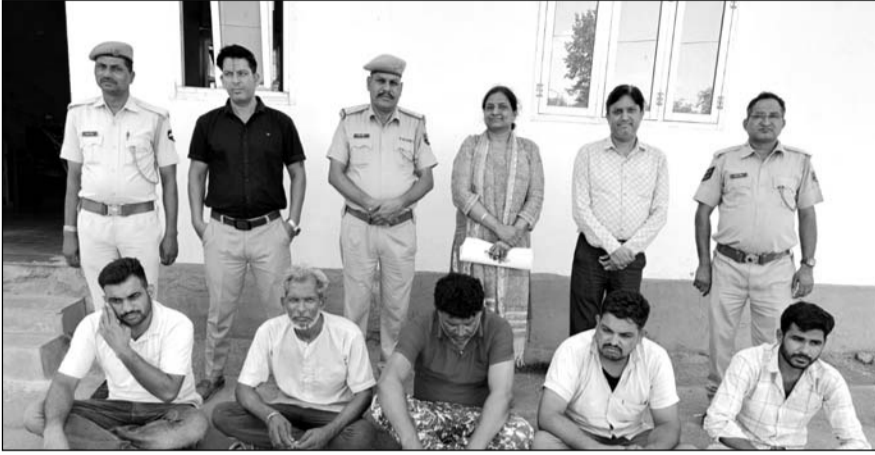
नसीराबाद पुलिस ने टैंकरों से अवैध रूप से गैस रिफिलिंग मामले में पांच जनों को हिरासत में लिया।