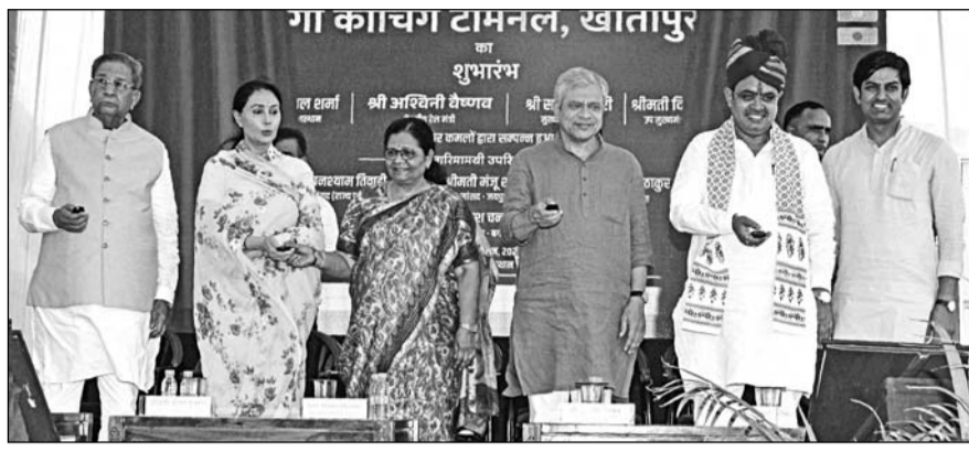
केंद्रीय रेल मंत्री अश्विनी वैष्णव और मुख्यमंत्री भजनलाल शर्मा ने रविवार को जयपुर के खातीपुरा रेलवे स्टेशन से जयपुर-दरभंगा अमृत भारत एक्सप्रेस रेल सेवा को हरी झंडी दिखाकर रवाना किया। इस मौके पर उपमुख्यमंत्री दीपा कुमारी तथा सांसद घनश्याम तिवारी व सांसद मंजू शर्मा मौजूद थे।

-कार्यालय संवाददाता- जयपुर। केंद्रीय रेल मंत्री अश्विनी वैष्णव और मुख्यमंत्री भजनलाल शर्मा ने रविवार को जयपुर के खातीपुरा रेलवे स्टेशन से जयपुर-दरभंगा अमृत भारत एक्सप्रेस रेल सेवा को हरी झंडी दिखाकर रवाना किया। इस अवसर पर रेल मंत्री ने सीकर जिले के खादूरग्रामजी क्षेत्र में सुंदरपुरा रेलवे स्टेशन के निर्माण की घोषणा करते हुए कहा कि नया स्टेशन खादूरग्रामजी से लगभग 11 किलोमीटर दूरी पर राष्ट्रीय राजमार्ग के निकट बनाया जाएगा। इसके लिए भूमि का चयन कर लिया गया है तथा अगले 12 महीनों में निर्माण कार्य पूरा करने का लक्ष्य रखा गया है। कार्यक्रम में उपमुख्यमंत्री दीपा कुमारी, राज्यसभा सांसद घनश्याम तिवारी, जयपुर शहर सांसद मंजू शर्मा सहित अनेक जनप्रतिनिधि उपस्थित रहे। वहीं बिहार के मुख्यमंत्री सम्राट चौधरी तथा दरभंगा सांसद गोपाल टाकुर वीडियो कॉन्फ्रेंस के माध्यम से कार्यक्रम से जुड़े।