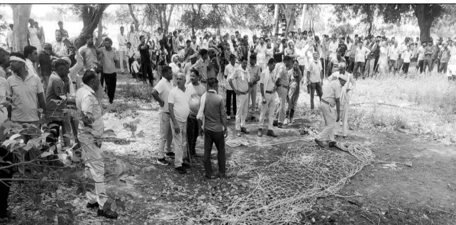
धौलागढ़ थाना पुलिस, वन विभाग के एसीएफ, रेंजर और सरिस्का टाइगर रिजर्व की विशेष रेस्क्यू टीम मौके पर पहुंची और पैथर को पकड़ने के प्रयास शुरू किये।

किसानों पर हमला करने के बाद पैथर भागकर पास ही मौजूद एक ऊंचे पेड़ पर चढ़ गया। वह पिछले कई घंटों से उसी पेड़ पर डेरा जमाए बैठा है। जैसे ही गांव में खबर फैली, पूरे इलाके में बैठसनी फैल गई। देखते ही देखते आसपास के कई गांवों से सैकड़ों ग्रामीण मौके पर जमा हो गए। लोगों के मन में पैथर को लेकर जहां एक तरफ भारी