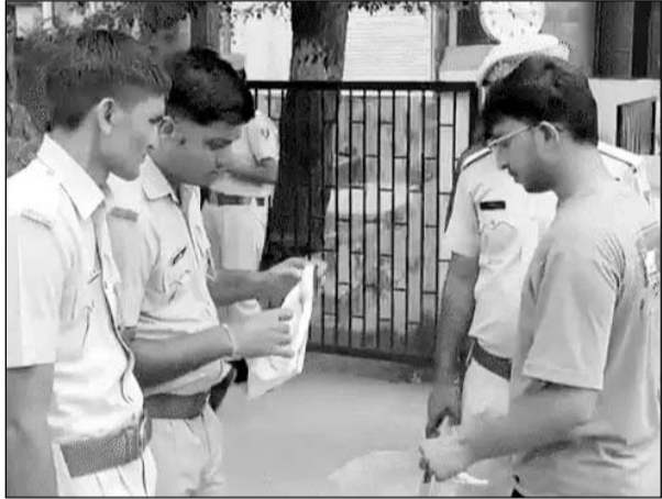
कैंडिडेट्स की जांच कर कड़ी सुरक्षा में एंट्री दी गई।

वहीं, एग्जाम शुरू होने से पहले ही बाबू शोभाराम राजकीय कला महाविद्यालय में महिला लेक्चरर (वीक्षक) की तबीयत बिगड़ गई। जिनको