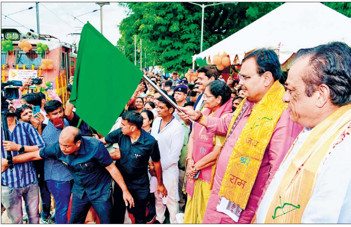
मु. मंत्री भजनलाल शर्मा ने मदुरई-रामेश्वरम् तीर्थ यात्रा स्पेशल ट्रेन को हरी झण्डी दिखाकर रवाना किया। इस मौके पर मु. मंत्री ने कहा कि राज्य सरकार इस वर्ष 36 हजार वरिष्ठ नागरिकों तीर्थ यात्रा करायेगी। राज्य सरकार ने वरिष्ठ नागरिकों की यात्रा एवं भोजन प्रबंधन के लिए 80 करोड़ का बजट तैयार किया है। सरकार करीब 6 हजार तीर्थ यात्रियों की हैलिकॉप्टर की जरिये काठमांडू (नेपाल) की यात्रा करायेगी।