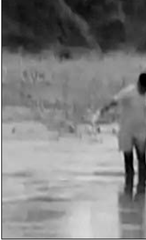
बांध के पानी से युवक का शव निकालती एसडीआरएफ टीम।

गंगापूर सिटी, (निर्स)। अमरगढ़ चौकी के पास स्थित सुमेल बांध में नहाते समय पैर फिसलने से डूबे युवक का शव 40घंटे की कड़ी मशकत के बाद एसडीआरएफ की टीम ने निकाल लिया। टीम को सोमवार सुबह करीब साढ़े 6 बजे यह सफलता मिली। बाद में शव को अमरगढ़ चौकी के सामुदायिक स्वास्थ्य केंद्र पर ले जाया गया और मेडिकल टीम से पोस्टमॉर्टम कराकर शव परिजनों को सौंप दिया है।