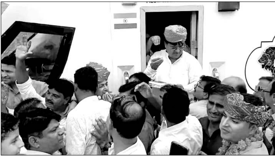
वंदे भारत ट्रेन के गंगापुर सिटी पहुंचने पर रेलवे चालक दल व गार्ड का स्वागत करती गंगापुर जनता।

देरी से 12 बजकर 3 मिनट पर पहुंची वंदे भारत ट्रेन के गंगापुर सिटी पहुंचने से पहले लोगों में ट्रेन को लेकर जबरदस्त उत्साह देखने को मिला। गंगापुर सिटी में वेस्ट सेंट्रल एंगलाइज