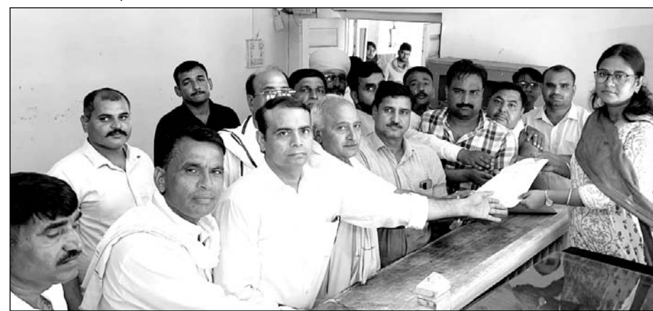
कर्मल बैसला की मूर्ति लगाने के लिए तहसीलदार को ज्ञापन सौंपते सर्वसमाज के लोग।

हिण्डौन सिटी। सामाजिक क्रांति के अग्रोहा रहे स्व. कर्मल किरोडी सिंह बैसला की नगर परिषद क्षेत्र में निर्धारित स्थान पर मूर्ति लगवाए जाने की मांग को लेकर सोमवार को सर्वसमाज के लोगों ने एसडीओ के नाम तहसीलदार को ज्ञापन सौंपा गया। इस दौरान बड़ी संख्या में उपस्थित सर्वसमाज के लोगों ने बाईस मास मार्ग स्थित पटेल नगर चौराहे पर कर्मल बैसला की मूर्ति लगाने की स्वीकृति देने एवं महवा मार्ग स्थित 220 केवी बिजली स्टेशन चौराहा का कर्मल किरोडी सिंह बैसला चौराहा नामकरण किए जाने की पुरजोर दंग से मांग रखी। कर्मल बैसला मिशन मूर्ति,