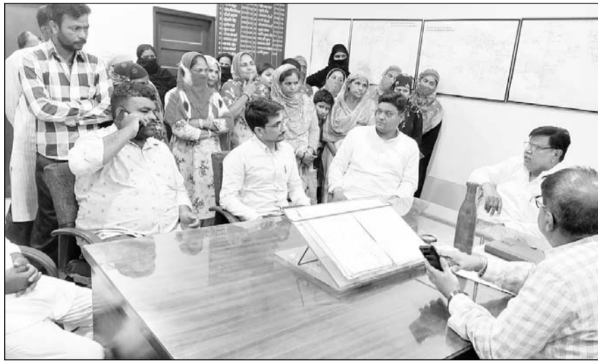
अजमेर में पानी की समस्या से जूझ रहे लोगों ने जलदाय विभाग कार्यालय पर विरोध जताया।

अजमेर, (कास)। छोटी नागफनी, टंकी के पास का इलाका एवं तारा शाह नगर आदि क्षेत्रों में गत लंबे समय से चली आ रही पानी की विकट समस्या को लेकर लगातार जलदाय विभाग के अधिकारियों से संपर्क कर रहे