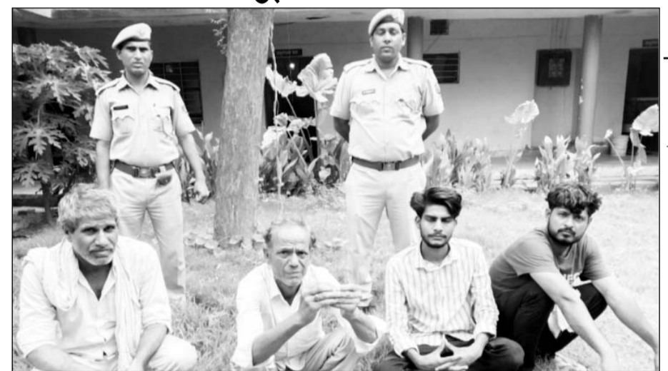
पुलिस की गिरफ्त में अवैध निर्माण करने के आरोपी।