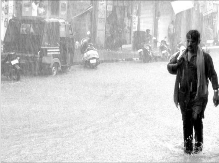
प्री-मानसून की जिला मुख्यालय पर हुई पहली बारिश के दौरान भीमता युवक।

राजसमंद, (निसं)। शहर सहित जिलेभर में पिछले तीन दिनों से लगातार उमस के बाद सोमवार दोपहर में हुई तेज बारिश ने लोगों को राहत दी। जिला मुख्यालय पर सुबह से ही आसमान में बादलों का डेरा था। दोपहर 12 बजे के बाद तेज हवाओं के साथ जोरदार शुरू हुई बारिश में चने के आकार के ओले गिरे। करीब एक घंटे तक चले बारिश के दौर के बाद जिला मुख्यालय पर 47 एमएम बारिश दर्ज की गई। जबकि नाकली क्षेत्र में 4.6 एमएम दर्ज की गई।