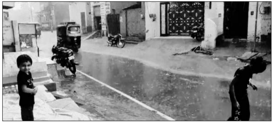
बीकानेर में हुई बारिश के दौरान अठखेलियां करते बच्चे।

बीकानेर, (कासं)। अंचल में दो दिन लगातार भीषण गर्मी के बाद सोमवार को आखिर इन्द्रदेव इलाके पर मेहरबान हुए। दोपहर तक उमस और गर्मी के बाद आसमान में छाए काले बादलों ने करीब तीन बजे बरसना शुरू किया। आधे घंटे से अधिक समय तक हुई बारिश से बीकानेर शहर की गलियों में पानी भर गया। बीकानेर में इन दिनों तापमान 44 डिग्री के आस-पास रह रहा है। सोमवार को बारिश से जहां लोगों को गर्मी से राहत मिली। वहीं साथ ही खरीफ की फसलों को भी जीवनदान मिल गया।