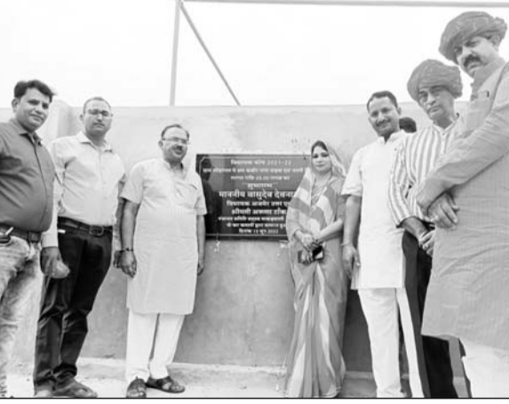
पूर्व शिक्षा मंत्री व अजमेर उत्तर के विधायक वासुदेव देवनानी ने सड़क और नाली निर्माण कार्य का शुभारंभ किया।

अजमेर, (कास)। पूर्व शिक्षा मंत्री व अजमेर उत्तर के विधायक वासुदेव देवनानी ने कहा है कि वे अजमेर उत्तर विधानसभा क्षेत्र के विकास में किसी तरह की कमी नहीं आने देंगे। चौतफा विकास कार्य कराए जा रहे हैं। लोगों को