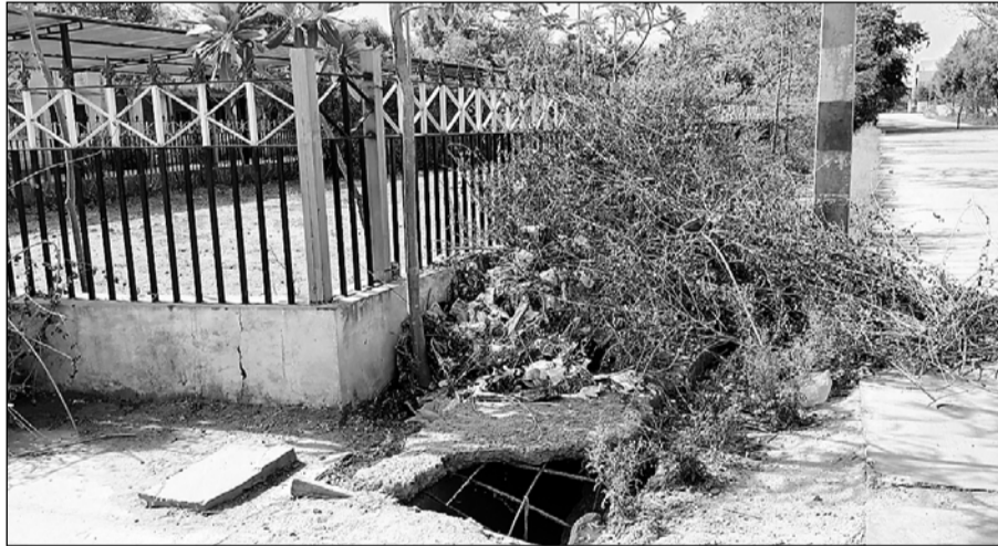
मालपुरा कोर्ट परिसर में कचरा डिपो बने पार्क में घटिया निर्माण से नाले क्षतिग्रस्त हो रहे हैं।

इतना ही नहीं नवीन न्यायालय भवन से जयपुर सड़क मार्ग तक बरसाती पानी