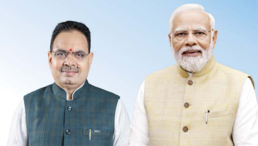
SH. BHAJAN LAL SHARMA Hon'ble Chief Minister, Rajasthan