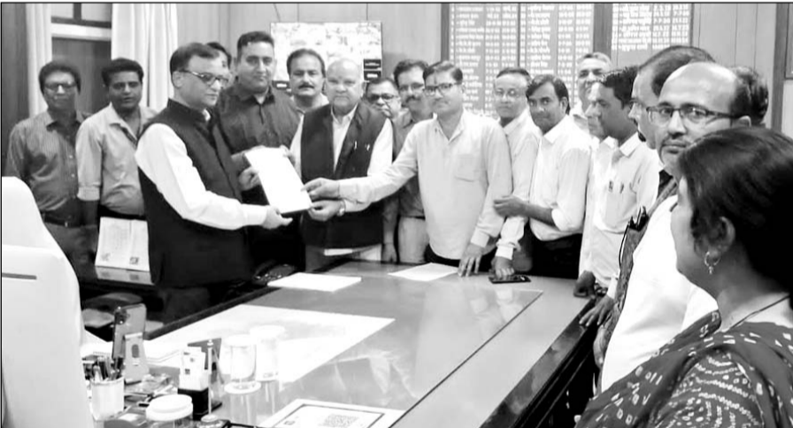
पत्रकारों की ओर से मुख्यमंत्री, गृहमंत्री एवं सूचना एवं जनसंपर्क मंत्री भजनलाल शर्मा के नाम जिला कलेक्टर को अपनी मांगों का ज्ञापन सौंपा गया।

पत्रकारों पर हमले के आरोपियों के खिलाफ सख्त कार्रवाई, घायल पत्रकारों को मुआवजा एवं पत्रकार सुरक्षा कानून लागू करने की रखी मांग