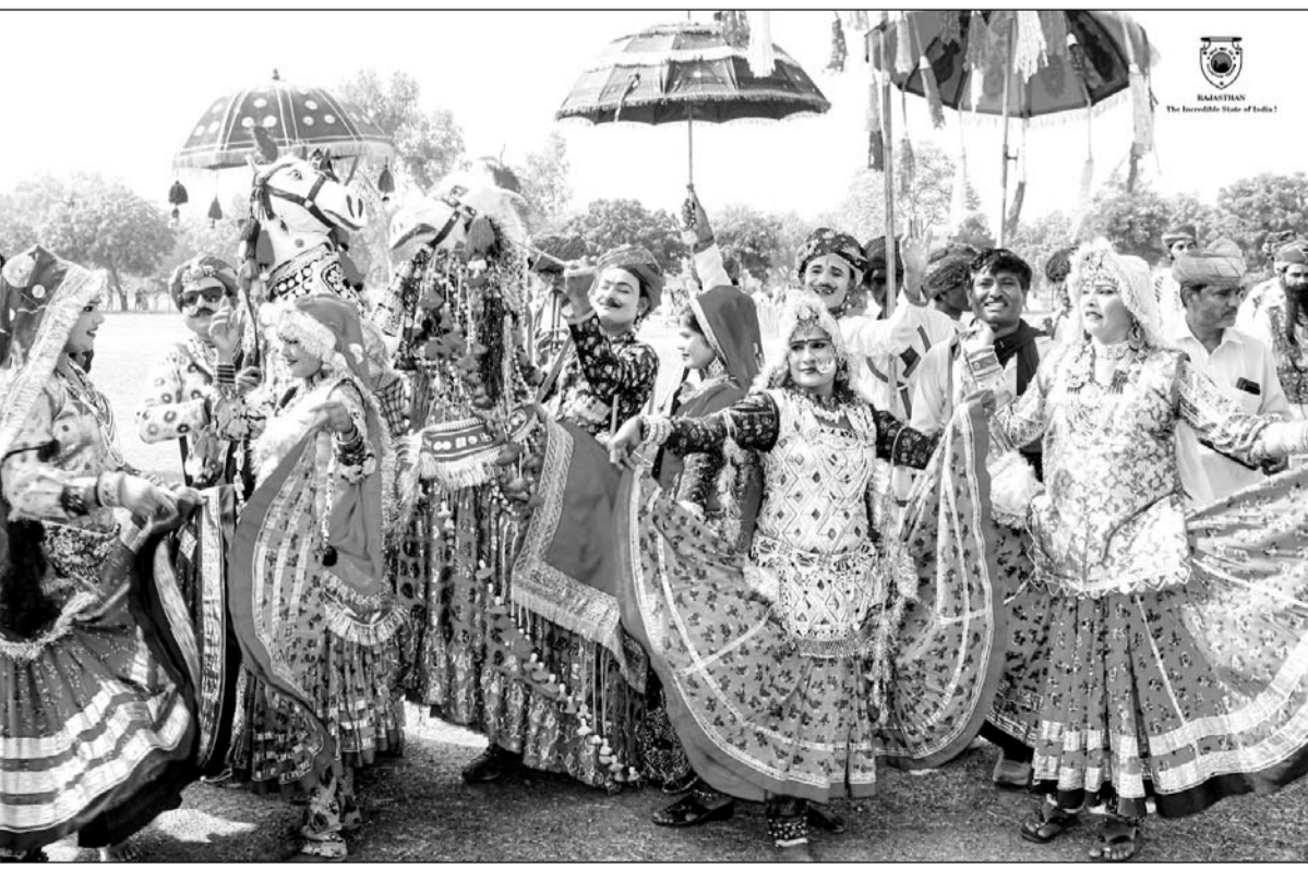
बूंदी महोत्सव के दौरान लोक कलाकारों ने संगीत की धुनों के बीच कच्ची घोड़ी नृत्य कर समां बांधा।