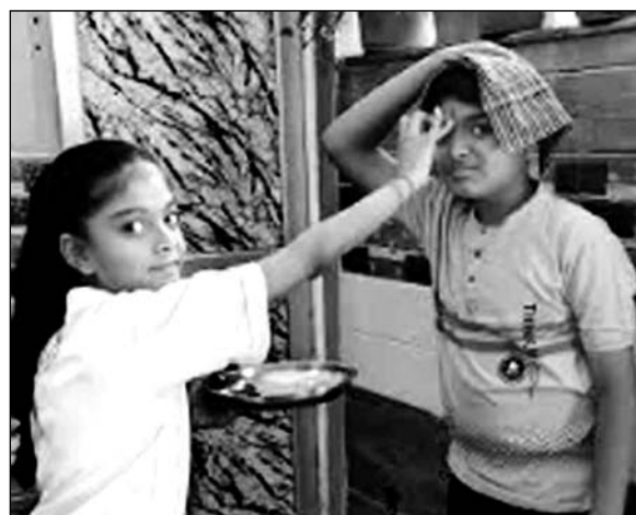
भैयादूज पर भाई का तिलक करते हुए बहन।

रविवार सुबह से ही क्षेत्र में बहनों ने पारंपरिक रीति-रिवाज के साथ अपने भाइयों को तिलक लगाकर उनकी दीर्घायु की कामना की। छोटी उम्र में भी पूर्व को लेकर खासा उत्साह था। उधर दूदराज के क्षेत्रों से अपने भाइयों को तिलक लगाने के लिए आने वाली बहनों के चलते सुबह