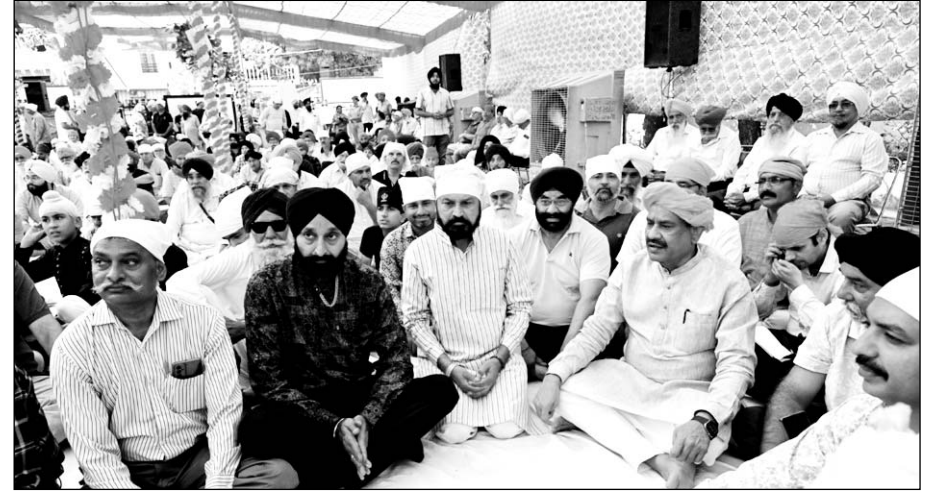
कोटा में लोकसभा अध्यक्ष ओम बिरला ने गुरुद्वारे में माथा टेका है।

सीसीटीवी निगरानी: रेलवे स्टेशनों और प्लेटफार्मों पर सीसीटीवी कैमरों के माध्यम से निगरानी बढ़ाई गई है, ताकि संदिग्ध गतिविधियों पर नजर रखी जा सके।