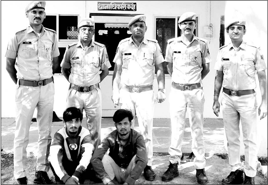
दिवेर थाना पुलिस ने युवक पर जानलेवा हमला करने के आरोपियों को गिरफ्तार किया।