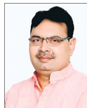
मुख्यमंत्री भजनलाल शर्मा

जयपुर, 03 नवम्बर। मुख्यमंत्री भजन लाल शर्मा के नेतृत्व में 9 से 11 दिसंबर तक राजधानी जयपुर में आयोजित होने वाले 'राइजिंग राजस्थान' ग्लोबल इन्वेस्टमेंट समिट-2024 को सफल बनाने के लिए राज्य सरकार बड़े पैमाने पर देशी और विदेशी निवेशकों, संस्थाओं और कॉर्पोरेट जगत के शीर्ष अधिकारियों से लगातार बैठकें कर रही है, ताकि आने वाले समय में प्रदेश में बड़े पैमाने पर निवेश हो सके और 'विकसित राजस्थान' के लक्ष्य को पूरा करने की ओर बढ़ाया जा सके।