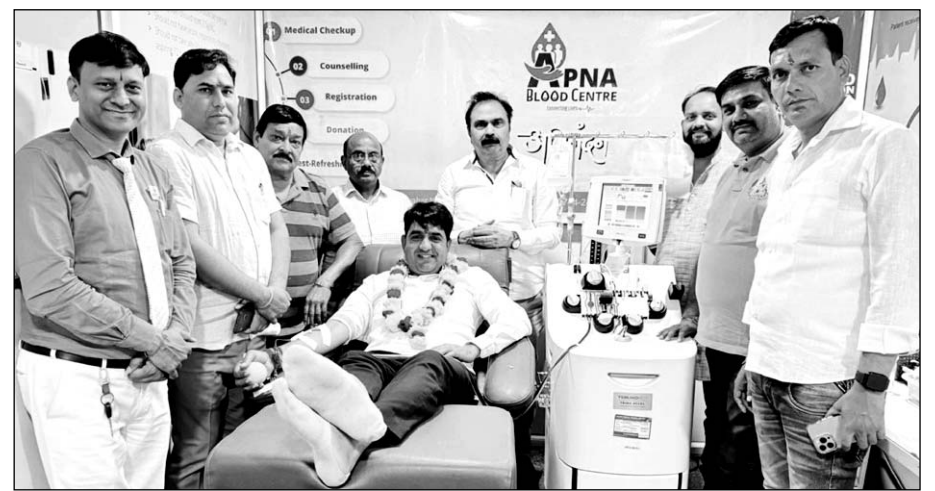
कोटा दक्षिण नगर निगम के उप महापौर पवन मीणा ने एसडीपी डोनेट की।

व्यस्त नजर आ रहे थे, लेकिन जब कोचिंग स्टूडेंट की बात सामने आई तो अपना जन्मदिवस मना रहे कोटा दक्षिण के उपमहापौर पवन मीणा ने मैसजे देखा तो उन्होंने इस अवसर को सेवा के लिए चुना और वह सीधा अपना ब्लड सेंटर