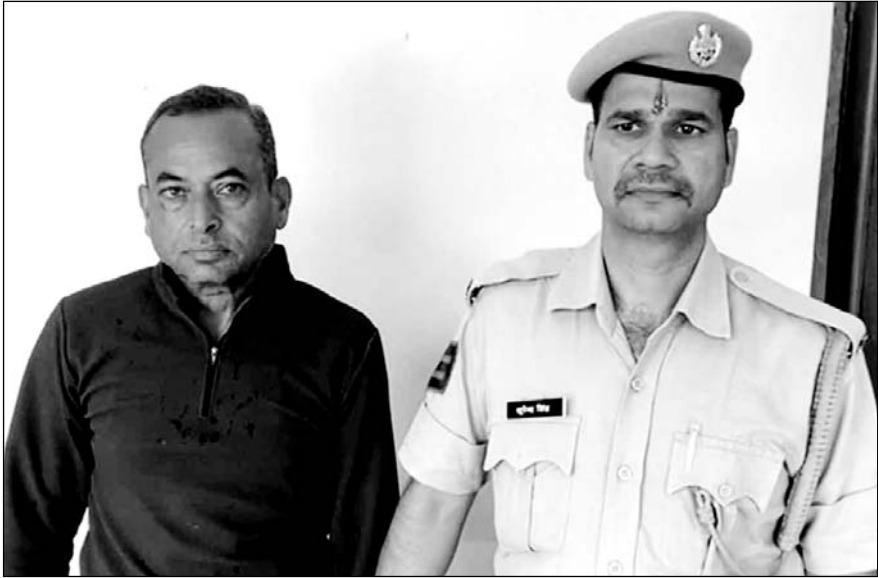
पुलिस ने धमकी देने के आरोपी को गिरफ्तार किया।