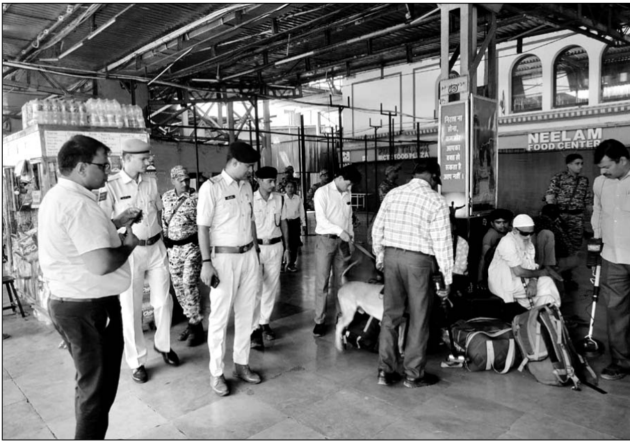
रेलवे के द्वारा सुरक्षा के पुख्ता बंदोबस्त किए गए हैं।

कोटा से कोटा-दानापुर सहित कोटा होकर विभिन्न रूटों पर स्पेशल ट्रेनों को चलाया जा रहा है। यात्री सुविधा का लाभ लेते हुए स्पेशल ट्रेन के उद्धारव की विस्तृत जानकारी स्टेशन, रेल मंद