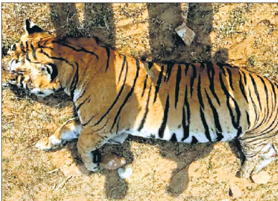
सवाई माधोपुर के रणथम्भौर नेशनल पार्क के निकट उलियाना गांव के पास टाइगर टी-86 की अज्ञात लोगों ने पत्थर एवं धारदार हथियारों से हत्या कर दी।

उन्होंने कहा कि लोगों की भीड़ के चलते पैथर हमलावर हो गया और डरकर छुप कर बैठ गया, हो सकता है कि अंधेरे में रिहायशी इलाका छोड़ जंगल व पहाड़ी में चला गया हो, फिर भी पहचान के तौर पर लोगों को सावधानी बरतने की आवश्यकता है।