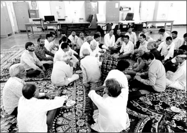
ग्रामवासियों ने अन्नकूट चंदा राशि की गिनती की।