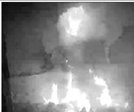
सज्जन एजेंसी के चप्पल गोदाम में भीषण आग से माल जल गया।