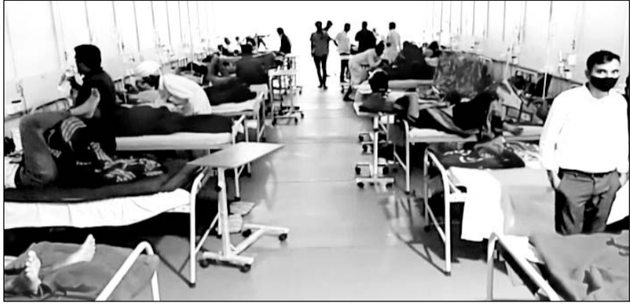
बाड़मेर में डेंगू के मरीज बढ़ने से अस्पताल में बैड कम पड़ रहे हैं।

बाड़मेर जिला अस्पताल और वेदान्ता अस्पताल के सभी वार्ड फुल