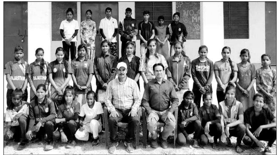
उदयपुर में राज्य स्तर के लिए चयनित हुए खिलाड़ी।

जिला स्तरीय विद्यालय खेलकूद प्रतियोगिता उदयपुर में हुई सम्पन्न