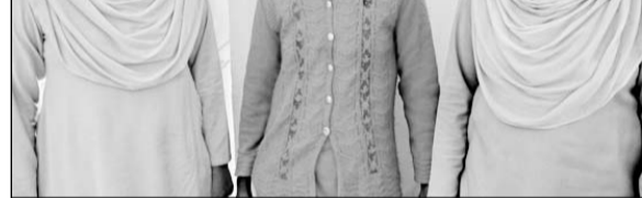
सास की हत्या करने करने वाली बहू पुलिस गिरफ्तार में।

उदयपुर, (कासं)। आपसी विवाद में फावड़े से हमला कर सास की हत्या करने वाली बहू को पुलिस ने गिरफ्तार किया। शहर के हिरणमगरी थाना क्षेत्र पाराखेत कलडवास निवासी