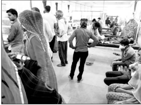
धोरिमत्रा अस्पताल की अब्यवस्थाओं से परेशान लोग।

बाड़मेर, (निसं)। बाड़मेर में कोरोना के कहर के बाद अब डेंगू के डंक ने सांस फूला दी है। मौसमी बीमारियों के बीच बाड़मेर में डेंगू का कहर थमने का नाम ही नहीं ले रहा है। लगातार बढ़ते मरीजों से जिला अस्पताल के वार्डों के बेड फुल हो गए हैं और लगातार डेंगू मरीजों में बढ़ती चलाते वेदान्ता का सौ बेड का फील्ड अस्पताल भी अब हाउसफुल हो चुका है।