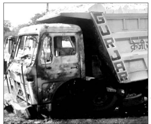
पीपरडा के समीप फोरलेन पर डीजल टैंक फटने से अचानक लगी आग से जला डम्पर का कैबिन।

इधर, घटना की सूचना मिलने पर मौके पर पहुंची राजनगर थाना पुलिस ने दमकल बुलाकर काफी मशकत के बाद आग पर काबू पाया और यातायात संचार किया। हालांकि आगजनी से कोई जनहानि नहीं हुई। लेकिन, घटना के बाद डम्पर चालक व खलासी दोनों मौके से फरार हो गए। घटना को लेकर पुलिस जांच में जुटी हुई है।