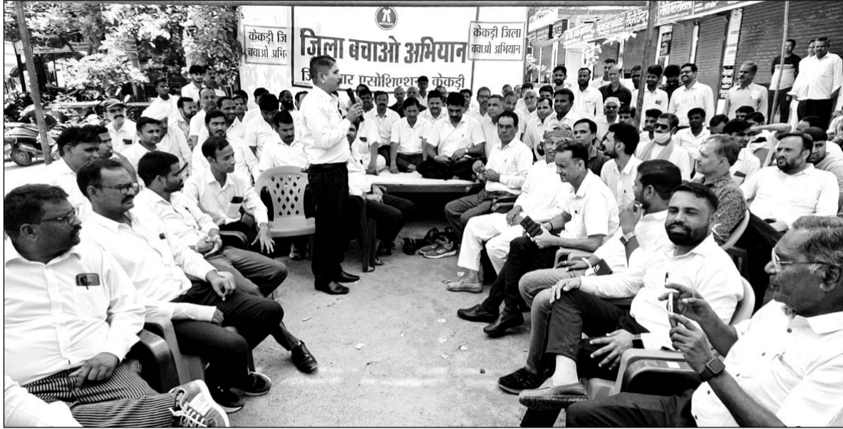
केकड़ी जिले को यथावत रखने की मांग को लेकर केकड़ी में जिला बार एसोसिएशन ने पेन डाउन हड़ताल कर प्रदर्शन किया।

इस मौके पर अधिवक्ताओं ने कहा कि केकड़ी जिला हम सब का मान और सम्मान है सरकार केकड़ी जिले को हटाने का फैसला लेती है तो सरकार के खिलाफ वो उग्र आन्दोलन करेंगे। इस मौके पर अधिवक्ताओं ने कहा कि केकड़ी जिला सरकार को करोड़ों का राजस्व दे रहा है फिर भी सरकार जिले के बजट का रोना रो रही है। अधिवक्ताओं ने कहा कि केकड़ी जिला हर मापदण्ड पर खरा उतरता है, जिला हटाने के संकेतों के बाद से ही आमजन में भारी निराशा है। जिला बनने के बाद केकड़ी जिले के लाखों