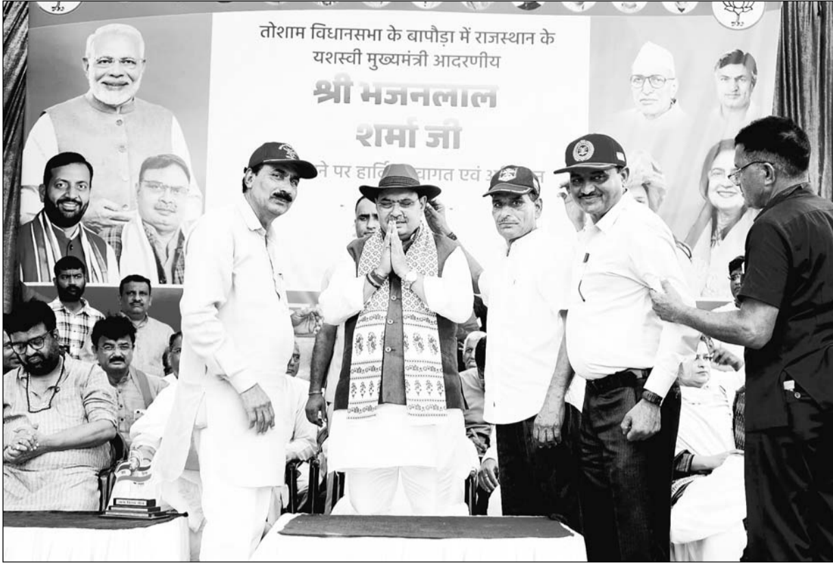
मुख्यमंत्री भजनलाल शर्मा ने शुक्रवार को हरियाणा के असंध व तोशाम में भाजपा प्रत्याशियों समर्थन के में चुनावी सभायें कीं।