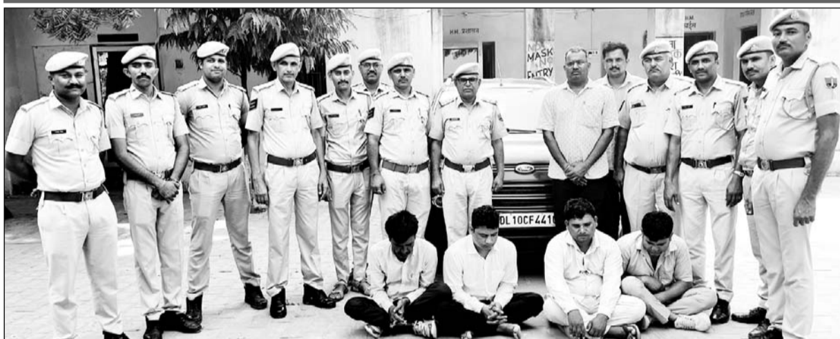
तखतगढ़ थाना पुलिस ने बसों में गहने चोरी करने वाली हरियाणा की सांसी गैंग के चार बदमाशों को गिरफ्तार किया।

बस में सवार महिला के बैग के चीरा लगाकर लाखों के गहने चोरी कर ले गए थे